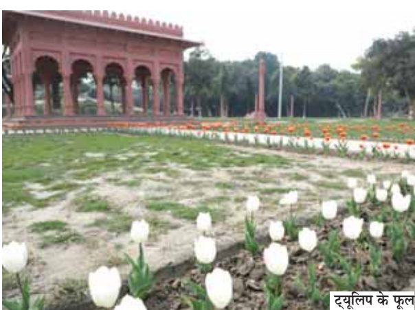
ट्यूलिप के फूल

बसंत पंचमी के साथ बसंत ऋतु का आगमन हो चुका है। कश्मीर का ट्यूलिप फेस्टिवल काफी फेमस है। ये फूलों का त्यौहार न केवल अपनी सुंदरता के लिए जाना जाता है, बल्कि यह बसंत ऋतु के आगमन का भी प्रतीक माना जाता है। इस कड़ी में पहली बार राजधानी दिल्ली में एनडीएमसी के अलावा अन्य क्षेत्र-विशेषकर लुटियन जोन इस वसंत में ट्यूलिप से सजा हुआ है। दिल्ली विकास प्राधिकरण ने राजधानी के अपने विभिन्न पार्कों में 1 लाख ट्यूलिप लगाए हैं, जो लुटियन जोन में एनडीएमसी द्वारा लगाए गए विभिन्न पार्कों के 4 लाख से अधिक ट्यूलिप के अतिरिक्त हैं। इसके कारण रोहिणी, द्वारका, आईएसबीटी