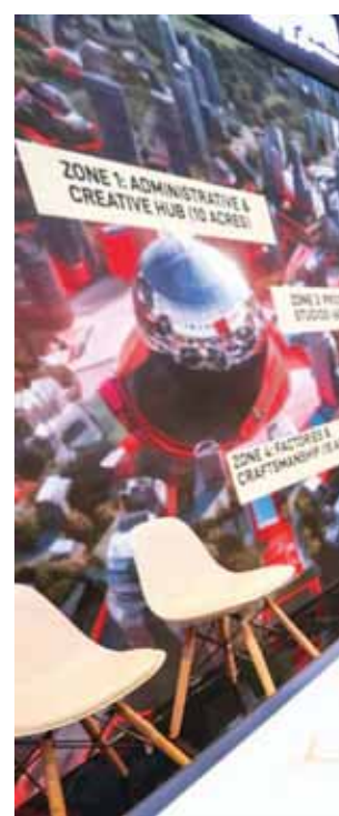
जीबीसी-4.0 में फिल्म सिटी का अवलोकन करते प्रधानमंत्री नरेंद्र मोदी

इस मौके पर मुख्यमंत्री ने कहा कि पिछले 10 वर्षों में हमारा देश 11वीं अर्थव्यवस्था से 5वीं अर्थव्यवस्था के रूप में स्थापित हुआ है। प्रधानमंत्री मोदी के तीसरे कार्यकाल में भारत दुनिया की तीसरी अर्थव्यवस्था बनेगा, इसमें किसी को कोई संदेह नहीं। यह मोदी की गारंटी है, इस पर यूपी को भी यकीन है। इस संकल्प के साथ जुड़ते हुए उत्तर प्रदेश ने स्वयं को वन ट्रिलियन डॉलर की अर्थव्यवस्था बनाने का लक्ष्य रखा है। इसके लिए हमने स्कूल, स्कूल और स्पीड पर फोकस किया है। आप सभी उद्यमियों का सहयोग मिलता रहा तो यह लक्ष्य निश्चित ही सिद्ध होगा।