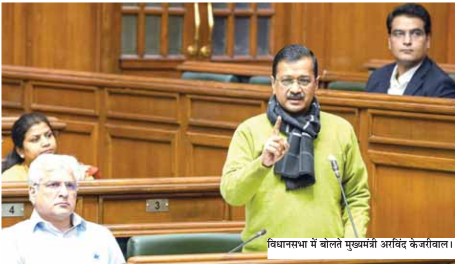
विधानसभा में बोलते मुख्यमंत्री अरविंद केजरीवाल।

अरविंद केजरीवाल विधानसभा में बजट सत्र के दौरान वन टाइम सेटलमेंट स्कीम पर चर्चा के लिए पेश संकल्प पत्र पर बोल रहे थे। उन्होंने कहा कि अगर भाजपा ने स्कीम पास नहीं करने दिया तो इसके विरोध में बड़ा आंदोलन आंदोलन होगा। क्योंकि यह स्कीम लागू होने से 90 फीसद पानी उपभोक्ताओं का बिल माने हो जाएगा। साथ ही, सरकार से सक्बिडी मिलने से जल बोर्ड को करोड़ों रुपये का राजस्व भी मिल जाएगा। फिर भी इस स्कीम को रोकने के लिए अफसरों को धमकी दी जा रही है कि अगर स्कीम पास की तो उन्हें छोड़ा नहीं जाएगा। इसलिए मेरी एलजी से हाथ जोड़कर विनती है कि वो नौकरशाहों को योजना पास करने को कहें, अगर तब भी नहीं करते हैं तो उनको निलंबित करें। बोले दिल्ली पूर्ण राज्य होता तो मुख्यमंत्री या मंत्री का आदेश नहीं मानने वाला अफसर अपने पद पर दो मिनट भी नहीं रह पाता।