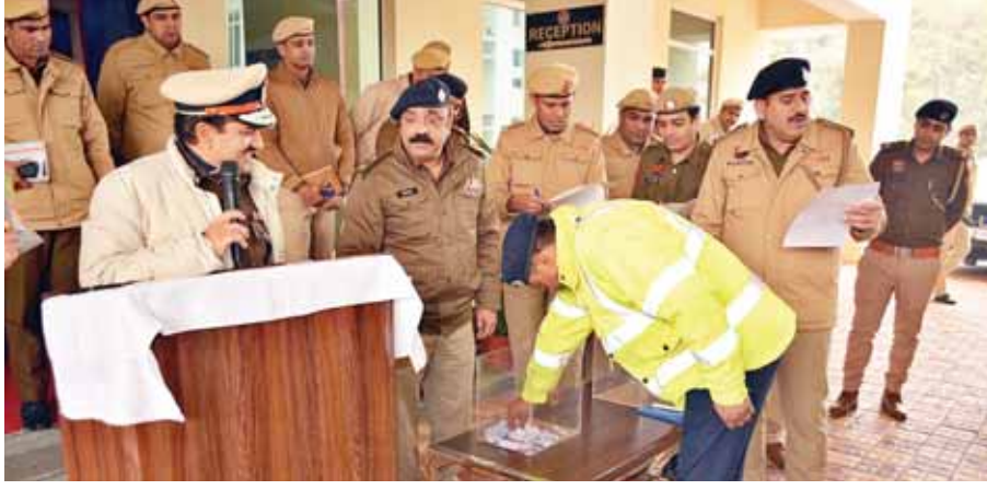
पुलिस आयुक्त की मौजूदगी में जोनल अधिकारियों के तबादलों का ड्रा निकालते कर्मचारी।