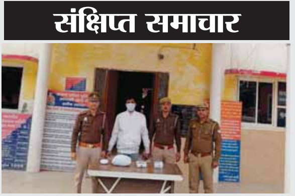
जब चरस और गांजे के साथ पुलिस गिरफ्त में आरोपी।