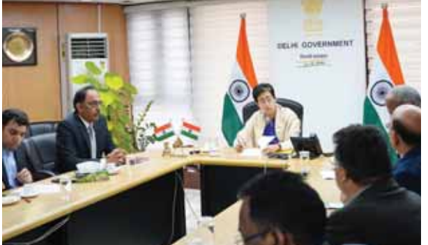
पीडब्ल्यूडी और कानून विभाग के अधिकारियों संग समीक्षा बैठक में आतिशी।

कानून मंत्री आतिशी ने द्वारका सेक्टर-19 स्थित ज्यूडिशियल ऑफिसर्स रेंजिडेंशियल कामप्लेक्स के खराब निर्माण के जिम्मेदार अफसरों को निलंबित करने को कहा है। आतिशी बुधवार को परिसर में घंटिया निर्माण कार्य को लेकर पीडब्ल्यूडी और कानून विभाग के उच्चाधिकारियों के साथ समीक्षा बैठक की। बैठक में अधिकारियों ने मंत्री के साथ साझा किया कि वर्ष 2014 में शुरू हुआ ज्यूडिशियल ऑफिसर्स के लिए तैयार किए जा रहे 70 फ्लैटों का निर्माण कार्य धीमी गति से चला और साथ ही निर्माण कार्य के पूरा होने से पूर्व ही उसमें