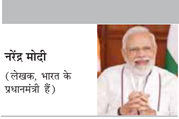
नंदर मोदी (लेखक, भारत के प्रधानमंत्री हैं)

वैकैया नायडू ने संघ परिवार के साथ काम करना पसंद किया, क्योंकि उनकी आस्था राष्ट्र प्रथम के विजन में थी। उन्होंने विचार को व्यक्तिगत हितों से ऊपर रखा और बाद में जनसंघ एवं बीजेपी को मजबूत किया।