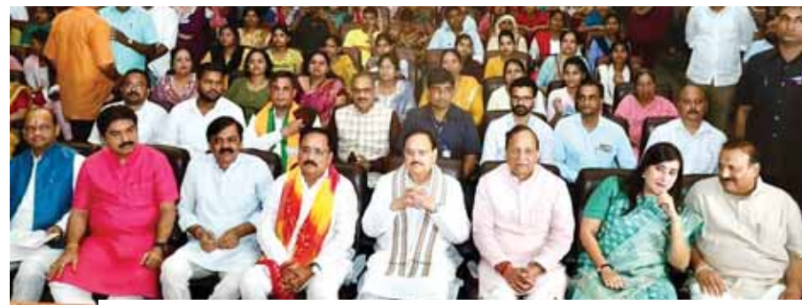
आरके पुरम में मन की बात कार्यक्रम में भाजपा के राष्ट्रीय अध्यक्ष जेपी नड्डा साथ वरिष्ठ भाजपा नेता व सांसद।

प्रधानमंत्री नरेंद्र मोदी का लोकसभा चुनावों में जीत के बाद और अपनी तीसरे कार्यकाल के पहले मन की बात दिल्ली भाजपा ने विभिन्न स्थानों पर कार्यक्रम का आयोजन आरंभ कर दिया। कार्यक्रम में भाजपा के राष्ट्रीय अध्यक्ष जगत प्रकाश नड्डा के साथ दिल्ली भाजपा पदाधिकारी, सांसद, विधायक एवं निगम पार्षद