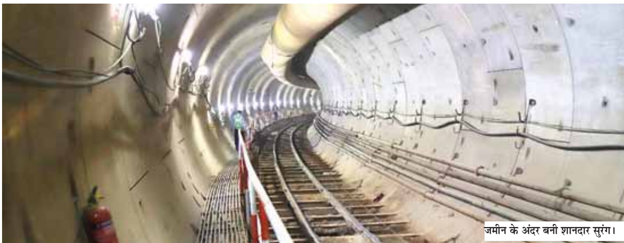
जमीन के अंदर बनी शानदार सुरंग।

खोलना है। हालांकि विस्तार के फेज-4 का कार्य दिसंबर 2019 में निविदाओं को अंतिम रूप देने के तुरंत बाद शुरू हो गया था, लेकिन कोविड महामारी और पेड़ काटने की अनुमति मिलने में देरी के कारण 2020 से 2022 तक कार्य की प्रगति लगभग तीन वर्षों तक काफी प्रभावित विभिन्न स्तरों पर निगरानी की जा रही