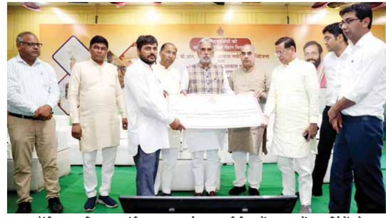
केंद्रीय सहकारिता राज्य मंत्री कृष्णपाल गुर्जर एचएसवीपी कन्वेंशन हॉल में लाभाधिकियों को पेंशन/आवास नवीनीकरण योजना सॉल्यूशंस वितरण करते हुए।