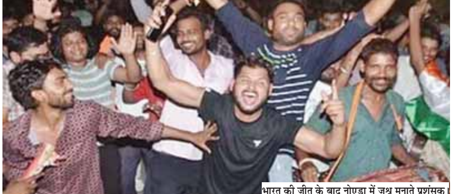
भारत की जीत के बाद नोएडा में जश्न मनाते प्रशंसक।

और बम की आवाज हर तरफ से सुनाई देती रही। गाजियाबाद में कई थिएटर, चौराहों, हाईराइज सोसाइटीज में बिग स्क्रीन पर इस मैच का लुफ्त लिया गया। भारत की जीत होते ही खूब