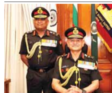
जनरल उपेंद्र द्विवेदी ने जनरल मनोज पांडेय (बाएं) से थलसेना अध्यक्ष का पदभार संभाला।

टी20 विश्व कप में जीत के बाद रोहित शर्मा और विराट कोहली। भट्टे का शौकीन दिल्ली वाला लेकिन फिर भी पिछले 15 साल से दोनों एक दूसरे के पूरक रहे हैं। दुख में, खुशी में, जीत में और हार में। वेस्टइंडीज में दक्षिण अफ्रीका को हराकर टी20 विश्व कप जीतने के बाद रोहित मैदान पर लेट गए, आंखें आंसुओं से भीगी थीं। वहीं कोहली अपनी भावनाएं छिपाते कुछ देर के लिए चुपचाप ड्रेसिंग रूम में चले गए। वह जीत का जश्न मनाया चाहते थे लेकिन अकेले भी रहना चाहते थे। दोनों के बीच साझा क्या है, एक दूसरे के हुनर और उपलब्धियों का सम्मान। रोहित को बखूबी पता था कि कोहली ने संन्यास का फैसला ले लिया है, फाइनल का नतीजा चाहे जो हो। यही वजह है कि मैच के बाद मुस्कुराकर वितरण में रोहित ने उन्हें वह मौका दिया और अपने संन्यास का ऐलान नहीं किया। उन्होंने प्रेस कॉन्फ्रेंस में इसकी घोषणा की। जब एक ही दौर में दो दिग्गज साथ खेल रहे हों तो मतभेद होना लाजमी है क्योंकि कहते हैं ना कि एक म्यान में दो तलवारें नहीं रह सकती। (शेष पेज 9)