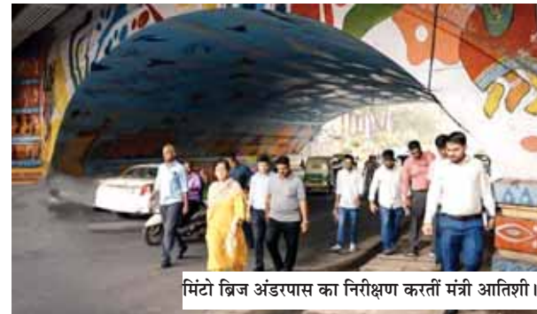
मिंटो ब्रिज अंडरपास का निरीक्षण करतीं मंत्री आतिशी।

कनॉट प्लेस के निकट मिंटो ब्रिज अंडरपास में गत शुक्रवार को भारी बारिश के बाद जलजमाव से वाहन चालकों को परेशानी का सामना करना पड़ा। इससे जाम की स्थिति भी बनी रही। जल जमाव से निपटने के लिए पीडब्ल्यूडी मंत्री आतिशी ने