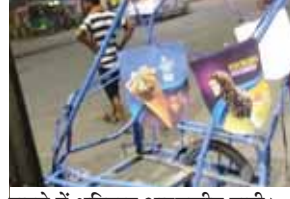
हादसे में क्षतिग्रस्त आइसक्रीम गाड़ी।

भारत के विश्वकप जीतने के बाद हर तरफ जीत का जश्न मनाया जा रहा है। लेकिन इसी बीच नोएडा में एक बड़ा हादसा हो गया है। सेक्टर-52 टी-पाइंट पर शराब के नशे में धुत जीत का जश्न मनाते वाले रहसिवाजों ने आइसक्रीम वेंडर को रौंदा डाला। जिसमें आइसक्रीम बेचने वाला बुरी तरह से जखमी हो गया है। जानकारी के मुताबिक 29 जून को रात को टी20 वर्ल्ड कप के फाइनल मैच को भारतीय क्रिकेट टीम के जीतने के बाद करीब डेढ़ बजे कुछ युवक जश्न मनाते हुए गाड़ी से जा रहे थे। इसी दौरान उन्होंने थाना सेक्टर-24 क्षेत्रांतर्गत होशियारपुर रेड