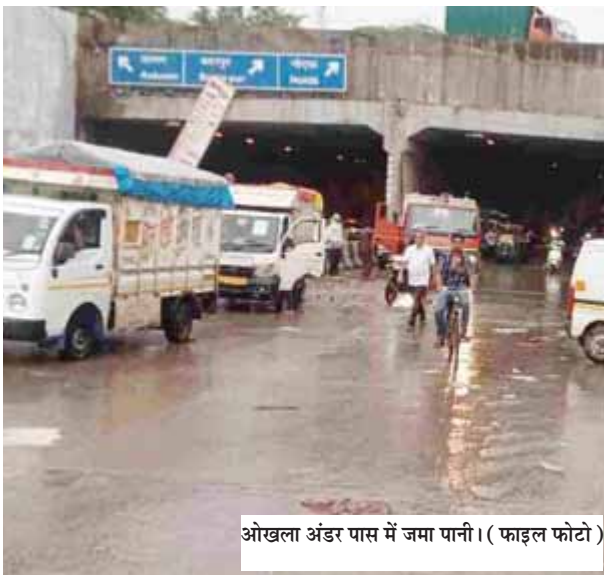
ओखला अंडर पास में जमा पानी। (फाइल फोटो)

भारी बारिश के बाद राजधानी के कई हिस्से में पानी जमा हुआ है। कई घंटों की मशकत के बाद मिंटो ब्रिज अंडरपास, प्रगति मैदान सुरंग समेत शहर के कई अन्य अंडर पास से पानी निकाला गया है और बाद में इसे वाहनों को आवाजाही के लिए खोला दिया है। हालांकि ओखला अंडरपास में अभी पानी जमा है जिसके चलते यातायात पुलिस ने जलभराव के कारण यहां वाहनों के प्रवेश पर रोक लगा दी है। साथ ही लोगों से अपनी यात्रा की योजना बनाते समय इसे ध्यान में रखने की सलाह दी है।