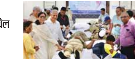
संत निरंकारी सत्संग भवन में रक्तदान करते भक्तजन।

संत निरंकारी मिशन ने निरंकारी सत्संग भवन में रक्तदान शिविर का आयोजन किया। इसमें 238 निरंकारी भक्तों ने रक्तदान किया। सतगुरु माता सुदीक्षा जी महाराज के पावन आशीर्वाद से संत निरंकारी चैरिटेबल फाउण्डेशन (संत निरंकारी मिशन का सामाजिक विभाग) के तत्वावधान में आयोजित इस रक्तदान शिविर का उद्घाटन मुख्य अतिथि के रूप में उपस्थित संत निरंकारी मंडल