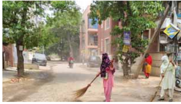
गुरुग्राम नगर निगम क्षेत्र में सफाई करते सफाई कर्मचारी।

ठोस कचरा पर्यावरण आवश्यकता कार्यक्रम (स्वीप) के तहत चल रहे विशेष स्वच्छता अभियान के दौरान कुछ लोगों द्वारा जान-बूझकर व्यवस्था को खराब करने की नीयत से कचरा फैलाया जा