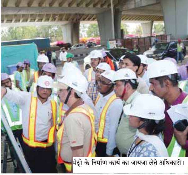
मेट्रो के निर्माण कार्य का जायजा लेते अधिकारी।

● परियोजना पर दिसंबर 2019 में कार्य शुरू हुआ, लेकिन कोरोना महामारी और पेड़ों को काटने की अनुमति मिलने में देरी के कारण 2020 से 2022 तक कार्य प्रभावित हुआ