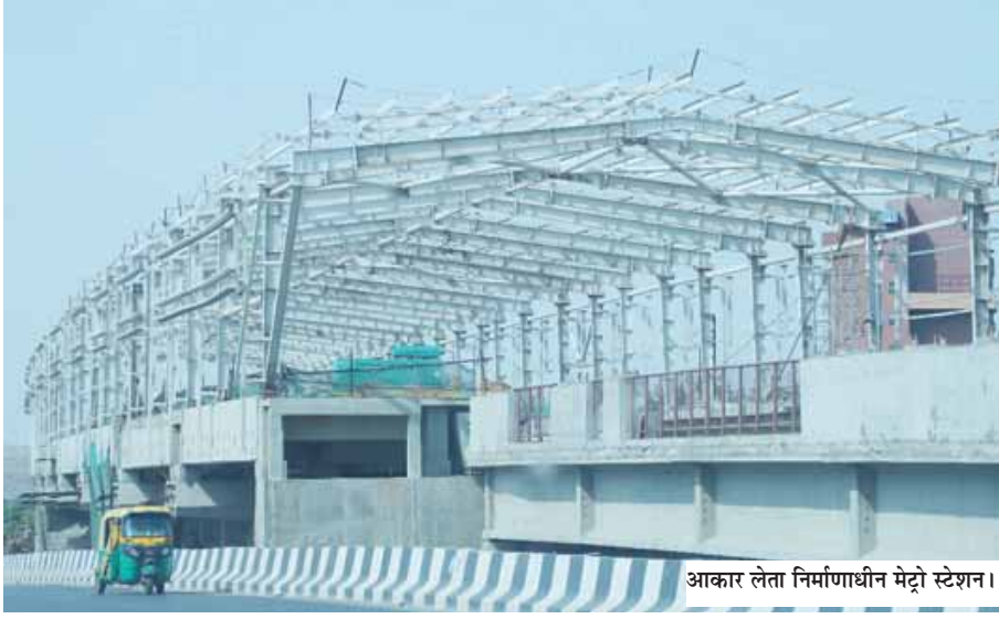
आकार लेता निर्माणाधीन मेट्रो स्टेशन।