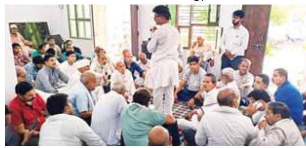
पटौदी के गांव जाटोली मंडी में एमएलए स्कूल को लेकर पंचायत में मौजूद ग्रामीण।

जिस स्कूल में अच्छी शिक्षा लेकर विद्यार्थी अधिकारी बनकर बड़े पदों तक पहुंचे, आज वही स्कूल बंद होने की कगार पर है। सरकार की ओर से स्कूल को सहायता मिलनी बंद हो गई