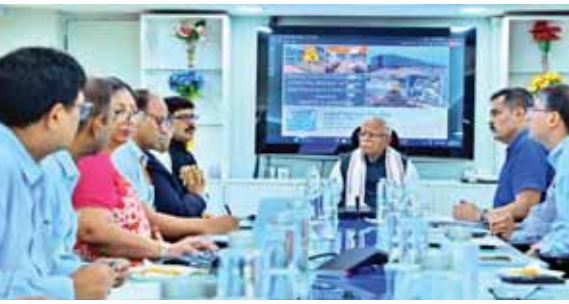
नई दिल्ली में मनोहर लाल की अध्यक्षता में हुई बैठक में भाग लेते हरियाणा के अधिकारी।

केंद्रीय ऊर्जा और आवास एवं शहरी मामलों मंत्री मनोहर लाल के प्रयासों से हरियाणा में जल्द ही कचरे से चारकोल बनाने वाले प्लांट लगेंगे, जिन्हें ग्रीन कोल प्लांट भी कहा जाता है। इस प्लांट के लिए एनटीपीसी विद्युत व्यापार निगम लिमिटेड (एनवीवीएनएल) और हरियाणा सरकार के बीच जल्द ही समझौता ज्ञापन पर हस्ताक्षर किए जाएंगे। पहले चरण में दिल्ली एनसीआर के अंतर्गत आते गुरुग्राम-मानेसर और