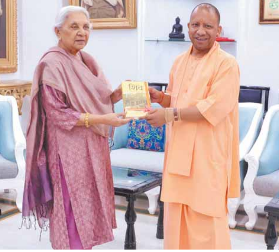
मुद्यमंत्रि योगी आदित्यनाथ ने सोमवार को राजभवन में राज्यपाल आनंदीबेन पटेल से शिष्टाचार भेंट की।

पर्यवेक्षक की ड्यूटी रेंडमली निर्धारित की गई। रैंडमाइजेशन में लोक सभा निर्वाचन के लिए कुल 843 और 173 लखनऊ पूर्व विधानसभा उप निर्वाचन के लिए कुल 107 कार्मिकों की ड्यूटियों को निर्धारित करते हुए ड्यूटी आदेश जारी किया गया। लोकसभा निर्वाचन के लिए जिसमें 175 मतगणना पर्यवेक्षक, 175 मतगणना सहायक, 175 माइक्रो अब्जर्वरों, 175 चतुर्थ श्रेणी कार्मिक, 18 मतगणना संकलन पर्यवेक्षक और 09 मतगणना संकलन सहायक की ड्यूटियों को लॉक किया गया। इसी प्रकार 173 लखनऊ पूर्व विधानसभा उप निर्वाचन हेतु 19 मतगणना पर्यवेक्षक, 19 मतगणना सहायक, 19 माइक्रो