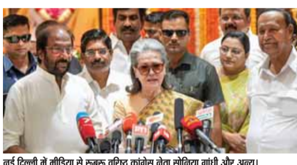
नई दिल्ली में गांधी से एम्बर वरिष्ठ कांग्रेस नेता सोनिया गांधी और अन्य।

उन्होंने यह टिप्पणी द्रमुक कार्यलय में तमिलनाडु के पूर्व मुख्यमंत्री एम कल्यानिधि को उनकी 100वीं जयंती पर श्रद्धांजलि अर्पित करने के बाद की। अधिकतर एगिजट पोल में लोकसभा चुनाव में भारतीय जनता पार्टी के नेतृत्व वाले राष्ट्रीय जनतांत्रिक गठबंधन (राजग) को