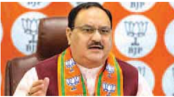
पायनियर समाचार सेवा। नई दिल्ली

बोटों की गिनती से ठीक एक दिन पहले, भाजपा के शीर्ष नेताओं ने लोकसभा चुनावों में पार्टी के प्रदर्शन और 4 जून को होने वाली वोटों की गिनती की तैयारी पर चर्चा करने के लिए सोमवार को पार्टी अध्यक्ष जेपी नड्डा के आवास पर मुलाकात की। भाजपा अध्यक्ष जे पी नड्डा की अध्यक्षता में हुई इस बैठक में एगिजट पोल में भाजपा नीत राष्ट्रीय जनतांत्रिक गठबंधन (राजग) की बड़ी जीत की भविष्यवाणी और विपक्षी इंडिया गठबंधन की ओर से कई बैठकों के बाद इस पूर्वनिर्माण को खारिज करने के बाद मौजूदा राजनीतिक स्थिति का जायजा लिया गया। भाजपा के राष्ट्रीय महासचिव विनोद तावड़े ने बैठक के बाद यहां संवाददाताओं से कहा, सात चरणों में संपन्न चुनावों पर चर्चा और समीक्षा करने के लिए एक बैठक आयोजित की गई थी और कल होने वाली मतगणना पर भी चर्चा की गई। पार्टी के राष्ट्रीय अध्यक्ष जे पी नड्डा ने बैठक की अध्यक्षता की। उन्होंने कहा कि बैठक में मतदान के सभी सात चरणों के दौरान देखे गए मतदान के पैटर्न पर चर्चा की गई। उन्होंने कहा, इसकी भी समीक्षा की गई। तावड़े ने कहा कि बैठक में भाजपा के