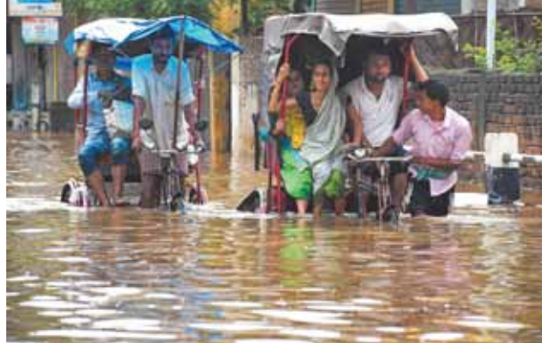
असम की राजधानी गुवाहाटी में भारी बरसात से सड़के जलमग्न हो गयीं

हालिया वर्षों में, भारतीय राजनीति पर कमंडल तत्व बहुत अधिक हावी रहे हैं जहां राजनीतिक दलों ने मंदिर केन्द्रित विमर्श और एजेंडा को लेकर हिंदू मतदाताओं को लुभाया, विशेष रूप से ऐसे क्षेत्रों में जहां धार्मिक प्रतीकवाद काफी मायने रखता है।