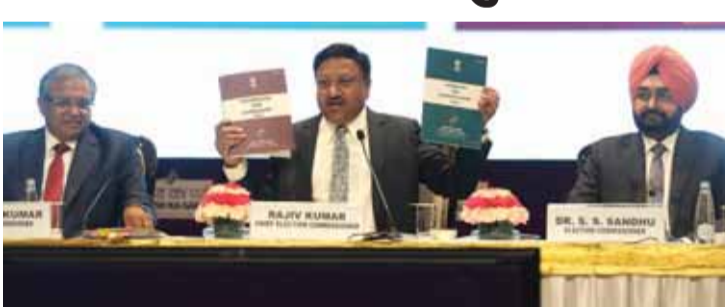
नई दिल्ली में प्रेस कांग्रेस के दौरान मुख्य चुनाव आयुक्त राजीव कुमार।

लोकसभा चुनाव 2024 की मतगणना से ठीक एक दिन पहले मुख्य निर्वाचन आयुक्त (सीईसी) राजीव कुमार ने 'शरारतपूर्ण कहानियों' पर कड़ा प्रहार किया जो चुनाव के दौरान निर्वाचन प्रक्रिया को नुकसान पहुंचा सकती थी। वे ईसी पर लगाए गए आरोपों और आलोचनाओं से जुड़े एक सवाल का जवाब दे रहे थे। इन आरोपों में मत प्रतिशत के ऐलान में देरी, फॉर्म 17सी डेटा के प्रकटीकरण तथा ईवीएम की पवित्रता को लेकर सवाल शामिल थे। सबसे पहले, चुनाव आयोग ने वोटों की गिनती से ठीक एक दिन पहले सोमवार को एक प्रेस कॉन्फ्रेंस की और दावा किया कि भारत ने इस साल लोकसभा चुनाव में 31.2 करोड़ महिलाओं सहित 64.2 करोड़ मतदाताओं के भाग लेकर (शेष पेज 9)