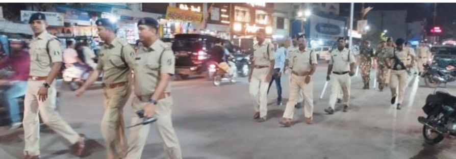
पायनियर संवाददाता राजनांदगांव www.dailypioneer.com

महीने भर में दर्जनों चोरी, पुलिस के पास एक सुराग तक नहीं, पाँश कालोनियों के मकानों को बना रहे निशाना, सीसी कैमरों की फुटेज के बाद भी आरोपी पकड़ से बाहर