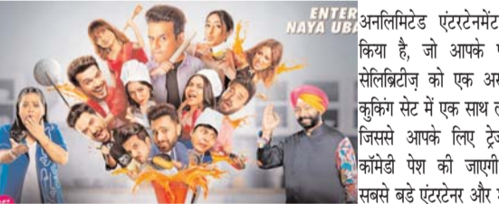
पायनियर संवाददाता < रायपुर www.dailypioneer.com

रविवार को रात 9:30 बजे प्रसारित होगा, केवल कलर्स पर 9 राष्ट्रीय मई 30: लीजिए मोरॉजिन का स्वाद, डिनर के साथ हर किसी की मोरॉजिन की भूख मिटाने के लिए मेज तैयार हो गई है! कलर्स ने एक अनूठा मोरॉजिन शो 'लापर शोस