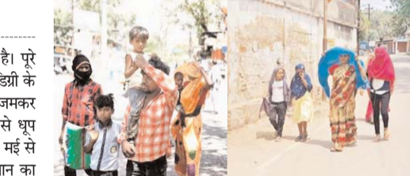
पायनियर संवाददाता < धमतरी www.dailypioneer.com

अंचल में 25 मई से नौतपा शुरू हुई है। पूरे आठ दिन तापमान का पारा 38 से 40 डिग्री के बीच रहा लेकिन अंतिम दिन लोगों को जमकर तपाया। वहीं दिनभर बादल छाये रहने से धूप छांव की स्थिति बनी रही। अंचल में 25 मई से नौतपा शुरू हुई जो पूरे आठ दिन तापमान का पारा 38 से 40 डिग्री के बीच रहा। लेकिन अंतिम दिन लोगों को जमकर तपाया। वहीं दिनभर बादल छाये रहने से धूप छांव की स्थिति बनी रही। तापमान का पारा दो डिग्री बढ़ने के साथ 42 डिग्री हो गया। लोग सुबह से दोपहर तक तेज धूप से तपते रहे। वहीं भारी उमस ने लोगों को बेचैन किया। आज से पंचक की शुरुआत हो रही है, जिसमें तापमान और बढ़ने की आशंका है। दो जून नौतपा का अंतिम दिन