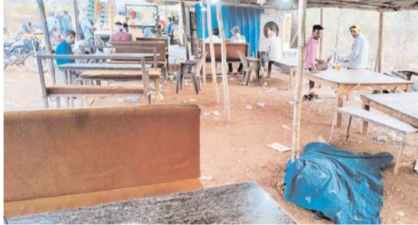
पायनियर संवाददाता < तिलदा-नेवरा www.dailypioneer.com

रायपुर जिला तिलदा-नेवरा थाना क्षेत्र में संचालित अलग-अलग शराब दुकान कैपस में दो युवकों की मौत हो गई है। मौत की वजह की अधिकारिक पुष्टि नहीं हो पायी है, लेकिन मौत की वजह बढ़ती गमी के ग्राफ को माना जा रहा है। बता दें कि तिलदा-नेवरा थाना क्षेत्र में संचालित शराब दुकानों के कैपस में एक ही दिन में अलग-अलग दुकान के समीप दो युवक की मौत हो जाने की खबर सामने आयी है। तिलदा-नेवरा के सरोरा मार्ग में संचालित शराबीय शराब दुकान के चखना सेंटर कैपस में जहां एक व्यक्ति की मौत हुई है। जिनकी उम्र लगभग 38 वर्ष आंकी जा रही है, मृतक का शिनाख्तागी बहरहाल नहीं हो पाया है, वहीं बैकटु कर्पाकिट शराब दुकान के समीप भी एक व्यक्ति की मौत