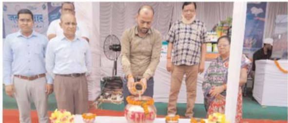
पायनियर संवाददाता < रायपुर www.dailypioneer.com

9 आपके पसंदीदा सैलिब्रिटीज को एक असाधारण किचन सेट-अप में लाते हुए, राजधानी बेसन द्वारा प्रायोजित, विशेष भागीदार विम लिंकडि, एसीएमएट प्रायोजक जेके टायर्स, 'लापर शोस अनालिमिटेड एंटरटेनमेंट' का प्रीमियर 1 जून को होगा और हर शनिवार और