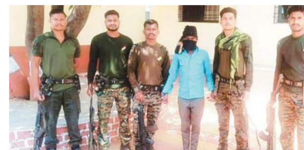
पायनियर संवाददाता राजनांदगांव www.dailypioneer.com

महाराष्ट्र की गढ़चिरोली पुलिस ने नक्सल मोर्चे में कार्यवाही करते हुए डेढ़ लाख के एक ईनामी नक्सली को गिरफ्तार किया है। पुलिस की गिरफ्त में आए नक्सली मूलतः छत्तीसगढ़ के नारायणपुर जिले का रहने वाला है। उस पर गढ़चिरोली जिले में कई अपराधिक मामलों में शामिल होने का आरोप है, वहीं कई थानों में उनके विरुद्ध नामजद आपराधिक प्रकरण दर्ज हैं। पुलिस को लंबे समय से