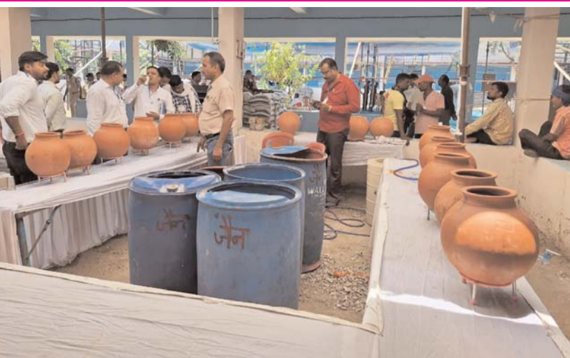
पायनियर संवाददाता < बिलासपुर www.dailypioneer.com

मतगणना स्थल में तीन लेयरों में होगी सुरक्षा व्यवस्था, चौक चौराहों में एलईडी से होगा परिणाम का प्रसारण