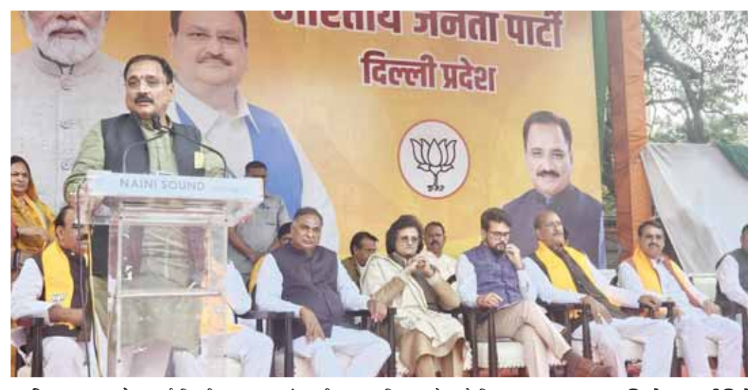
पायनियर समाचार सेवा। नई दिल्ली

नागरिकता संशोधन अधिनियम के मुद्दे पर भाजपा ने मुख्यमंत्री अरविंद केजरीवाल पर पटलवार किया है। दिल्ली भाजपा अध्यक्ष वीरेंद्र सचदेवा ने कहा कि केजरीवाल सीएए पर असुदुदीन ओवेसी, ममता बनर्जी एवं राहुल गांधी की भाषा बोल रहे हैं। हिंदू, सिख, बौद्ध, ईसाई शरणार्थियों के सम्मान को ठेस पहुंचाने के साथ ही देश के मुस्लिमों को डराने व भड़काने की कोशिश कर रहे हैं। उन्होंने यह साबित कर दिया कि वह हिंदू, सिख, बौद्ध विरोधी हैं। प्रदेश भाजपा अध्यक्ष बुधवार को आज्ञापद पर एवं