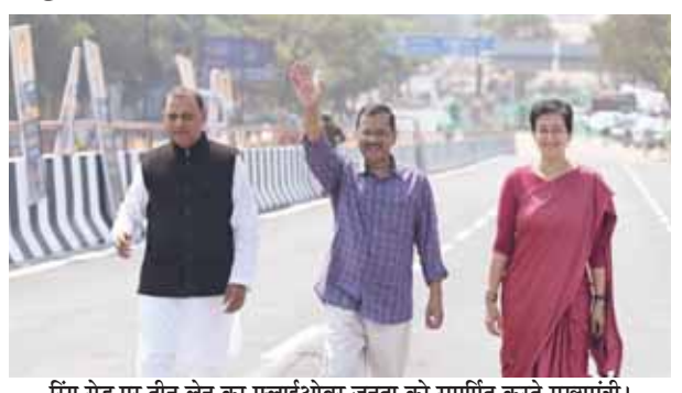
रिंग रोड पर तीन लेन का फ्लाईओवर जनता को समर्पित करते मुख्यमंत्री।

मुख्यमंत्री अरविंद केजरीवाल ने मोती नगर रिंग रोड पर बना तीन लेन का फ्लाईओवर जनता को समर्पित कर दिया। इस फ्लाईओवर से धौलाकुंआ से आजादपुर और रोहताक आने-जाने वाले लोगों को बहुत फायदा मिलेगा। सीएम ने कहा कि इस रोड पर ट्रैफिक जाम के चलते आधा किलोमीटर का यह सफर तय करने में आधा घंटा लग जाता था, लेकिन अब केवल तीन मिनट में तय होगा। यह एक बड़े प्रोजेक्ट का हिस्सा है। इसके