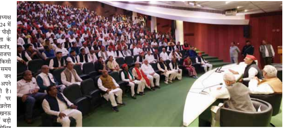
यादव ने कहा कि समाजवादी पार्टी के सभी नेता, कार्यकर्ता वधुस्तर पर पार्टी संगठन को मजबूत कर पीडीए का संदेश जन-जन तक पहुंचाए। समाजवादी सरकार की उपलब्धियां लोगों को बताएं और समाजवादी पार्टी-गठबंधन के प्रत्याशियों को बहुमत से जिताने में कोई कोरकसर न छोड़ें। अखिलेश यादव

समाजवादी पार्टी के राष्ट्रीय अध्यक्ष अखिलेश यादव ने कहा है कि सन् 2024 में होने वाला लोकसभा चुनाव आने वाली पीढ़ी के भविष्य का चुनाव है। यह जनता के जीवन-मरण का चुनाव होगा। लोकतंत्र, संविधान, आरक्षण सब पर खतरा है। भाजपा सन् 2024 का चुनाव जीतने के लिए किसी भी स्तर तक जा सकती है। मतदान के समय धांधली की तैयारियां हैं। ऐसे में जन सामान्य, जो मतदाता भी हैं, उसे ही अपने अधिकार और वोट की रक्षा करनी है। समाजवादी पार्टी के कार्यकर्ताओं पर लोकतंत्र बचाने की ज़िम्मेदारी है। अखिलेश यादव बुधवार को प्रदेश मुख्यालय लखनऊ में डॉ. राममोहन लोहिया सभागार में बड़ी संख्या में आए कार्यकर्ताओं को सम्बोधित कर रहे थे। उन्होंने कहा कि भाजपा सरकार में पूरी निवेश धरातल पर उतर चुका है। वहीं लूट मची है। उसका रास्ता खतरनाक है। भाजपा सरकार हर स्तर पर विफल है। अपनी नाकामी को छुपाने के लिए झूठे वादे विज्ञापनों में दर्शाए जा रहे हैं। अखिलेश