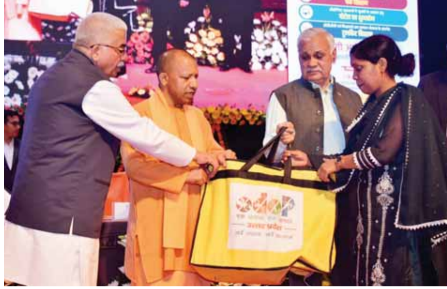
उनका भविष्य उज्वल है। मुख्यमंत्री बुधवार को लोकभवन सभागार में आयोजित कार्यक्रम के संबोधित कर रहे थे। इस दौरान उन्होंने एमएसएमई क्षेत्र के लिए 30,826 करोड़ का मेगा ऋण वितरण किया, साथ ही उन्नाव

सीएम योगी ने एमएसएमई क्षेत्र के लिए 30,826 करोड़ का मेगा ऋण वितरण किया