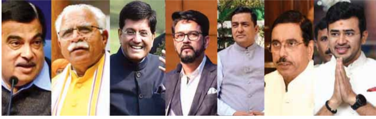
बाएं से दाएं: नितिन गडकरी, मनोहर लाल खट्टर, पीयूष गोयल, अनुराग ठाकुर, अनिल बलूनी, प्रहलाद जोशी और तेजस्वी सुर्वा।

वहीं 2024 के लोकसभा चुनाव के लिए उम्मीदवारों की पहली सूची में उनका नाम नहीं होने के कारण थोड़ी अनिश्चितता होने के बाद भी गडकरी ने अपनी नागपुर सीट बरकरार रखी है। गडकरी ने 2014 और 2019 के लोकसभा चुनावों में लगातार सीट जीती थी। भाजपा की दूसरी सूची घोषित होने से एक दिन पहले, शिवसेना (यूबीटी) प्रमुख उद्धव ठाकरे ने नितिन गडकरी से कहा कि अगर उनका अपमान किया जा रहा है तो वे भाजपा छोड़ दें। ठाकरे ने कहा कि महान विकास अखाड़ी लोकसभा चुनाव में गडकरी की जीत सुनिश्चित करेगी। गडकरी ने जवाब देते हुए कहा कि उद्धव ठाकरे का