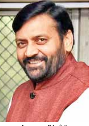
सीएम नायब सिंह सैनी।