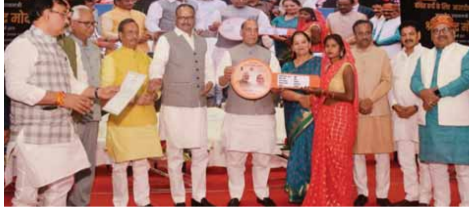
संस्कार ने गरीब, किसान, जवान, महिलाओं के लिए काम किया है। आज शायद ही ऐसा कोई मिले, जो झुग्गी-झोपड़ी में रहता हो। मुझे याद है कि जब हम जनसंघ और भाजपा में काम करते थे तो पूर्व मुख्यमंत्री कल्याण सिंह कहते थे कि गांव, गरीब और किसान झुग्गी-झोपड़ी का ईंसान लेकिन आज मैं देखता हूँ कि

किसान, जवान, महिलाओं के लिए किया काम: रक्षामंत्री