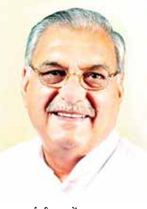
पूर्व सीएम भूपेंद्र हुड्डा,