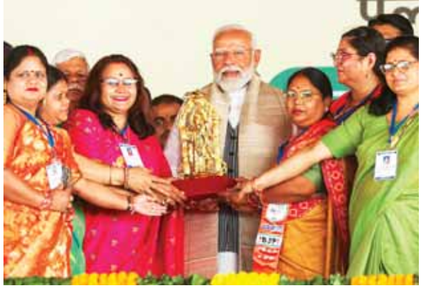
पलाऊ में एक जनसभा के दौरान प्रधानमंत्री नरेंद्र मोदी का सम्मान किया गया।

प्रधानमंत्री नरेंद्र मोदी द्वारा कांग्रेस नेता राहुल गांधी को शहजादा (राजकुमार) कहकर लगातार किया जा रहा तंज शनिवार को उस समय एक नया मोड़ लिया जब राहुल की बहन और सबसे पुरानी पार्टी की महासचिव प्रियंका गांधी ने पीएम को शहशाह (सम्राट) कहकर बुलाया। बिहार और झारखंड में लोकसभा चुनाव रैलियों में, राहुल गांधी के साथ मोदी ने राजद नेता पूर्व उपमुख्यमंत्री तेजस्वी यादव के लिए भी शहजादा शब्द का भी इस्तेमाल किया। मोदी ने अपने संबोधन के दौरान तंज करते हुए कहा था कि एक शहजादा दिल्ली में (राहुल) और एक पटना में (तेजस्वी) हैं, दोनों देश को अपनी जागीर समझते हैं। वहीं गुजरात में एक रैली को संबोधित करते हुए प्रियंका ने मोदी को शहशाह कहा जो महल में रहता है लेकिन जनता से कटा हुआ है। यह उनके भाई राहुल गांधी के लिए पीएम के शहजादा तंज पर उनकी पहली प्रतिक्रिया थी।