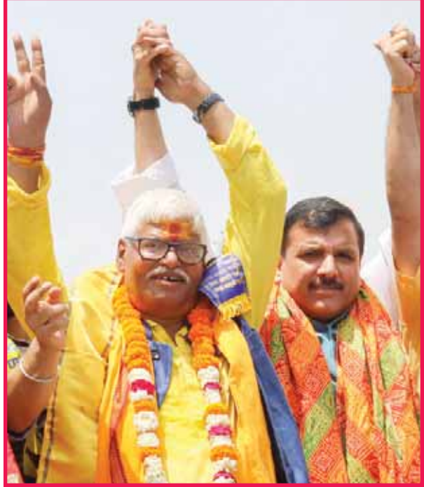
आम आदमी पार्टी से महाबल मिश्रा व साथ में राज्यसभा सांसद संजय सिंह।

गया, जिसमें बड़ी संख्या में समर्थकों ने हिस्सा लिया। इस दौरान राज्यसभा सांसद संजय सिंह और कैबिनेट मंत्री