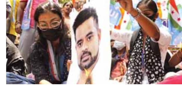
महिला के अपहरण के आरोप में बृहस्पतिवार रात मैसूरु में मामला दर्ज किया गया था। मामला महिला के बेटे की शिकायत पर दर्ज किया गया था, जिसने यह भी आरोप लगाया था कि रेवन्ना के बेटे और हासन लोकसभा