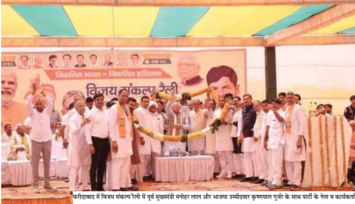
फरीदाबाद में विजय संकल्प रैली में पूर्व मुख्यमंत्री मनोहर लाल और भाजपा उम्मीदवार कृष्णपाल गुर्जर के साथ पार्टी के नेता व कार्यकर्ता।

भाषण के दौरान कांग्रेस पर हमलावाब रहे मनोहर लाल ने कहा कि इस बार लोकसभा का चुनाव देश प्रेम की भावना और देश विरोधी भावना के बीच युद्ध है। देश विरोधी लोग तरह तमाम तरह के हथकंडे अपनाते हैं। अफवाह के साथ ये लोग पैसे पर भी लोगों को खरीदने की कोशिश कर रहे हैं। शख बताने का काम करेंगे। लेकिन जिसका जमीर है वह नहीं बिकेगा। उन्होंने विपक्ष को असैद्धांतिक मूल्यों पर राजनीति करने वाला कारन दिया। कहा कि हम सिद्धांतों की राजनीति पर चलते हुए राज्य में बिना पर्ची बिना खर्ची नौकरी दिया था। जबकि कांग्रेस के ही लोकसभा प्रत्याशी ने स्वीकार किया है कि उनके राज में पर्ची के