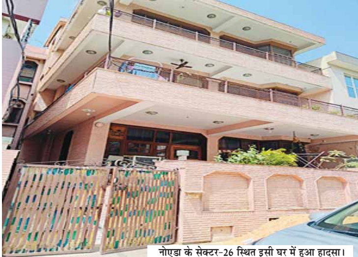
नोएडा के सेक्टर-26 स्थित इसी घर में हुआ हादसा।