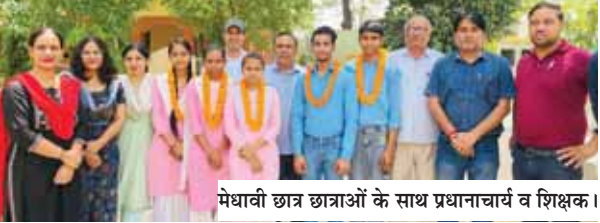
मेधावी छात्र छात्राओं के साथ प्रधानाचार्य व शिक्षक।