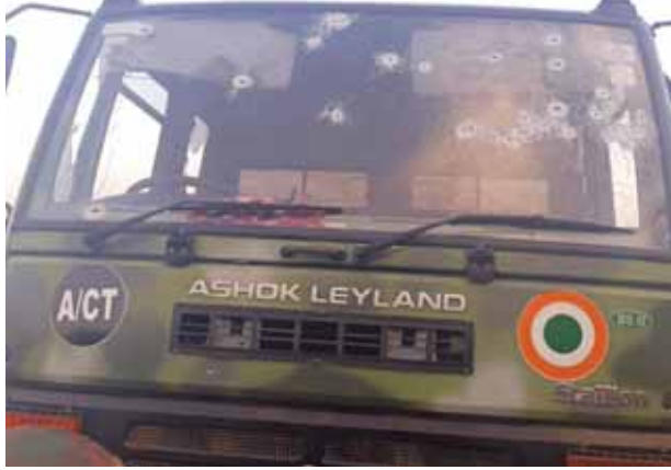
वायुसेना के वाहन पर आतंकवादियों द्वारा की गई गोलीबारी के निशान। दूसरी ओर हमले के बाद पुंछ वाहनों की तलाशी लेते सुरक्षाबल के जवान

विदेशी आतंकवादियों के भारी हथियारों से लैस समूह ने शनिवार शाम पुंछ में मंडर तहसील के दाना शास्त्री इलाके में भारतीय वायु सेना के एक काफिले को निशाना बनाया। इस दौरान गोलीबारी में एक सैनिक शहीद हो गया, जबकि चार अन्य घायल हो गए। आतंकवादियों की गोलीबारी के जवाब में वायु सेना के जांबाजों ने भी फायरिंग की। इस दौरान पांच जवान जखमी हो गए और उन्हें तत्काल चिकित्सा के लिए निकटतम सैन्य अस्पताल ले जाया गया जहां एक सैनिक की मौत हो गई। लोकसभा चुनाव प्रचार के बीच इलाके में दहशत पैदा करने के लिए एक से कम तीन से चार सदस्यों वाले एक आतंकवादी समूह ने भारतीय वायुसेना के काफिले पर घात लगाकर हमला किया। अनंतनाग-राजौरी लोकसभा सीट पर पांचवें दौर में 25 मई को मतदान होगा। भारतीय वायुसेना के बयान में कहा गया है कि स्थानीय सैन्य