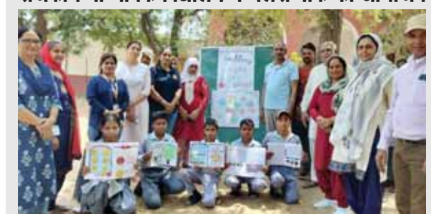
राजकीय माध्यमिक विद्यालय में बच्चों को सम्मानित करते अतिथि।

राजकीय माध्यमिक विद्यालय में गैलरी वॉक का आयोजन