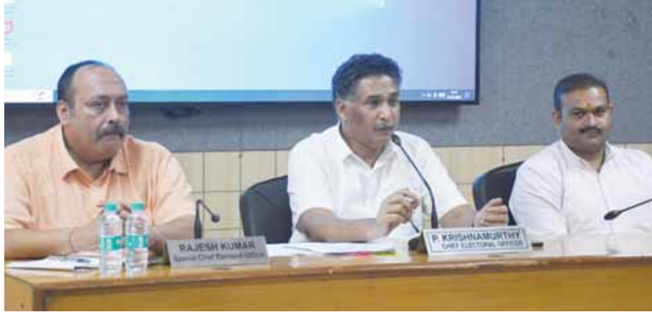
मुख्य निर्वाचन अधिकारी पी. कृष्णामूर्ति ने मीडिया के सवालों का जवाब देते हुए।

राष्ट्रीय राजधानी में पहली बार के युवा मतदाताओं, ट्रांसजेंडर और लिंग अनुपात में उसाहजनक वृद्धि हुई है। चुनाव आयोग को भरोसा है कि दिल्ली में युवा मतदाता अहम भूमिका निभाएंगे। मुख्य निर्वाचन अधिकारी पी. कृष्णामूर्ति ने मंगलवार को संवाददाता सम्मेलन में कहा कि