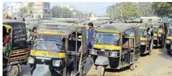
गुरुग्राम में बस अड्डे के पास खड़े ऑटो।

बता दें कि परिवहन आयुक्त हरियाणा की ओर से प्रदेश के सभी ऑटो चालकों के लिए एक ड्रेस कोड लागू किया गया है। इसमें चालकों को ग्रे कलर की वर्दी पहननी जरूरी है और अपनी पहचान के लिए बैज का