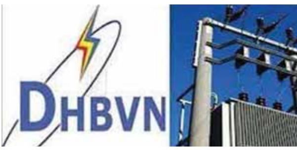
गुरुग्राम में बिजली कटौती के कारण बिजली विभाग से शिकायतें आ रही हैं।

सोमवार को भी कई घंटे तक बिजली बाधित रही। यही हाल मंगलवार दोपहर से शुरू हो गया। सिविल लाईंस क्षेत्र में अधिकांश समाचार पत्रों के कार्यालय हैं। बिजली की अघोषित कटौती से समाचार पत्रों के कार्यालयों में काम बाधित हुआ। शहर के पॉश क्षेत्र सिविल लाईंस, न्यू फ्रेंड्स कालोनी व सदर बाजार सहित आस-पास के