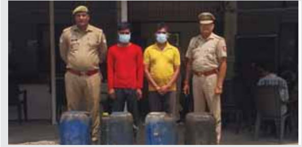
थाना सेक्टर-113 नोएडा पुलिस ने कंपनी से कुकिंग ऑयल चोरी करने वाले दो कर्मचारियों को किया गिरफ्तार।