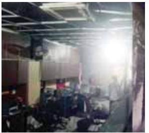
आग से जला सामान।

सिविल लाइन स्थित एससीओ-58 में पांचवीं मंजिल पर एसआरएस लॉजिकेयर में रात 12 बजे आग लगने की घटना से आसपास के क्षेत्रों में भी दहशत फैल गई। आग लगने का कारण शॉर्ट सर्किट माना जा रहा है। आग से बिल्डिंग के शीशे टूट गए और लफटें बाहर तक निकलती रहीं। सूचना पाकर दमकल विभाग की टीमें मौके पर पहुंची। इमारत ऊंची होने के चलते यहां आग बुझाने के लिए बाहर की तरफ से पानी की बौछारें मारना