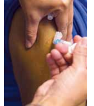
की जांच के लिए एक विशेषज्ञ पैनल की मांग और सरकार द्वारा दवा लेने के बाद मरने वालों के परिवारों को मुआवजा प्रदान करने की मांग शामिल है। हालांकि, याचिका की जल्द सुनवाई से इनकार कर दिया गया है। रिपोर्टों के अनुसार, एसआईआई के पास पुणे सुविधा में कोविशील्ड की 250 मिलियन युएफए का स्टॉक है, जिसका उपयोग भविष्य में किसी भी स्थिति के लिए किया जा सकता है। एसआईआई के सूत्रों ने 2022 में कोविशील्ड के उत्पादन को आधा करने की योजना का संकेत दिया था क्योंकि इसकी सुविधा में 500 मिलियन डोज का स्टॉक था। इनमें से आधे तैयार डोज थे, जबकि शेष थोक डोज थे जिन्हें फॉर्मूलेशन में परिवर्तित नहीं किया गया था। इस बीच, यूरोपीय संघ (ईयू) के लिए दवा नियामक, यूरोपीय चिकित्सा एजेंसी ने मंगलवार को एक नोटिस जारी कर पुष्टि की कि वैक्सजेवोरिया - जिसे भारत में कोविशील्ड के रूप में जाना जाता है - अब 27 सदस्यीय आर्थिक ब्लॉक में उपयोग के लिए अधिकृत नहीं है, क्योंकि एस्ट्राजेनेका (एजेड) ने मार्च में स्वेच्छा से अपनी आर्थरिटी वापस ले लिया था। इसलिए एस्ट्राजेनेका ने यूरोप के भीतर वैक्सजेवोरिया के लिए विपणन न्यायालय के संज्ञान में आई है, जिसने दो दिन पहले टीके से जुड़े एक दुर्लभ दुष्प्रभाव पर एक याचिका पर सुनवाई करने पर सहमति व्यक्त की थी। सुनवाई की तारीख तय नहीं की गई है, लेकिन सर्वोच्च न्यायालय के मुख्य न्यायाधीश डीवाई चंद्रचूड़ ने इस मुद्दे को स्वीकार किया, जिसमें दुष्प्रभावों

ब्रिटेन की एक अदालत में कोविड-19 वैक्सिन में श्रोम्वॉसिस विद श्रोम्वोसाइटोपेनिया सिंड्रोम (टीटीएस) नामक एक संभावित दुर्लभ रक्त के थक्के का दुष्प्रभाव होने की स्वीकारोक्ति के महीनों बाद भारत में कोविड वैक्सिन के नाम से बेची जा रही ऑक्सफोर्ड यूनिवर्सिटी के सहयोग से बनाए गए अपनी कोविड वैक्सिन को फार्मा दिग्गज एस्ट्राजेनेका ने वापस मंगा लिया है। ब्रिटेन-स्वीडिश बहुराष्ट्रीय दवा कंपनी को 50 से अधिक कथित पीडितों और उनके परिवारों के मुकदमों का सामना करना पड़ रहा है, जो कोविड महामारी के दौरान टीकाकरण के बाद मृत्यु या मृतक आघात का दावा करते हैं। कंपनी की कोविड-19 वैक्सिन यूरोप में वैक्सजेवोरिया के नाम से बेची जा रही है। एस्ट्राजेनेका ने इस साल फरवरी में अदालत में स्वीकार किया था कि उसकी कोविड-19 वैक्सिन बहुत ही दुर्लभ मामलों में श्रोम्वॉसिस विद श्रोम्वोसाइटोपेनिया सिंड्रोम (टीटीएस) का कारण बन सकती है, एक ऐसी स्थिति जिसमें रक्त के थक्के बनते हैं और प्लेटलेट की मात्रा घट जाती है।