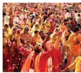
के बीच 2.24 प्रतिशत से बढ़कर 2.36 प्रतिशत होकर 5.38 प्रतिशत की बढ़ोतरी हुई है। अध्ययन के अनुसार सिख आबादी का

बताया गया है कि भारत में 1950 से 2015 के बीच बहुसंख्यक हिंदू आबादी 7.82 प्रतिशत (84.68 प्रतिशत से 78.06 प्रतिशत) कम हुआ है। भारत की आबादी में हिंदुओं का हिस्सा 1950 में 84 प्रतिशत से घटकर 2015 में 78 प्रतिशत हो गया, जबकि इसी अवधि (65 वर्षों की) में मुसलमानों का हिस्सा 9.84 प्रतिशत से बढ़कर 14.09 प्रतिशत हो गया। 1950 में मुस्लिम आबादी का हिस्सा 9.84 प्रतिशत था और 2015 में बढ़कर 14.09 प्रतिशत हो गया, जो उनकी आबादी में 43.15 प्रतिशत की वृद्धि हुई। ईसाई आबादी का हिस्सा 1950 और 2015