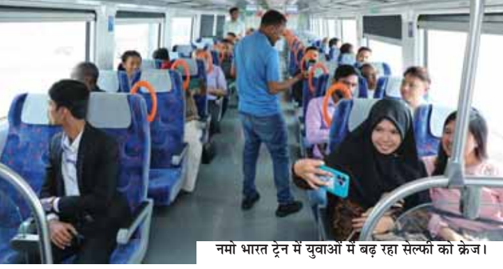
नमो भारत ट्रेन में युवाओं में बहुर रह सैल्फों को केज।