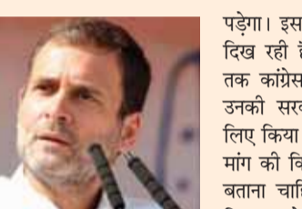
लोकसभा चुनाव प्रचार के दौरान बुधवार को पहली बार उन्होंने पूर्व कांग्रेस अध्यक्ष राहुल का नाम लिए बगैर दाल में कुछ काला होने की आशंका जताई कि कोई न कोई चोरी का माल टैपो भर-भर के आपने पाया है और उन्हें देश को इसका जवाब देना शुरू किया। (शेष पेज 9)

पायनियर समाचार सेवा। नई दिल्ली/हैदराबाद लोकसभा चुनावों में तीसरे चरण में ही कम मतदान के रूढ़ानु को देखते हुए प्रधानमंत्री नरेंद्र मोदी ने कांग्रेस की अगुवाई वाले विपक्ष पर तीखा हमला किया। उन्होंने दावा किया कि विपक्ष के चुनाव अभियान को कोल धन द्वारा वित्त पोषित किया गया था। प्रधानमंत्री ने इंडिया गुट के नेता राहुल गांधी से सवाल किया अडानी और अंबानी जैसे उद्योगपतियों की आलोचना करना क्यों बंद कर दिया है। पीएम ने