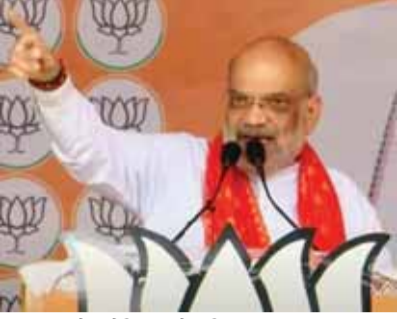
जनसभा को संबोधित करते अमित शाह।

कन्नौज। केंद्रीय गृहमंत्री अमित शाह ने समाजवादी पार्टी के अध्यक्ष और यूपी के पूर्व सीएम अखिलेश यादव पर जमकर हमला बोला है। अमित शाह ने कहा कि ये परिवारवादी लोग हैं, इन्हें अपने परिवार के अलावा दूसरा कोई नहीं दिखता। अमित शाह ने कहा कि यादव समाज अखिलेश यादव से खप है। उन्होंने कहा कि कन्नौज में सुब्रत पाठक की जीत तय है। यहाँ की जनता एक बार फिर परिवारवादियों को सबक सिखाने को तैयार है।