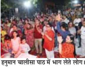
हनुमान चालीसा पाठ में भाग लेते लोग।