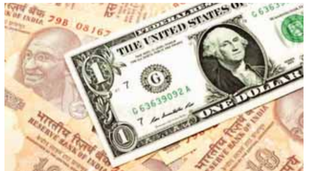
रिपोर्ट में कहा गया है कि भारत-संयुक्त अरब अमीरात, भारत-अमेरिका, भारत-सऊदी अरब और बांग्लादेश-भारत शीर्ष 10 अंतराष्ट्रीय देश-से-देश प्रवास गलियारों में शामिल थे। मैक्सिको का भारत के बाद दुनिया में अंतरराष्ट्रीय प्रेषण का दूसरा सबसे बड़ा प्राप्तकर्ता है। चीन लंबे समय से दूसरे स्थान पर था,

हस्तांतरण से है। रिपोर्ट में कहा गया है, भारत बाकी देशों में सबसे ऊपर रहा और उसे 111 अरब डॉलर से अधिक धन प्राप्त मिला, जिसके साथ ही वह 100 अरब डॉलर तक पहुंचने और बल्कि इस आंकड़े को पार करने वाला पहला देश बन गया है। मैक्सिको में दूसरा सबसे ज्यादा प्रेषित धन प्राप्त करने वाला देश रहा। यह स्थान उसने 2021 में चीन को पीछे छोड़कर हासिल किया था। इससे पहले तक चीन भारत के बाद ऐतिहासिक रूप से प्रेषित धन प्राप्त करने वाला दूसरा सबसे बड़ा देश रहा है। रिपोर्ट के आंकड़ों के अनुसार, भारत 2010 (53.48 अरब डॉलर), 2015 (68.91 अरब डॉलर) और 2020 (83.15 अरब डॉलर) में भी