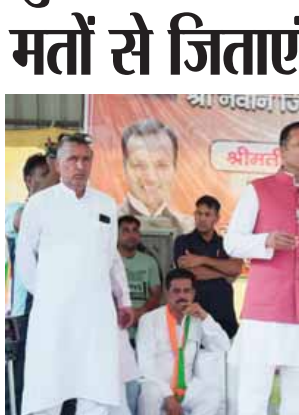
कैथल में जनसभा को संबोधित करते भाजपा प्रत्याशी नवीन जिंदल।

कुरुक्षेत्र से भाजपा प्रत्याशी नवीन जिंदल ने बुधवार को अपने कलायत दौर की शुरुआत ट्रेक्टर से चंदना गांधी पहुंचकर की। उन्होंने तिरम में शहीद भगत सिंह की प्रतिमा पर माल्यांजन कर उन्हें नम किया। जिंदल ने इस अवसर पर युवाओं को प्रोत्साहित किया कि वे स्वस्थ रहकर अपनी ऊर्जा सकारात्मक कार्यों में लगाएं। उन्होंने हरियाणवी में भाषण देकर लोगों को एहसास दिलाया कि वे उनके बेटे-भ्राई की तरह सदैव सेवा समर्पित हैं। जोरदार स्वागत के बीच कार्यक्रमियों को अपने देसी अंदाज़ में संबोधित करते हुए नवीन जिंदल ने कहा कि वे बाऊजी औ पी जिंदल की प्रेरणा से अपने देश और देवासियों की सेवा में सदैव समर्पित रहेंगे। जिंदल ने कहा कि वे अनजनी नहीं हैं और 10 साल सांसद के रूप में क्षेत्रवासियों की सेवा की है। घर-घर शौचालय, बेटियों-बहनों के लिए शगुन, बुजुर्गों के लिए मेडिकल कैम्प, आयां के इलाज के कैंप आदि के माध्यम से उन्होंने पूरी सूझबूझ से सेवा करने का प्रयास किया।