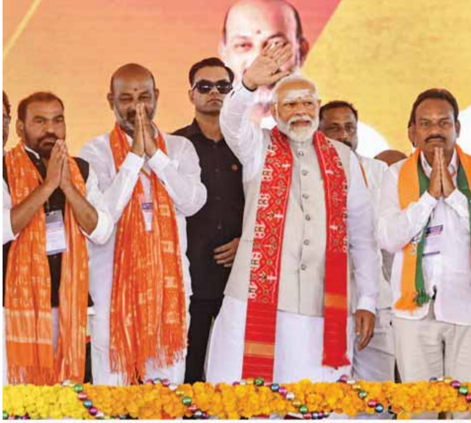
तेलंगाना के करीमनगर में प्रधानमंत्री नरेन्द्र मोदी लोगों का अभिवादन करते हुए।

नई दिल्ली। वित्त मंत्री निर्मला सीतारमण ने बुधवार को कहा कि कांग्रेस नीत संयुक्त प्रगतिशील गठबंधन (संप्रग) सरकार के दौरान सार्वजनिक उपक्रमों को नुकसान उठाना पड़ा था। उन्होंने कहा कि पहले उपेक्षित रहे हिंदुस्तान एयरोनाटिक्स लिमिटेड (एचएएल) जैसे उपक्रमों का प्रधानमंत्री नरेंद्र मोदी नीत सरकार के दौरान पुनरुत्थान हुआ। कांग्रेस पार्टी तथा उसके नेता राहुल गांधी के सार्वजनिक क्षेत्र की कंपनियों के पेशानी झेलने के आरोपों का खंडन करते हुए सीतारमण ने कहा कि यह उल्टा चोर कोतवाल को डांट जैसा है। मंत्री ने सोशल मीडिया मंच एक्स पर लिखा, सार्वजनिक क्षेत्र के उपक्रम (पीएसयू) फल-फूल रहे हैं, तथा उन्हें बढ़ी हुई परिचालन स्वतंत्रता के साथ-साथ उनमें पेशेवर संस्कृति का संचार हुआ है। कांग्रेस नीत संप्रग सरकार के दौरान सार्वजनिक क्षेत्र के उपक्रमों को नुकसान उठाना पड़ा।