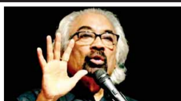
अमेरिका में रहने वाले 'दार्शनिक और शहजादा (राहुल गांधी) के चाचा' की भारतीयों पर नस्लीय वर्गीकरण करने से बहुत नाराज हैं, उन्होंने द्रौपदी मुर्मू की

कांग्रेस नेता सैम पित्रोदा ने एक बार फिर अपनी भारत की विविधता पर टिप्पणी करके सत्तारूढ़ भाजपा को हमला करने के लिए पर्याप्त मसाला दे दिया है, भाजपा ने उनकी टिप्पणी को 'नस्लवादी' बताया है। प्रधानमंत्री नरेंद्र मोदी ने पित्रोदा की टिप्पणियों पर हमला करते हुए देश की सबसे पुरानी पार्टी पर निशाना साधा और कहा कि जनता उनकी त्वचा के रंग के आधार पर उनका अपमान करने के प्रयास को बर्दाश नहीं करेगी। तेलंगाना में अपनी रैलियों में मोदी ने कहा कि आज वह