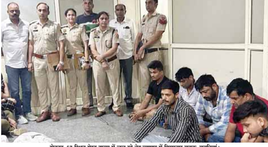
सेक्टर-57 स्थित गेस्ट हाउस में चल रहे देह व्यापार में गिरफ्तार युवक-युवतियां।

एक गेस्ट हाउस में चलाए जा रहे देह व्यापार का पुलिस ने बुधवार को भंडाफोड़ किया है। पुलिस ने मौके से 6 युवतियों, 4 युवकों व गेस्ट हाउस के दो संचालकों को गिरफ्तार किया है। दो व्यक्ति गेस्ट हाउस संचालक हैं। सेक्टर-56 पुलिस ने सभी के खिलाफ एफआईआर दर्ज कर ली है। बुधवार को उन्हें अदालत में पेश किया गया।