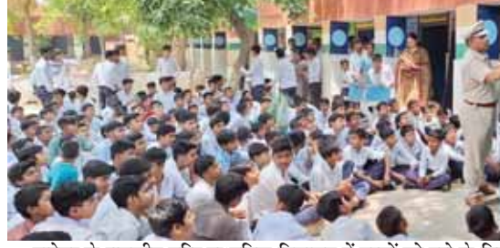
मानेसर के राजकीय वरिष्ठ माध्यमिक विद्यालय में बच्चों को नशे के विरुद्ध जागरूक करते हरियाणा राज्य नारकोटिक्स कंट्रोल ब्यूरो के अधिकारी।