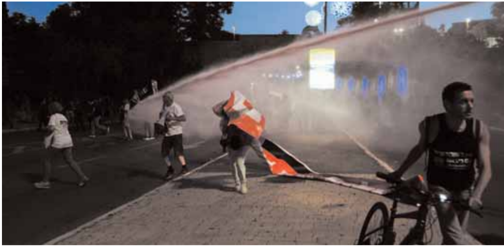
येरूशलम में इजराइल की संसद नेसेट के बाहर इजरायली प्रधान मंत्री बेंजामिन नेतन्याहू की सरकार के खिलाफ विरोध प्रदर्शन के दौरान गाजा एपी में हमाम आतंकवादी समूह द्वारा बंधक बनाए गए बंधकों की हिंसई की गांज कर रहे प्रदर्शनकारियों को तितर-बितर करने के लिए पुलिस ने पानी की बोझार का इस्तेमाल किया

अंतरराष्ट्रीय आपराधिक अदालत की स्थापना 2002 में हुई थी, जो युद्ध के दौरान अपराधों, मानवता के खिलाफ अपराधों, नरसंहार और हमले संबंधी अपराधों के लिए लोगों के खिलाफ मुकदमा चलाती है। इजराइल, अमेरिका, चीन और रूस सहित कई देश न्यायालय के क्षेत्राधिकार को स्वीकार नहीं करते।