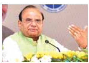
पायनियर समाचार सेवा। नई दिल्ली

दिल्ली के उपराज्यपाल विनय कुमार सक्सेना ने मंगलवार को आप नेता और राज्यसभा सांसद स्वाति मालीवाल पर हुए कथित हमले पर पहली बार प्रतिक्रिया व्यक्त करते हुए बताया कि मालीवाल ने बेहद पीड़ा में होने के कारण एक दिन पहले सोमवार को उन्हें फोन किया था। सक्सेना ने कहा कि