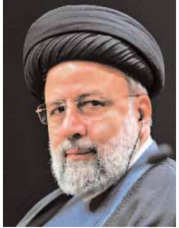
इसलिए, भले ही रईसी के उत्तराधिकारी को एक रूढ़िवादी आंतरिक हलके द्वारा नामित और समर्थित किया जाएगा, वह कुछ हद तक उदारवादी रख अपना सकता है। वर्तमान संसद अध्यक्ष, मोहम्मद बघेर गालिबफ, या पूर्व अध्यक्ष अली लारिजानी जैसे लोग, जो दोनों उदारवादी रूढ़िवादी

दिया है और कई साजिश सिद्धांतों को हवा दी है। जनता में अफवाहों ने जोर पकड़ लिया है कि राष्ट्रपति का हेलीकॉप्टर दुर्घटना इलेक्ट्रॉनिक युद्ध, ड्रोन हमले या यहां तक कि इजराइल द्वारा किए गए जमीनी हमले का परिणाम था। (सरकारी समाचार एजेंसी इरना ने कहा कि दुर्घटना तकनीकी विफलता के कारण हुई थी।)