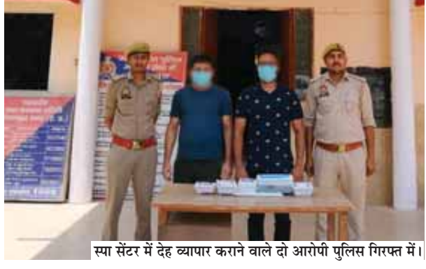
स्पा सेंटर में देह व्यापार कराने वाले दो आरोपी पुलिस गिरफ्तार में।

ऐसे में सोमवार की रात पुलिस और एंटी ड्रग्स ट्रेफिकिंग की टीम ने छापा मारकर। यहां से 2 लड़कियों को बचाया गया। इन्हें नारी निकेतन भेज दिया गया है। नोएडा के बरौला में पिलर नंबर 44 के सामने एलोरा थाई स्पा सेंटर है। बताया गया कि यहां कुछ लड़कियों पर दबाव और पैसों का लालच देकर सेक्स रैकेट चलाया जा रहा है। जांच में सामने