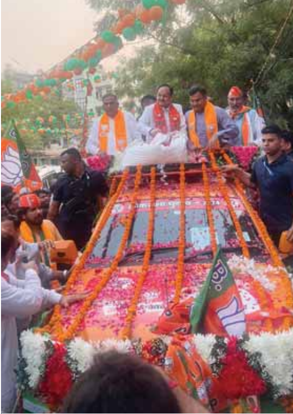
रैली में लोगों को अभिवादन स्वीकर करते भाजपा अध्यक्ष जेपी नड्डा।

दक्षिणी दिल्ली से पार्टी के उम्मीदवार रामवीर सिंह बिधुड़ी के समर्थन में नड्डा ने दक्षिणी दिल्ली के पालम इलाके में एक रोड शो भी किया। अपने रोड शो के दौरान बीजेपी प्रमुख ने केजरीवाल पर हमला बोलते हुए कहा, आम आदमी पार्टी के देश विरोधी ताकतों से गहरे