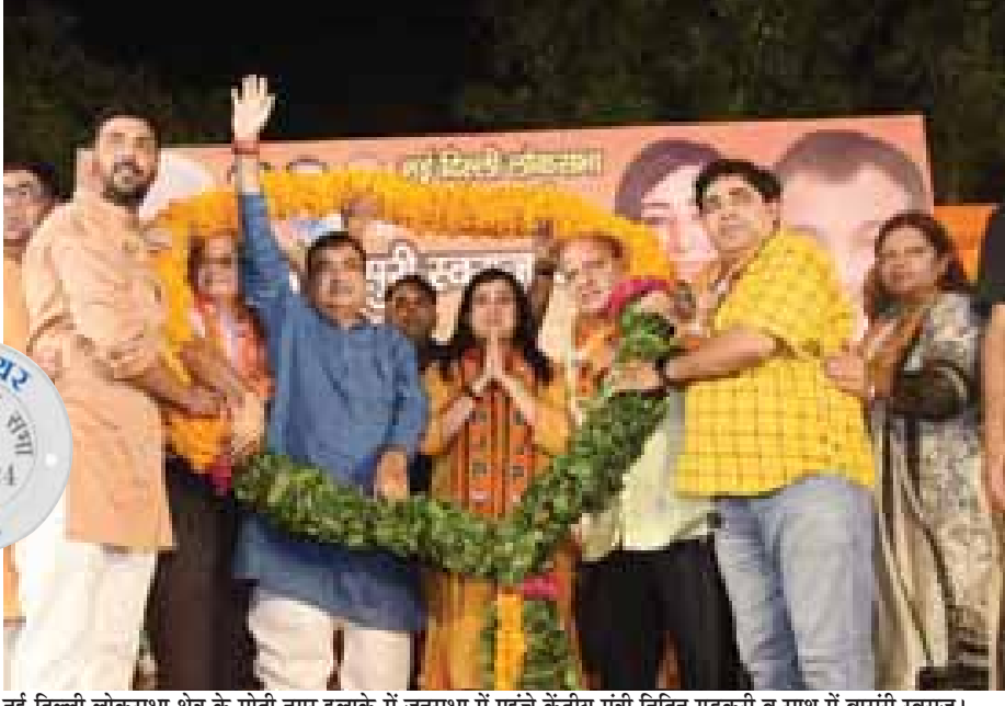
नई दिल्ली लोकसभा क्षेत्र के मोती नगर इलाके में जनसभा में पहुंचे केद्रीय मंत्री नितिन गडकरी व साथ में बांसुरी स्वरान।

राष्ट्रीय राजधानी में लोकसभा चुनाव प्रचार दो दिनों में समाप्त होने जा रहा है। ऐसे में मंगलवार को भाजपा प्रत्याशियों की जीत के लिए पार्टी के स्टाफ प्रचारकों ने लगातार रैलियां और रोड शो कर प्रचार किया। इस सूची में रक्षा मंत्री राजनाथ सिंह, भाजपा अध्यक्ष जेपी नड्डा, सड़क और परिवहन मंत्री नितिन गडकरी, मध्य प्रदेश के पूर्व मुख्यमंत्री शिवराज सिंह चौहान, राजस्थान के मुख्यमंत्री भजन लाल शर्मा और गोवा के मुख्यमंत्री प्रमोद सावंत शामिल रहे।