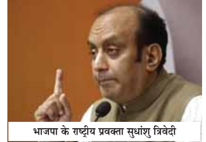
भाजपा के राष्ट्रीय प्रवक्ता सुधांशु त्रिवेदी

भाजपा के राष्ट्रीय प्रवक्ता सुधांशु त्रिवेदी ने एक संवाददाता सम्मेलन को संबोधित करते हुए केजरीवाल से पूछा कि कुमार के खिलाफ कोई कार्टवर्ड क्यों नहीं की गई जबकि उनकी पार्टी के राज्यसभा सदस्य संजय सिंह ने हाल ही में एक