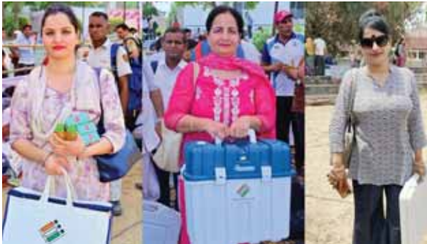
गुरुग्राम में चुनाव सामग्री लेकर मतदान केंद्रों को रवाना हो रही महिला कर्मचारी।

हर एक पंडाल में जाकर डीसी के कर्मचारियों को समझाया कि वे सभी बूथ पर पहुंचने के बाद अपने मतदान केंद्र की व्यवस्था को संभालेंगे। बूथ पर कहां वोटिंग कंपार्टमेंट बनाया है, पोलिंग एजेंट