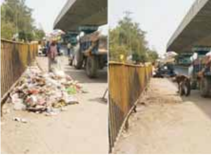
नगर निगम कर्मचारियों द्वारा की जा रही सफाई।

गुरुग्राम को साफ-सुथरा बनाने तथा कचरे का नियमित उठान सुनिश्चित करने के लिए निगमायुक्त डा. नरहरि सिंह बांगड़ द्वारा दिए गए निर्देशों पर शहर में सफाई का काम किया जा रहा है। अभियान के तहत नगर निगम की टीमों अपने-अपने जोन में सड़कों के किनारे बने कचरा संवेदनशील स्थानों से लगातार कूड़ा उठा रही हैं। साथ ही सेकेंडरी कलेक्शन प्लांटों से भी डंकरों के माध्यम से कूड़ा उठाने युद्ध स्तर पर जारी है। एक ओर जहां स्वच्छता कर्मी विभिन्न सड़कों, बाजारों व अन्य सार्वजनिक स्थानों की सफाई दुरुस्त कर रहे हैं, वहीं