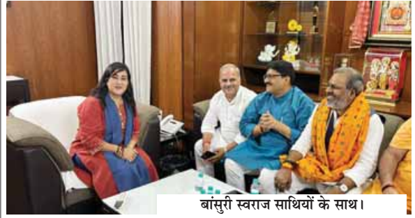
बांसुरी स्वराज साथियों के साथ।

● किसी ने परिवार के साथ तो कोई देवदर्शन कर थकान दूर की