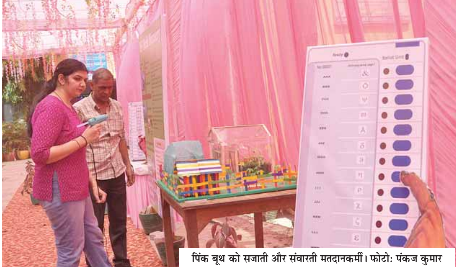
पिंक बूथ को सजाती और संवारी मतदानकर्मी।

भीषण गर्मी और दो महीने लंबे प्रचार के बाद दिल्ली शनिवार को मतदान के लिए पूरी तरह तैयार है। राष्ट्रीय राजधानी की सात लोकसभा सीटों पर भारतीय जनता पार्टी और इंडिया गठबंधन के बीच सीधा मुकाबला है। चुनाव से पहले ही