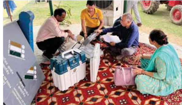
फरीदाबाद में चुनाव सामग्री लेकर रवाना होते मतदानकर्मी।