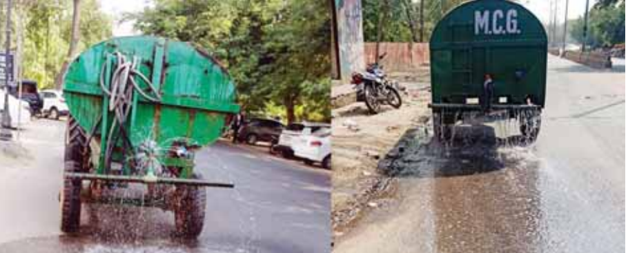
भीषण गर्मी के कारण बढ़ते तापमान को कम करने के लिए गुरुग्राम में सड़कों पर पानी का छिड़काव करते नगर निगम के टैंकर।

पिछले कुछ दिनों से गुरुग्राम में भीषण गर्मी पड़ रही है। पारा काफी अधिक उभर जा चुका है। जिससे दिन का तापमान काफी बढ़ गया है। गर्म हवाओं के कारण आमजन को भारी परेशानी का सामना करना पड़ रहा है। ऐसे में नगर निगम गुरुग्राम तापमान को नियंत्रित करने के लिए विभिन्न सड़कों पर टैंकरों के माध्यम से एसटीपी ट्रीटिड वाटर का छिड़काव करवा रहा है, ताकि नागरिकों को गर्मी से कुछ राहत मिल सके। नगर निगम गुरुग्राम के आयुक्त