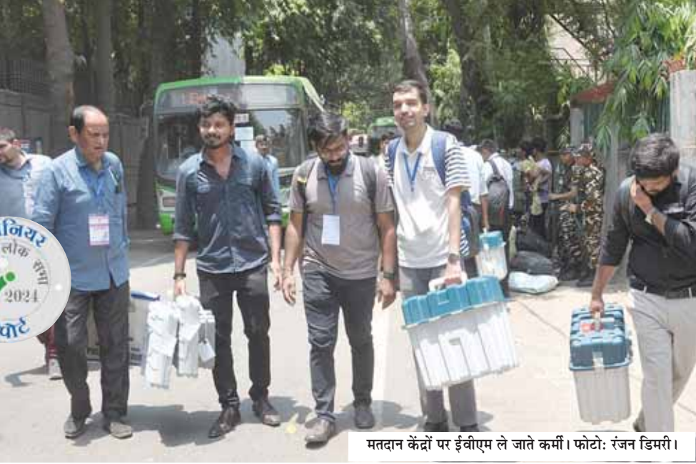
मतदान केंद्रों पर ईवीएम ले जाते कर्मी।

पुलिस ने सशय कले खोपमजीएम से राष्ट्रीय राजमार्ग-24 की ओर जाने वाले यात्रियों को सीधे अक्षधाम फ्लाईओवर की ओर जाने और पुस्ता रोड, आईटीओ या विकास मार्ग तक पहुंचने के लिए बाएं मुड़ने की सलाह दी है।