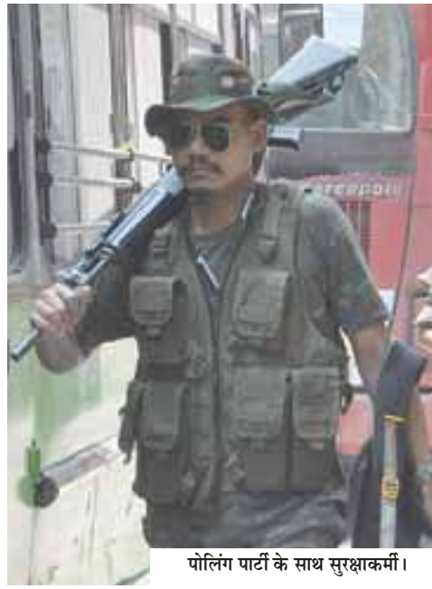
पोलिंग पार्टी के साथ सुरक्षाकर्मी।

ओर जाने वाले यात्रियों को सलाह दी गई है कि वे अपनी यात्रा में किसी भी अप्रत्याशित देरी की आशंका के चलते पर्याप्त समय लेकर चलें।