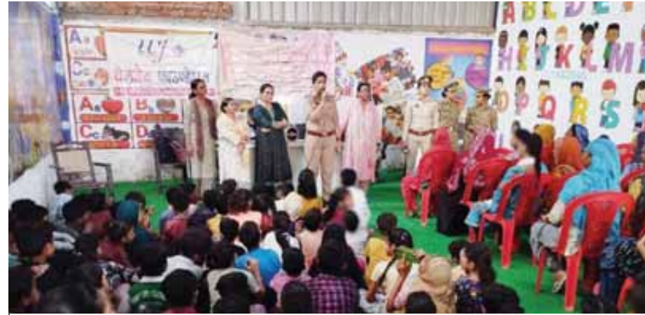
गौतम बुद्धनगर में महिला सुरक्षा को लेकर लोगों को जागरूक करती पुलिस अधिकारी।

जिसके बाद 15 अग्निशमन की गाड़ियों को घटनास्थल के लिए रवाना किया गया। दमकल विभाग के का कहना है कि फिलहाल किसी के हाताहत होने की सूचना नहीं मिली है और आशंका जताई जा रही है कि आग शॉर्ट सर्किट के कारण लगी, लेकिन अभी पुष्टा तौर पर कुछ नहीं कहा जा सकता है। हालांकि बैंकट हॉल में रखा सारा सामान जलकर खाक हो गया है। आग पर काबू पा लिया गया है। दमकल विभाग ने जांच शुरू कर दी है।