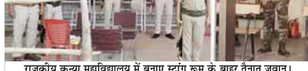
राजकीय कन्या महाविद्यालय में बनाए स्ट्रॉंग रूम के बाहर तैनात जवान।