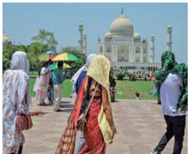
आगरा में तपिश भरी गर्मी के दिन ताजमहल देखन आए पर्यटक।

राष्ट्रीय राजधानी दिल्ली के कुछ हिस्सों में तापमान 47 डिग्री सेल्सियस तक बढ़ गया है। साथ ही राजस्थान, पंजाब, चंडीगढ़ और हरियाणा जैसे उत्तर-पश्चिमी राज्य और देश के मध्य भाग तीव्र गर्मी की लहरों से जूझ रहे हैं। इस तपिश के चलते चहरी गतिविधियाँ लगभग असंभव हो गई हैं। यह चुनौतीपूर्ण स्थिति कम से कम अगले तीन दिनों तक बनी रहने की उम्मीद है। मौसम विभाग ने राजस्थान सहित कई उत्तर भारतीय शहरों में लू के लिए रेड अलर्ट जारी किया है। भारतीय मौसम विज्ञान विभाग (आईएमडी) के पूर्वानुमान के मुताबिक, ताजा पश्चिमी विक्षोभ के कारण 1 जून से भीषण मौसम से राहत मिलने की उम्मीद है। प्रचंड गर्मी ने निवासियों को घर के अंदर रहने को मजबूर कर दिया है, जिसके परिणामस्वरूप सार्वजनिक स्थान लगभग वीरान हो गए हैं,