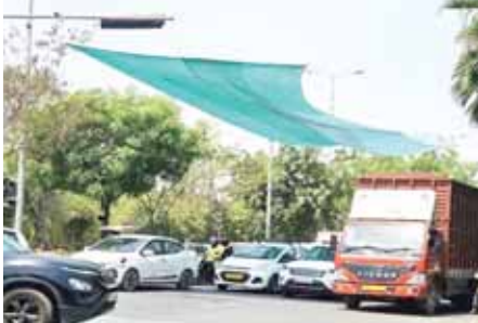
लाईट व यातायात ठहराव के दौरान यातायात पुलिस कर्मी व आमजन सीधी धूप के सम्पर्क में आने से बचे रहे हैं व उनके स्वास्थ्य पर हानिकारक प्रभाव न पड़े।

इस समय लगातार भीषण गर्मी पड़ रही है और तापमान 45 के पार जा चुका है। हीट वेव के चलते लोग घरों से कम बाहर निकल रहे हैं। अब ऐसे में नोएडा पुलिस ने भी लोगों को गर्मी से निजात दिलाने के लिए नई पहल की है। नोएडा पुलिस कमिश्नर लक्ष्मी सिंह के दिए गए निर्देशों के क्रम में ट्रैफिक पुलिस ने एक नई पहल की है। इसके अंतर्गत ऐसे चौराहों, जहां पर दोपहियां वाहनों की संख्या बहुत अधिक है और रेड लाइट पर बहुत देर तक रुकना पड़ता है। ट्रैफिक को दबाव के कारण उनको भीषण गर्मी से राहत दिलाने के लिए चौराहों व रेड लाइट के पास ग्रीन नेट की व्यवस्था की जा रही है। इससे रेड