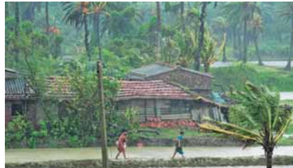
बंगाल के दक्षिण 24 परगना जिले में चक्रवाती तूफान के आने के बाद हर तरफ जल पानी।

पुलिस ने बताया कि पहली मौत कोलकाता के पार्क सर्कस और एंटली इलाके के पास बिबोर बागान में बारिश के कारण एक दीवार गिरने से हुई। सुंदरबन के पास बंगाल की खाड़ी के मुहाने पर मौसुनी द्वीप समूह में बारिश और 135 किमी प्रति घंटे की तेज हवाओं के कारण एक पेड़ गिरने से एक और व्यक्ति की मौत हो गई। सूत्रों ने बताया कि कोलकाता और कोकटोप में विभिन्न स्थानों पर कम से कम 8 अन्य लोग घायल हो गए। सूत्रों ने सोमवार को बताया कि भीषण चक्रवात रेमल, बंगाल के सागर द्वीप समूह और पड़ोसी बांग्लादेश के खेपुपारा के बीच