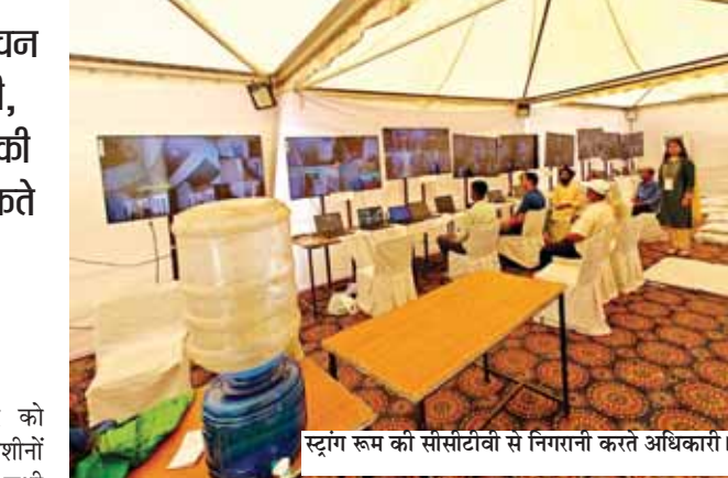
स्ट्रॉंग रूम को सीसीटीवी से निगरानी करते अधिकारी।

राष्ट्रीय राजधानी दिल्ली में शनिवार को मतदान के बाद ईवीएम और वीवीपैट मशीनों को स्ट्रॉंग रूम में सुरक्षित रखा गया है। सभी संसदीय क्षेत्रों में बनाए गए स्ट्रॉंग रूम की निगरानी सीसीटीवी कैमरों की मदद से की जा रही है और सुरक्षा बल तैनात किए गए हैं। दिल्ली के मुख्य निर्वाचन अधिकारी पी. कृष्णमूर्ति ने बताया कि सात संसदीय क्षेत्रों के स्ट्रॉंग रूम में रखे गए ईवीएम और वीवीपैट