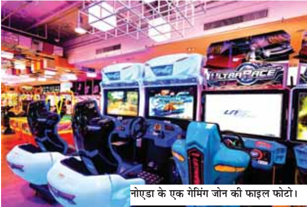
नोएडा के एक गेमिंग जोन की फाइल फोटो।

गुजरात के राजकोट में स्थित गेमिंग जोन में हुए दर्दनाक हादसे को लेकर नोएडा कमिश्नर पुलिस भी सतर्क हो गयी है। नोएडा कमिश्नर पुलिस की पुलिस कमिश्नर लक्ष्मी सिंह के निर्देशों पर एक टीम बना दी गयी है जो नोएडा गौतमबुद्धनगर में स्थित गेमिंग जोन का फायर सेफ्टी चेक व अन्य सुरक्षा उपायों की जांच करेगी।