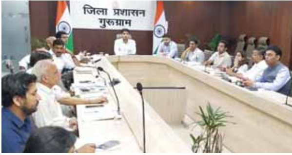
मुख्य चुनाव आयुक्त राजीव कुमार के साथ वर्युअल बैठक में जुड़े अधिकारी।

भारत निर्वाचन आयोग के मुख्य चुनाव आयुक्त राजीव कुमार ने शांतिपूर्ण और निष्पक्ष माहौल में मतदान संपन्न करवाने के लिए जिला निर्वाचन अधिकारियों के कार्य को सराहना किया है। उन्होंने कहा कि इसी कार्यकुशलता से जिला निर्वाचन अधिकारी चार जून को मतगणना करवाए। इसमें सुरक्षा के दायरों का पूरा ध्यान रखा जाए। वे सोमवार को लघु सचिवालय सभागार में भारत सरकार के मुख्य चुनाव आयुक्त