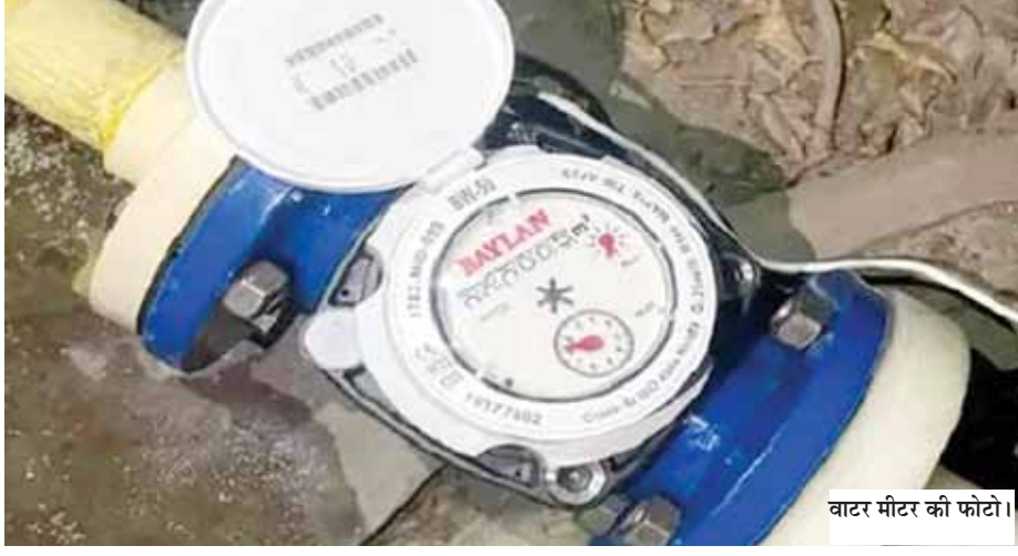
वाटर मीटर की फोटो।

नोएडा वासियों को प्रति यूनिट को दर से पानी का बिल देना होगा। इसके लिए शहर में वाटर मीटर लगाए जाने हैं। पायलट प्रोजेक्ट के तहत 5000 वाटर मीटर लगाने का काम पूरा हो चुका है। अगले महीने से 82 हजार वाटर मीटर लगाने का काम होगा। इसके लिए कंपनी का चयन किया जाएगा। इसके बाद बनाए गए जल एप में ऑन लाइन बिल भरने का प्रावधान भी होगा। इसके लिए जल्द ही प्रति यूनिट दर तय की जाएगी। नोएडा में वर्तमान में भूखंड के साइज के हिसाब से पानी की बिल लिया जाता है। अब नए सिस्टम में वाटर मीटर लगाए जा रहे हैं। इसमें प्रति यूनिट के हिसाब से पानी का बिल लिया जाएगा। यूनिट दर के लिए दिल्ली और हरियाणा की पॉलिसी को