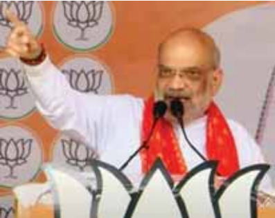
जनसभा को संबोधित करते अमित शाह।

केंद्रीय गृहमंत्री अमित शाह ने कन्नौज के तिर्वा क्षेत्र में जनसभा को संबोधित करते हुए अखिलेश यादव और समाजवादी पार्टी पर बड़ा हमला बोलते हुये कहा कि मुलायम सिंह का परिवार यहां कितनी बार आया। अमित शाह ने कहा- सालों तक यहां की जनता ने मुलायम