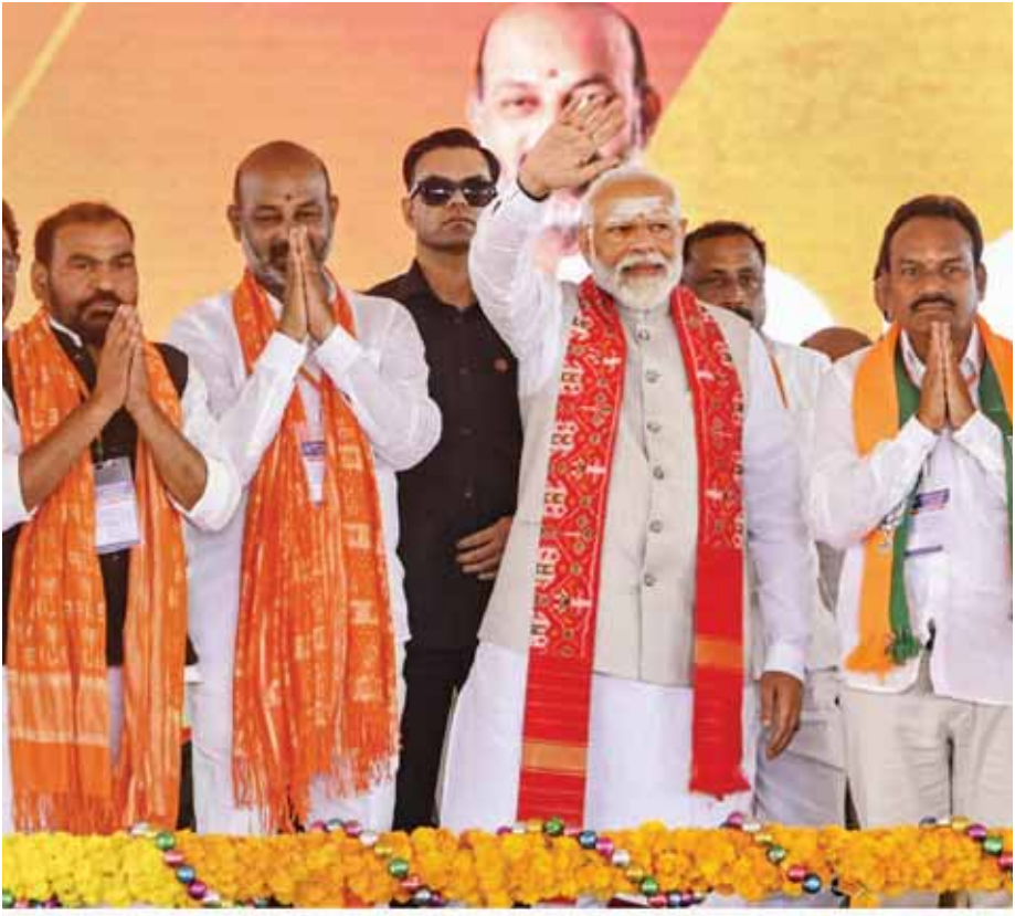
तेलंगाना के करीमनगर में प्रधानमंत्री नरेन्द्र मोदी लोगों का अभिवादन करते हुए।

नई दिल्ली। वित्त मंत्री निर्मला सीतारमण ने बुधवार को कहा कि कांग्रेस नीत संयुक्त प्रगतिशील गठबंधन (संग्रम) सरकार के दौरान सार्वजनिक उपक्रमों को नुकसान उठाना पड़ा था। उन्होंने कहा कि पहले उपेक्षित रहे हिंदुस्तान एयरोनॉटिक्स लिमिटेड (एचएएल) जैसे उपक्रमों का प्रधानमंत्री नरेन्द्र मोदी नीत सरकार के दौरान पुनर्स्थान हुआ। कांग्रेस पार्टी तथा उसके नेता रहलु गांधी के सार्वजनिक क्षेत्र की कंपनियों के पेशानी झेलने के आरोपों का खंडन करते हुए सीतारमण ने कहा कि यह उल्टा चोर कोतवाल को डांट जैसा है। मंत्री ने सोशल मीडिया मंच एक्स पर लिखा, सार्वजनिक क्षेत्र के उपक्रम (पीएसयू) फल-फूल रहे हैं, तथा उन्हें बढ़ी हुई परिचालन स्वतंत्रता के साथ-साथ उनमें पेशेवर संस्कृति का संचार हुआ है। कांग्रेस नीत संग्रम सरकार के दौरान सार्वजनिक क्षेत्र के उपक्रमों को नुकसान उठाना पड़ा।