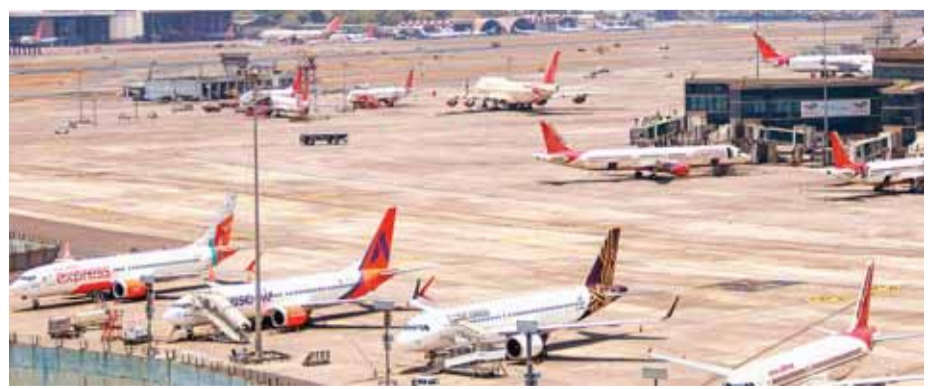
मुंबई में हवाई अड्डे पर खड़े एयर इंडिया और अन्य विमान

कुप्रबंधन के विरोध में केबिन कू के बीमार होने की सूचना देने के बाद मंगलवार रात से 170 से अधिक उड़ानें रद्द कर दी हैं। कई उड़ानें रद्द होने और यात्रियों की असुविधा के बाद सरकार को इसमें शामिल होना पड़ा। क्षेत्रीय श्रम आयुक्त अशोक परेम्भल्ला के अनुरोध पर समाधान तक पहुंचने के लिए एयर इंडिया एक्सप्रेस यूनियन और एयरलाइन सीईओ के बीच बृहस्पतिवार को एक बैठक हुई। जाहिर तौर पर बैठक के बाद कोई बीच का रास्ता निकल गया है और हड़ताल खत्म हो जाएगी, जिससे यात्रियों को काफी राहत मिलेगी। प्रभावित कर्मचारियों को भेजे गए बर्खास्तगी के ईमेल नोटिस में, एयरलाइन ने कहा था कि बड़े पैमाने पर बीमार छुट्टी ने प्रासंगिक कानूनों के