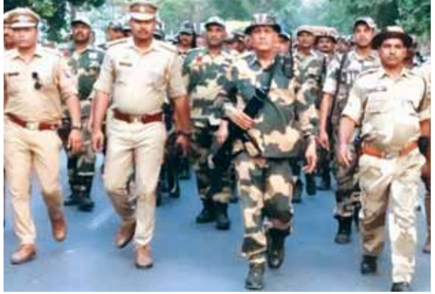
नगर में रूटमार्च करते पुलिस व बीएसएफकी जवान।

● निष्पक्ष व निर्भीक मतदान करारों के लिये पुलिस पूरी तरह तैयार है: कोतवाला