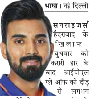
भाषा। नई दिल्ली