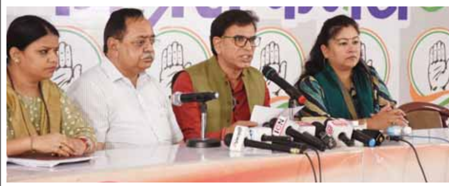
पायनियर समाचार सेवा। लखनऊ