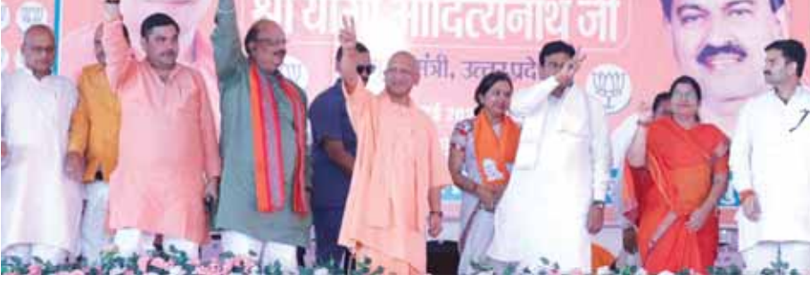
मुख्यमंत्री योगी आदित्यनाथ जी के साथ मेमबरा के साथ पार्टी के नेताओं के साथ

मुख्यमंत्री योगी आदित्यनाथ ने कहा कि लोकसभा चुनाव में यूपी में सपा का खाता भी नहीं खुलेगा। उन्होंने कहा कि समाजवादी पार्टी के मुखिया के परिवार की पांचों सीटों पर हार सुनिश्चित है। सीएम योगी गुरुवार को गोला में खीरी लोकसभा सीट के लिए चुनावी जनसभा को संबोधित कर रहे थे। इस दौरान उन्होंने पार्टी प्रत्याशी अजय मिश्रा टोनी के लिए वोट की अपील की। मुख्यमंत्री ने बाबा गोला गोकर्णनाथ की पावन धरा को नमन करते हुए महाराणा प्रताप की पावन जयंती पर उन्हें श्रद्धासुप्त अर्पित किए। सीएम योगी ने कहा कि लोकसभा चुनाव के तीन चरण पूरे हो चुके हैं। देश में एक ही स्वर गूंज रहा है फिर एक बार मोदी सरकार। उन्होंने कहा कि