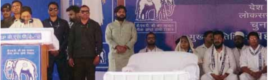
जनसभा को संबोधित करती बसपा सुप्रीमों।