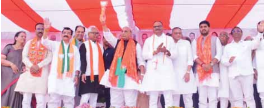
पायनियर समाचार सेवा। लखनऊ