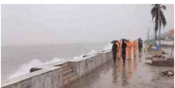
को, 2021 में तीन जून को और 2020 में एक जून को दक्षिणी राज्य में पहुंचा था। आईएमडी ने पिछले महीने ला नीना की अनुकूल स्थितियों के कारण सामान्य से अधिक बारिश होने का पूर्वानुमान बताया था। ला नीना की स्थितियों भारत में मानसून के दौरान अच्छी बारिश में मदद करती हैं। देश का बड़ा हिस्सा भीषण गर्मी से जूझ रहा है और कई स्थानों पर अधिकतम तापमान 48 डिग्री सेल्सियस तक पहुंच गया है। कई राज्यों में गर्मी का

नई दिल्ली (भाषा) भारत की कृषि आधारित अर्थव्यवस्था की जीवन रेखा दक्षिण-पश्चिम मानसून ने रविवार को देश के दक्षिणी छोर निकोबार द्वीप पर दस्तक दे दी। भारत मौसम विज्ञान विभाग (आईएमडी) ने यहां यह जानकारी दी। मौसम कार्यालय ने कहा, दक्षिण-पश्चिम मानसून रविवार को मालदीव के कुछ हिस्सों, कोमोरिन क्षेत्र और दक्षिण बंगाल की खाड़ी, निकोबार द्वीप समूह और दक्षिण अंडमान सागर के कुछ हिस्सों में पहुंच गया है। मानसून के 31 मई तक केवल पहुंच जाने की उम्मीद है। आईएमडी के आंकड़ों के अनुसार, पिछले 150 साल में केरल में मानसून की शुरुआत की तारीख व्यापक रूप से अलग-अलग रही है। केरल में मानसून सबसे देरी से 1972 में 18 जून को और सबसे पहले 1918 में 11 मई को पहुंचा था। मानसून पिछले साल आठ जून को, 2022 में 29 मई