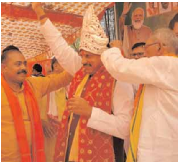
करते हैं इन्हें दूर करें गाजीपुर में टिफिन बमए साइकिल बम फूटा करता था जो लोग देश को खाते हैं लेकिन विरोधी देश का गाते हैं ऐसे लोगों को भारतीय जनता पार्टी का एक.एक कार्यकर्ता अबकी बार जवाब देने के लिए तैयार हो चुका है। यह चुनाव मात्र पार्टी का

गाजीपुर। लोकसभा भाजपा प्रत्याशी पारसनाथ राय के समर्थन में जंगीपुर विधानसभा के शिखर हनुमान मंदिर के बगीचे में विशाल जनसभा का आयोजन किया गया। इस मौके पर मुख्य अतिथि मध्य प्रदेश के मुख्यमंत्री मोहन यादव ने अपने संबोधन में कहा कि सनातन धर्मए सनातन संस्कृति के अनुसार मैं महाकाल से आता हूं तो आप सभी बाबा विश्वनाथ की धरती के लोग हैं। गंगा जी के किनारे रहने वाले लोग हैं और आप कई बिंदुओं पर पहचाने जाते हैं इतना ही नहीं उन्होंने सपा प्रत्याशी अफजाल अंसारी का बिना नाम लिए कहा कि विपक्ष के प्रत्याशी को यह बता दो की 56 इंच का सीना है। अब ऊंट पहाड़ के नीचे आ गया है समझ में आ जाएगा। गंगा माताएगी माताएभगवान राम का चुनाव है कम के कुल का खात्मा होकर रहेगा। उन्होंने कहा कि गाजीपुर में फैक्ट्री नहीं है जब मैं इसका कारण पूछा तो लोगों ने बताया कि फैक्ट्री तो है लेकिन वहां पर हथियार और आतंक की फैक्ट्री है ऐसे लोग जनपद की पहचान की धूमिल