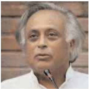
मोदी सरकार के अन्यायकाल-पूरी तरह से दुर्भावनापूर्ण और सौतेले व्यवहार का सामना कर रहा है। उन्होंने कहा, आमतौर पर 2019 में, मोदी सरकार ने लद्दाख को बिना विधायकता वाले केंद्र शासित प्रदेश में तब्दील करके वहां के लोगों का सारा प्रतिनिधित्व छीन लिया।रमेश ने दावा किया, मोदी सरकार और उसके करीबी कॉर्पोरेट मित्रों का लालच लद्दाख के नाजुक पारिस्थितिकी तंत्र को खतरे में डाल रहा है। खनन जैसे

नई दिल्ली (भाषा) कांग्रेस ने लद्दाख लोकसभा सीट पर मतदान से एक दिन पहले रविवार को आरोप लगाया कि यह केंद्र शासित प्रदेश पिछले 10 वर्षों से मोदी सरकार के दुर्भावनापूर्ण और सौतेले व्यवहार का सामना कर रहा है। कांग्रेस महासचिव जयराम रमेश ने कहा कि लद्दाखवासी भीषण टंड के बीच अपनी जमीन और पानी पर नियंत्रण की कमी को लेकर विरोध प्रदर्शन कर रहे हैं। उन्होंने कहा, 'विरोध प्रदर्शन महीनों से चल रहा है, जिसमें सभी 8 जनजातियां और 30,000 से अधिक लोग भूख हड़ताल और विशाल मार्च के लिए एकसाथ आए हैं।' रमेश ने दावा किया कि मोदी सरकार की एकमात्र प्रतिक्रिया लगातार चुप्पी और उदासीनता रही है। कांग्रेस महासचिव ने सोशल मीडिया मंच एक्स पर एक पोस्ट में कहा कि 20 मई को, लद्दाख में चुनाव होंगे, और पिछले 10 वर्षों से, लद्दाख