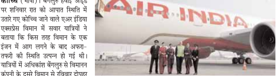
जिम्मेदार थे। उन्होंने बाहर निकलने में हमारी मदद की। उन्होंने हमें बचाने के लिए हर संभव कोशिश की। हम उनके आभारी हैं। एक अन्य बुजुर्ग महिला ने कहा कि आग लगने के बाद विमान के अंदर जोर-जोर से चीख-पुकार मच गई और लैंडिंग के तुरंत बाद सभी लोग बच गए। एक महिला यात्री ने अपना अनुभव बताते हुए कहा कि चालक दल ने उन्हें शांत रहने की सलाह दी और फिर जल्दी से बाहर निकलने का निर्देश दिया। एक पुरुष यात्री ने कहा कि उड़ान भरने के पांच मिनट बाद आग देखी गई। उन्होंने कहा, इसके तुरंत बाद, आपातकालीन लैंडिंग की गई। हम सभी

कोच्चि (भाषा) । बेंगलुरु हवाई अड्डे पर शनिवार रात को आपात स्थिति में उतारे गए कोच्चि जाने वाले एयर इंडिया एक्सप्रेस विमान में सवार यात्रियों ने बताया कि किस तरह विमान के एक इंजन में आग लगने के बाद अफगानिस्तान की स्थिति उच्यतन हो गई थी। यात्रियों में अधिकांश बेंगलुरु से विमान कंपनी के दूसरे विमान से रविवार होवाइ के आसपास कोचीन अंतरराष्ट्रीय हवाई अड्डे पर पहुंचे। यहां हवाईअड्डे पर पहुंचने के बाद अपने अनुभव साझा करते हुए यात्रियों ने कहा कि बेंगलुरु के केम्पेगोड़ा अंतरराष्ट्रीय हवाईअड्डे (केआईए) से उड़ान भरने के कुछ मिनट बाद आग लगने की सूचना मिलने पर वे हवाय गए। एक बुजुर्ग महिला यात्री ने अपना अनुभव बताते हुए कहा कि हवाई अड्डे पर पत्रकारों से कहा, 'हर कोई डर गया और जोर-जोर से गेने लागी' उन्होंने केम्पेगोड़ा हवाई अड्डे पर आपातकालीन लैंडिंग के तुरंत बाद उन्हें विमान से निकालने में दिखाई गई जिम्मेदारी के लिए चालक दल की सरहना की। उन्होंने कहा, वे बहुत