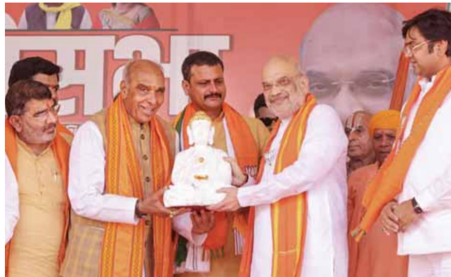
सिद्धार्थनगर में भाजपा की चुनावी रैली के दौरान पार्टी नेताओं ने केन्द्रीय गृह मंत्री अमित शाह का स्वागत किया