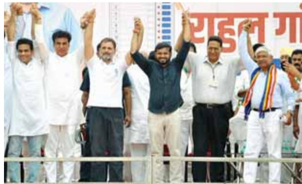
कांग्रेस नेता राहुल गांधी पार्टी नेता और इंडिया गुट से उत्तर पूर्वी दिल्ली से प्रत्यास्पर्धी कन्हैया कुमार के साथ दिल्ली में एक जनसभा के दौरान।

लोकसभा चुनाव के बीच कांग्रेस नेता राहुल गांधी ने बृहस्पतिवार को आम लोगों से जुड़ने के लिए दिल्ली में कांग्रेस के उम्मीदवार कन्हैया कुमार ने मोदी में अपने साथ यात्रा कर रहे राहुल गांधी की तस्वीरें साझा कीं। इस दौरान उन्होंने लोगों का हालचाल जाना। सफर के दौरान कांग्रेस नेता बच्चों के साथ भी मस्ती करते दिखे। मोदी में राहुल को देखकर उनके आस-पास कई यात्री इकट्ठा हो गए और पूर्व कांग्रेस अध्यक्ष के साथ सेल्फी भी ली। लोकसभा चुनाव प्रचार के अंतिम दिन राहुल गांधी कांग्रेस उम्मीदवार उजित राज के साथ मंगोलपुरी में एक रैली के लिए जा रहे थे। राष्ट्रीय राजधानी में छठे चरण के तहत 25 मई को मतदान है।