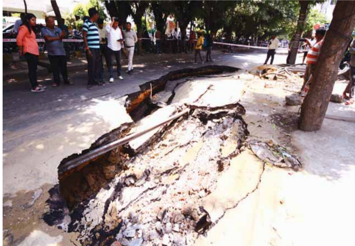
गोमती नगर के हुसैनिया चौराहे के समीप ध्वसी सड़क