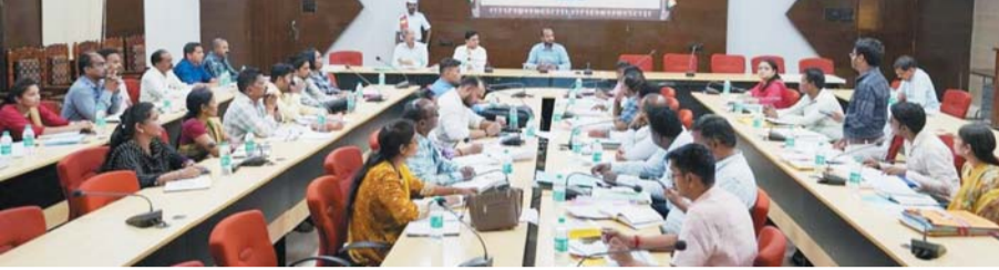
www.dailypioneer.com