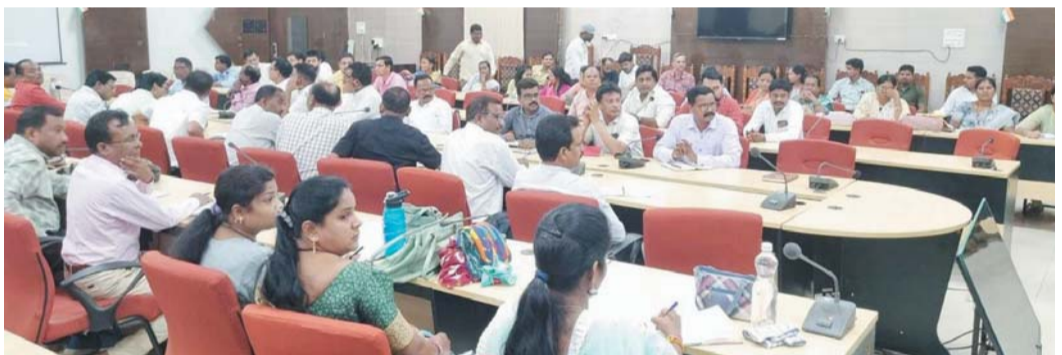
पायनियर संवाददाता जगदलपुर www.dailypioneer.com

बस्तर संभाग के 4 जिलों बस्तर, कांगेर, कोंडागांव एवं नारायणपुर के अंतर्गत समग्र शिक्षा के तहत लेखा एवं वित्तीय संधारण