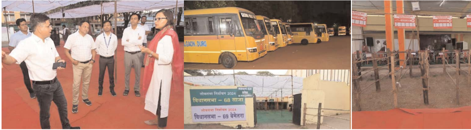
पायनियर संवाददाता < दुर्ग www.dailypioneer.com

जिले में लोकसभा निर्वाचन-2024 के अंतर्गत तृतीय चरण में 07 मई 2024 को मतदान संपन्न होगा। दुर्ग जिले में मतदान दलों को सामग्री वितरण कर संबंधित मतदान केन्द्रों के लिए रवानगी तीन अलग-अलग स्थानों पर किया जाएगा। सामग्री वितरण केन्द्रों में संपूर्ण तैयारियां पूर्ण कर ली गई हैं। सुबह 7 बजे मतदान दलों को सामग्री वितरण किया जाएगा।