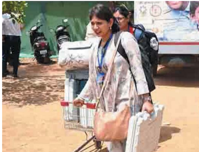
सुरक्षित और पारदर्शी निर्वाचन में सहयोग के लिए धन्यवाद दिया। इस दौरान कलेक्टर ने सुबह से ही स्ट्रॉंग रूम में पहुंचकर सभी बड़े अधिकारियों से लेकर बस चालकों को भी गुलाब फूल भेंटकर उत्साहवर्धन किया। कलेक्टर ने एसएसपी

लोकसभा निर्वाचन 2024 के तहत कलेक्टर एवं जिला निर्वाचन अधिकारी डॉ. गौरव सिंह और एसएसपी संतोष सिंह ने बीटीआई स्थित स्ट्रॉंग रूम पहुंचकर मतदान दल को गुलाब फूल भेंटकर शुभकामनाएं दीं। कलेक्टर डॉ. सिंह ने निर्वाचन कार्यों की व्यवस्था में लगे अतिरिक्त कलेक्टर, संयुक्त कलेक्टर, डिप्टी कलेक्टर से लेकर मतदान कर्मियों से मिलकर उनका हौंसला बढ़ाया। फिर मतदान दलों को मतदान केंद्र के लिए रवाना होने का सिलसिला शुरू हुआ। यही नहीं, कलेक्टर ने टेंट की व्यवस्थाएं, पानी की व्यवस्थाएं, साफ-सफाई की व्यवस्था से लेकर मतदान दलों को ले जाने वाले वाहनों के चालकों और कंडक्टरों से भी सुबह मुलाकात की और उन्हें निष्पक्ष,