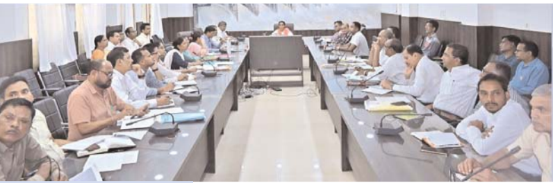
बंद हेडपम्पों को ठीक करने, कुओं और टिकियों की साफ सफाई सुनिश्चित करें

कलेक्टर नम्रता गांधी ने कलेक्टोरेट सभाकक्ष में समय सीमा की बैठक लेकर समय सीमा के लंबित प्रकरणों की विभागवार बारी-बारी से समीक्षा की। उन्होंने कहा कि गर्मी के मौसम के चलते भू-जल स्तर में गिरावट आ रही है। ग्रामीण इलाकों में पेयजल की कोई दिक्कत ना हो, इसके लिए गांवों में स्थित ऐसे हेडपम्प जो खराब हैं, उनकी आवश्यक मरम्मत