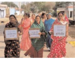
पायनियर संवाददाता < धमतरी www.dailypioneer.com

ग्रामीणों को नशा से मुक्ति दिलाने का बीड़ा कुरुद विकासखण्ड के ग्राम कोपेडीह (हंचलपुर) की महिलाओं ने उठाया है। इसके लिए उन्होंने रैली के जरिए