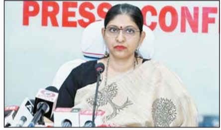
पायनियर संवाददाता < रायपुर www.dailypioneer.com

तीसरे चरण के लिए आज होने वाले मतदान के लिये सभी तैयारियां पूरी कर ली गयी हैं। इस चरण के चुनाव में लगभग 120 महिलाओं सहित 1,351 उम्मीदवार मैदान में हैं। इनमें केन्द्रीय मंत्री अमित शाह, ज्योतिरादित्य सिंधिया, पूर्व मुख्यमंत्री शिवराज सिंह चौहान, दिग्विजय सिंह, सांसद डिपल यादव और सुप्रिया सुले समेत कई दिग्गजों के चुनावी भविष्य का फैसला होगा। लोकसभा के पहले चरण में 19 अप्रैल को 21 राज्यों की 102 सीटों पर मतदान हुआ। छब्बीस अप्रैल को दूसरे चरण में 88 सीटों पर मतदान हुआ, जिसके बाद अब सात मई को तीसरे चरण के मतदान होंगे, 13 मई को चौथे, 20 मई को पांचवें, 25 मई को छठे, एक जून को सातवें चरण के मतदान होंगे। चार जून को वोटों की गिनती की जायेगी। तीसरे चरण के लिये सभी प्रत्याशियों और राजनीतिक दलों ने अपने पूरे जोश के साथ चुनावी प्रचार किया। चुनाव आयोग तीसरे चरण की वोटिंग को लेकर तैयारियों में जुटा हुआ है। चुनाव आयोग मतदान प्रतिशत बढ़ाने के लिये मतदाता जागरूकता अभियान के कई कार्यक्रम कर रहा है।