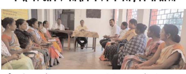
पायनियर संवाददाता < जशपुरनगर www.dailypioneer.com

करने हेतु विभिन्न रैलियों एवं अन्य माध्यमों से व्यापक प्रचार-प्रसार करवाकर मतदान के प्रति लोगों के मन में जागरूकता उत्पन्न की जा रही है। हर गली मोहल्ले टोले पारे में हर समय अधिकारी कर्मचारी आंगनवाड़ी कार्यकर्ता एवं स्व सहायता समूह की महिलायें जन जागरूकता अभियान चलाकर मतदान प्रतिशत बढ़ाने के लिए लगातार प्रयास किया जा रहा है। सभी मतदाताओं को प्रातः काल जल्दी मतदान केन्द्र पर आकर मतदान करने के लिए प्रेरित किया जा रहा है।