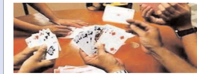
पायनियर संवाददाता < बिलासपुर www.dailypioneer.com