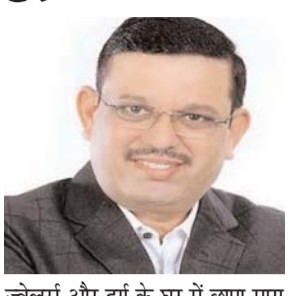
ज्वेलर्स और दुर्ग के घर में छापा मारा था। उसे कोर्ट में पेश किया जा सकता

पायनियर संवाददाता < रायपुर www.dailypioneer.com