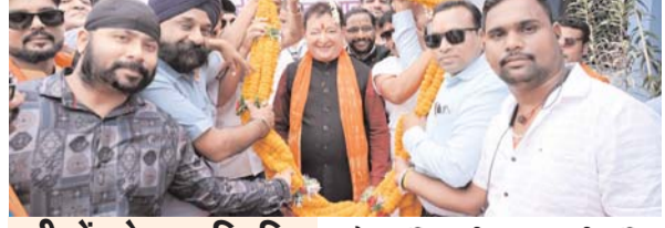
पायनियर संवाददाता < रायपुर www.dailypioneer.com

मरीजों को फल वितरित, अमृतधारा प्याऊ घर का उद्घाटन किया