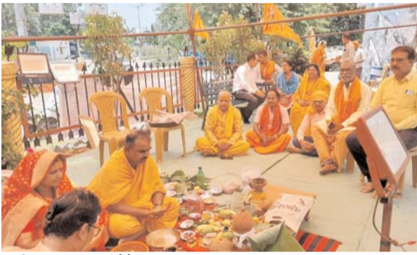
पायनियर संवाददाता < बेमेतरा www.dailypioneer.com