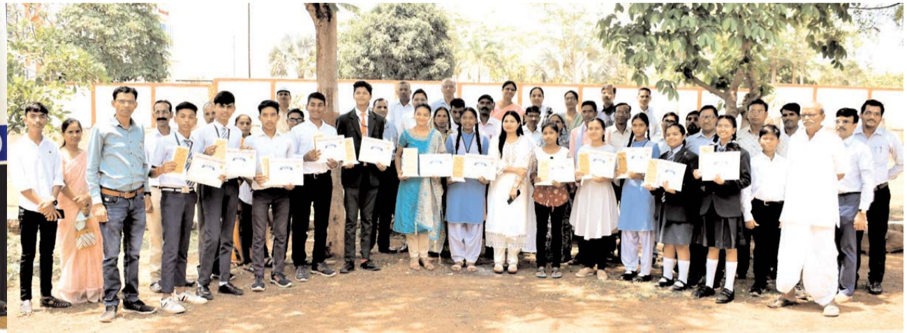
कोई डॉक्टर, नेवी मर्चेन्ट, डेटा साइंटिस्ट तो कोई आइएएस, इंजीनियर बन करना चाहते है देश व समाज की सेवा