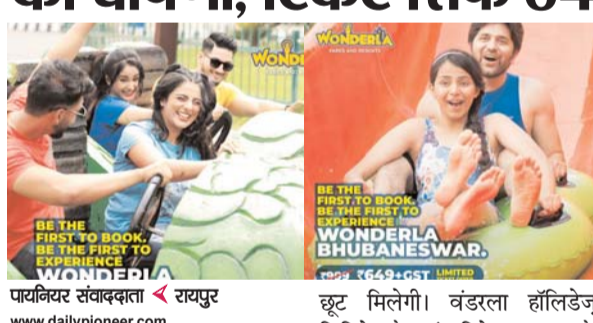
पायनियर संवाददाता < रायपुर www.dailypioneer.com

वंडरला हॉलिडेज, जो कि भारत की सबसे बड़ी मनोरंजन पार्क चैन है, ने भुवनेश्वर के कुम्भारवास्ता में 24 मई को खुलने वाले अपने मनोरंजन पार्क के विशेष लॉन्च ऑफर की घोषणा की है। वंडरला हॉलिडेज फिल्ड कौंच, बंगलुरु, हैदराबाद में तीन मनोरंजन पार्क और बंगलुरु में एक रिपोर्ट चलाता है, और अब भुवनेश्वर में आ रहा है। भुवनेश्वर में इस पार्क के लॉन्च के जश्न के तौर पर अली बर्ड ऑफर चलेगा, जिसमें ऑनलाइन बुकिंग पर पार्क टिकटों पर 25% की