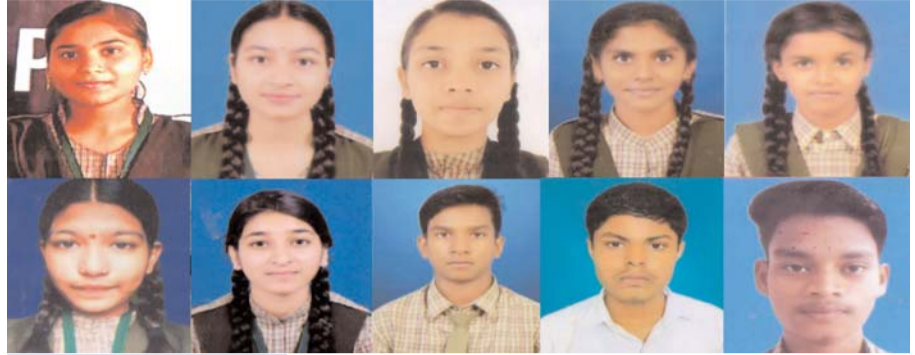
बोर्ड में भारतीय पब्लिक स्कूल का नगर में दबदबा