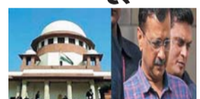
अंतरिम जमानत दे दी। न्यायमूर्ति संजीव खन्ना और न्यायमूर्ति दीपाकर दत्ता की

उच्चतम न्यायालय ने दिल्ली आबकारी नीति से संबंधित धनक्षोभन के एक मामले में जेल में बंद आम आदमी पार्टी के संयोजक और दिल्ली के मुख्यमंत्री अरविंद केजरीवाल को एक जून तक के लिए