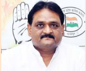
www.dailypioneer.com