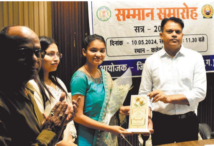
जिले के शासकीय स्कूलों का प्रदर्शन रहा बेहतर, 12 टॉपर्स में से 10 शासकीय स्कूल के विद्यार्थी