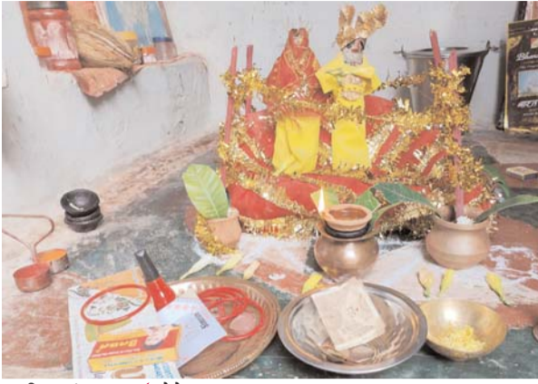
पायनियर संवाददाता < बेमेतरा www.dailypioneer.com

अक्षय तृतीया पर्व पर कई लोगों ने विभिन्न सामग्री का दान किया वहीं इस दिन जहाँ बच्चों ने भी पुतली पुतला का विवाह रचाया जबकि कई लोगों के द्वारा बाजार में खरीदी के कारण रौनक