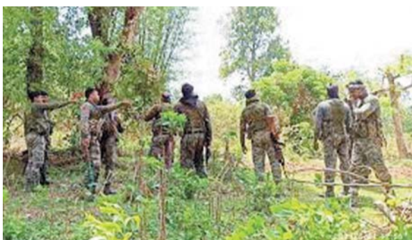
पायलियर संवादकता बीजापुर www.dailypioneer.com

छत्तीसगढ़ के बीजापुर जिले के पीड़ा के जंगलों में पुलिस और नक्सलियों के बीच जारी मुठभेड़ में शाम तक बारह नक्सलियों को ढेर कर दिया गया। वहीं, दो जवान भी घायल हुए हैं। मौके से भारी मात्रा में हथियार बरामद हुए हैं। पुलिस के उच्च अधिकारी पास के ही कैम्प से मानिट्रिंग कर रहे हैं। सचिंघ अभी