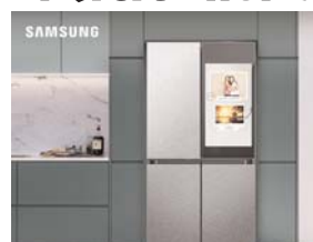
पायनियर संवाददाता < रायपुर www.dailypioneer.com

भारत के सबसे बड़े कंज्यूमर इलेक्ट्रॉनिक्स ब्रांड सैमसंग ने तीन नए रेफ्रिजरेटर को लॉन्च कर दिया है, जो उपभोक्ताओं को उनकी पसंद को जरूरतों के मुताबिक ढालने में मदद करते हुए भारतीय घरों के लिए स्मार्ट