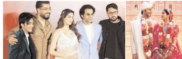
पायनियर संवाददाता < रायपुर www.dailypioneer.com

जब से नेटिजन्स को आगामी रोमांटिक ड्रामा 'मिस्टर एंड मिससेज माही' के हाल ही में रिलीज हुए ट्रेलर में 'देखा तेनु' की झलक मिली है, तब से गाने के पूर्ण रिलीज को लेकर काफी चर्चा और उत्साह है। आखिरकार इंतजार खत्म हुआ। 'मिस्टर एंड मिससेज माही' के निर्माताओं ने मुंबई में एक भव्य