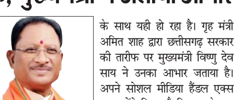
विपक्ष दे रहा नक्सलियों को ताकत पर मुकाम तक पहुंचेगी लड़ाई: शाह

गृह मंत्री अमित शाह ने छत्तीसगढ़ में विष्णुदेव साय सरकार के आने के बाद नक्सलियों के खिलाफ जारी लड़ाई के दौरान मिल रही अभूतपूर्व सफलताओं के लिए सरकार को पीठ थपथपाई है। गृह मंत्री ने कहा कि छत्तीसगढ़ में भाजपा सरकार बनने के बाद मात्र साढ़े चार महीने के अंदर 112 नक्सली मारे गए हैं, लगभग 375 नक्सलियों ने आत्मसमर्पण किया है और 153 नक्सली गिरफ्तार हुए हैं। 5 महीने में अभियान को जबर्दस्त सफलता मिली है। ये इस बात का पुख्ता प्रमाण है कि डबल इंजन की सरकार नक्सलवाद के खिलाफ मजबूती से लड़ाई लड़ रही है। अब प्रदेश के 3-4 जिलों में ही नक्सली बचे हैं और आगामी 2-3 वर्षों में देश नक्सल समस्या से मुक्त हो जाएगा। कांग्रेस द्वारा इसे फेक एनकाउंटर कहे जाने पर अमित शाह ने गोस्वामी तुलसीदास के एक दोहे का उदाहरण देते हुए कहा कि जिसका बुरा समय आता है, भगवान सबसे पहले उसकी मति हर लेता है। कांग्रेस पार्टी