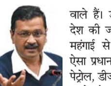
वाले हैं। उन्होंने कहा कि देश की जनता इस समय महंगाई से त्रस्त है। हमें ऐसा प्रधानमंत्री चाहिए जो पेट्रोल, डीजल के दाम कम करने के बारे में सोचे, लोगों के गैस के दाम कम करने के बारे में सोचे, दूध, सब्जियां, दाल सस्ता करे। लोगों को रोजगार देने के बारे में सोचे। मोदी रोजगार और महंगाई की बात ही नहीं करते हैं। केवल जेल में डालने के बारे में सोचते हैं। क्या ऐसे देश चलाएंगे? पिछले एक हफ्ते में पंजाब, हरियाणा, कुरुक्षेत्र, लखनऊ, महाराष्ट्र भिवंडी, मुंबई और जमशेदपुर गया। हर जगह लोग महंगाई से त्रस्त हैं। लोगों की नैकरियायें चली गईं, लोगों के पास रोजगार नहीं है। लोग बहुत ज्यादा नाराज हैं। आप नेता ने कहा कि प्रधानमंत्री जानते हैं कि वह हार रहे हैं इसलिए ये बुरी तरह से बौखलाए हुए हैं और अजीब-अजीब से भाषण दे रहे हैं।