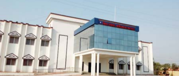
मनमाने रवेय्या के ही चलते होती है शासन प्रशासन की छवि खराब

अविलम्ब भुगतान नहीं होने पर धरना देने को होंगे मजबूर