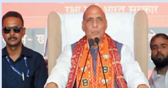
के साथ कहा कि भारत की अर्थव्यवस्था में उत्तर प्रदेश अपनी औद्योगिक नीतियों के चलते बड़ी भागीदारी कर रहा है श्री सिंह आज आजमगढ़ जिले की लालगंज लोकसभा के अतरीलिया विधानसभा क्षेत्र में एक चुनावी जनसभा को संबोधित कर रहे थे। रक्षा मंत्री राजनाथ सिंह ने बीच-बीच में भोजपुरिया अंदाज में अपने भाषणों के जरिए जनता को उत्साहित किया। उन्होंने कहा कि विपक्षी दलों में कांग्रेस का हथ सबका साथ छोड़ चुका है। साइकिल का चैन उतर चुका है और

रक्षा मंत्री राजनाथ सिंह ने कहा कि अब तक के रुझान से यह साफ हो चुका है कि प्रधानमंत्री नरेंद्र मोदी के नेतृत्व में राष्ट्रीय जनतांत्रिक गठबंधन की सरकार तीसरी बार सरकार बनाने जा रही है। छठे चरण के चुनाव प्रचार के अंतिम दिन यहां एक जनसभा में श्री सिंह ने कहा अभी तक जो जानकारी मिली है कि आने वाले परिणाम चौंकाने वाले होंगे। इस चुनाव में मोदी जी को 400 से अधिक सीटें सरकार बनाने के लिए मिलेंगी। उन्होंने कहा कि योगी आदित्यनाथ की सरकार के कार्यों के चलते उत्तर प्रदेश अब उत्सव प्रदेश बन गया है। यहां पर गुंडे बदमाशों के हैसले पूरी तरह से पस्त हो चुके हैं। बदमाश की हिम्मत नहीं है कि अपने सीने की बटन खोल कर आज उत्तर प्रदेश की सड़कों पर चल सके। देश की अर्थव्यवस्था के बारे में उन्होंने दावे