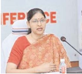
मोबाइल फोन, आईपैड, लैपटॉप, स्मार्ट वॉच, कैमरा, अन्य इलेक्ट्रॉनिक उपकरण प्रतिबंधित रहेगा। लेकिन मीडियाकर्मी मीडिया सेंटर तक मोबाइल ले जा सकते हैं। उन्होंने कहा कि मतगणना कार्य के अवलोकन हेतु मीडियाकर्मियों को 5-5 के समूह में एक बार अवलोकन कराया जाएगा।

राजनीतिक दलों के प्रतिनिधि व एजेंट की बैठक व्यवस्था, प्रवेश पास, सीसीटीवी कैमरा मॉनिटरिंग, सुरक्षा व्यवस्था एवं उद्घोषक स्थल का जायजा लिया। उन्होंने कक्ष कि सूचना एवं टेक्नोलॉजी का प्रयोग करते हुए दुर्ग लोकसभा क्षेत्र अंतर्गत आने वाले अन्य जिले के विधानसभा क्षेत्र की जानकारी गूगल लिंक के माध्यम से डेटा अपडेट होगा। उन्होंने दुर्ग संसदीय निर्वाचन क्षेत्र के समस्त मतदान केन्द्रों के मतदान का परिणाम समेकित करने के संबंध में आवश्यक दिशा-निर्देश दिए। मुख्य निर्वाचन पदाधिकारी ने जिले में मतगणना हेतु किए गए प्रबंध की प्रशंसा की। उन्होंने कक्ष कि मतगणना हॉल में