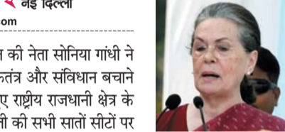
कहा मेरे प्यारे दिल्लीवासियों, यह एक बहुत महत्वपूर्ण चुनाव है। यह चुनाव देश के लोकतंत्र और संविधान को बचाने का चुनाव है। यह चुनाव बेरोजगारी, महंगाई, संवैधानिक

कांग्रेस संसदीय दल की नेता सोनिया गांधी ने इस चुनाव को लोकतंत्र और संविधान बचाने का चुनाव बताते हुए राष्ट्रीय राजधानी क्षेत्र के मतदाताओं से दिल्ली की सभी सीटों पर गठबंधन के उम्मीदवारों को जिताने की अपील की है। गांधी ने कहा कि संवैधानिक संस्थाओं पर आक्रमण हो रहा है और संविधान तथा लोकतंत्र को खत्म किया जा रहा है इसलिए