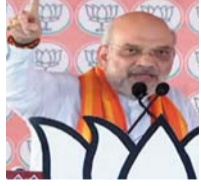
के पार हो चुके हैं जबकि अगले दो चरण में यह आंकड़ा आसानी से 400 के पार चला जायेगा। उन्होंने अपने चिरपरिचित अंदाज में इण्डिया समूह पर हमला बोलते