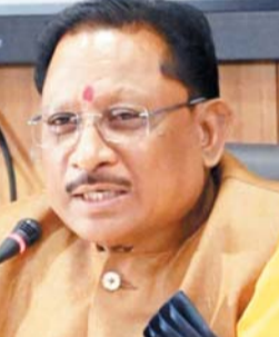
के लिए बड़ा फैसला है। साय ने कहा कि ये फैसले बताते हैं कि ममता बनर्जी की सरकार गैर-संवैधानिक तरीके से, तुष्टिकरण की नीति को आगे बढ़ा रही थी। इंडी गठबंधन केवल वोट बैंक की राजनीति के कारण लगातार आदिवासियों, पिछड़ों के हक पर डका डाल रही है। उनका अधिकार छीन कर मुसलमानों को देना चाहती है, इसकी जितनी निंदा की जाय वह कम है। उन्होंने कहा कि इससे भी अधिक

धर्म आधारित आरक्षण पर कलकत्ता उच्च न्यायालय का निर्णय खगोल योग्य है। यह धर्म आधारित वोटबैंक की राजनीति करने वालों, तुष्टिकरण की राजनीति करने वालों के मुंह पर तमाचा है। यह कहना है छत्तीसगढ़ के मुख्यमंत्री विष्णु देव साय का। उन्होंने कहा है कि कांग्रेस और इंडी गठबंधन लगातार संविधान की हत्या की साजिश कर रही है। हम सभी जानते हैं कि धर्म आधारित आरक्षण का भारतीय संविधान में कोई स्थान नहीं है। कल माननीय कलकत्ता उच्च न्यायालय का इससे संबंधित एक फैसला आया है जिसमें कोर्ट ने 2010 के बाद पश्चिम बंगाल में जारी किए गए सभी धर्म आधारित ओबीसी प्रमाणपत्रों को रद्द कर दिया है। यह देश के ओबीसी, आदिवासी और तमाम पिछड़े समाजों