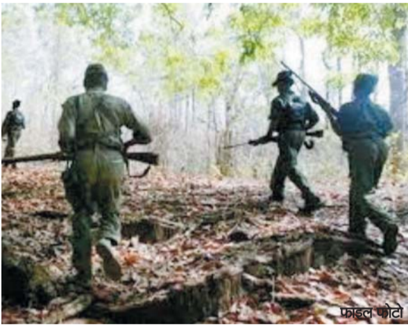
होने की संभावना जताई जा रही है। गिरफ्तारी भी की गई है। रेकावाया के जंगल में आठ सौ जवानों के द्वारा साथ ही कई नक्सलियों की

नारायणपुर और बीजापुर जिले के सीमावर्ती क्षेत्र में प्लाटून नंबर 16, और इंद्रावती एरिया कमिटी के नक्सलियों की सूचना पर नारायणपुर, दंतवाड़ा और बस्तर जिले के डीआरजी और बस्तर फाइटर्स के साथ एस्टीएफ की टीमों सच अभियान पर निकली थी। गुरुवार को दोपहर 11 बजे नक्सलियों ने सुरक्षा बलों पर गोलीबारी शुरू की। जिस पर दोनों तरफ से फायरिंग की गई। घटना स्थल से अब तक सात नक्सलियों के शव और हथियार बरामद हुए हैं। वहीं 10-12 नक्सलियों के घायल