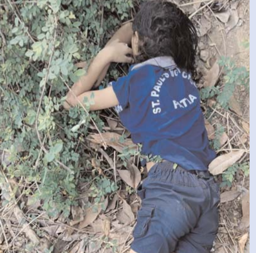
होते ही मृतका की शिनाख्त कबीर चौक पानी की गहराई 8 से 10 फीट है, संभवतः

रविवार की सुबह केलो नदी में एक नाबालिग बालिका का शव मिलने से पूरे क्षेत्र में सनसनी फैल गई। घटना की जानकारी मिलते ही पुलिस टीम मौके पर पहुंचकर शव को पोस्टमार्टम के लिये अस्पताल भेजते हुए आगे की कार्यवाई में जुट गई है। इस संबंध में मिली जानकारी के अनुसार चक्रधर नगर थाना क्षेत्र के अंतर्गत आने वाले खर्राघाट के पास केलो नदी में रविवार की सुबह नदी में एक अज्ञात बालिका का शव मिलने से पूरे क्षेत्र में सनसनी फैल गई और देखते ही देखते मौके पर लोगों की भारी भीड़ जुट गई। प्रारंभिक जांच के दौरान मृतका की शिनाख्त नहीं हो सकी थी लेकिन सोशल मीडिया में बालिका का फोटो वायरल