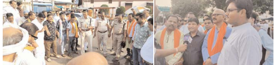
पायनियर संवाददाता < सक्ती www.dailypioneer.com