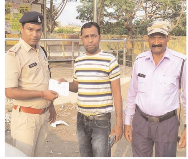
तीन सवारी, तेज गति में वाहन चलाने एवं शराब पीकर वाहन चलाने पाएँ जाने पर वाहन चालकों के विरुद्ध यातायात पुलिस ने की कार्यवाही