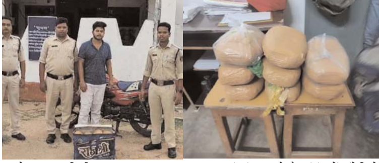
स्पलेण्डर क्र. सी.जी. 14 एम.एफ. 3607 में सवार होकर उक्त रास्ते में एक व्यक्ति को दबोचा गया जो एक गांजा तस्कर का था, जिसमें 8.140 किलोग्राम कीमती 81,400 रु का गांजा बरामद हुआ।