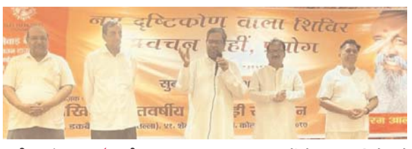
पायनियर संवाददाता < सक्ती www.dailypioneer.com