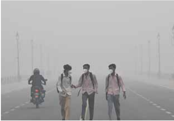
इंडिया गेट पर भारी धुंध के बीच मास्क लगाए जाते युवा।

● सोमवार को राष्ट्रीय राजधानी देश का सबसे प्रदूषित शहर रहा, एक्वआई 495 के हुआ पार