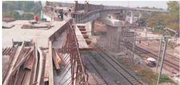
निर्माणधीन रूरा का रेलवे ओवरब्रिज

विकास व सुविधाओं की देरी जब लोगों के लिये मुसीबत व परेशानी का सबब बन जाये और आर्देश लोकतंत्र में जनसुविधाओं की लेटलतीफी से होने वाली परेशानियों की शिकायत पर शीर्ष प्रशासनिक अमला असंवेदनशीलता, अकर्मण्यता, लापरवाही व उदासीनता का परिचय दे तो लोगों का धीरज संस्कार व व्यवस्था से उठ जाता है। ऐसा ही उदाहरण जनपद के रूरा कस्बे में निर्माणधीन रेलवे उपरिगामो सेतु के निर्माण में देखने को मिल रहा है। एक वर्ष की कार्यविधि में निर्माण कार्य पूर्ण करने के विपरीत पाँच वर्ष बाद भी रूरा का आरओबी अपने निर्माण की कछुआ गति के कारण लोगों के गहरे आक्रोश