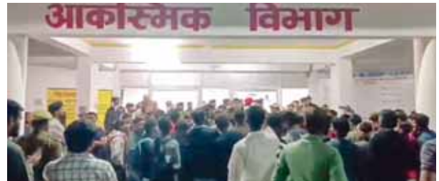
झांसी गिरे के महारानी लक्ष्मीबाई मेडिकल कॉलेज के नवजात गहन हिकिसा इकाई (एनआईसीयू) में आग लगने के बाद आपातकालीन बर्तक के बाहर जमा लोग

ग्रेप चरण चार के तहत लागू किए गए उपायों का अनुपालन करते हुए, दिल्ली यातायात पुलिस ने 15 और 17 नवंबर को प्रदूषण नियंत्रण प्रमाणपत्र न रखने पर क्रमशः कुल 4,852 चालान और 4,472 चालान काटे। इनमें 15 और 17 नवंबर को क्रमशः एंड ऑफ लाइफ न्हीकलस पर 138 और 155 चालान लगाए। पुलिस ने 15 नवंबर को 423 गैर-गंतव्य ट्रकों को भी डायवर्ट किया, जबकि 17 नवंबर को यह संख्या अधिक थी क्योंकि दिल्ली में ऐसे 545 ट्रकों को डायवर्ट किया गया था। उपायों का पालन करते हुए, पुलिस ने 15 नवंबर को 514 लाइट मोटर न्हीकलस (एलएमवी) (बीएस III पेट्रोल और बीएस IV डीजल) पर चालान भी लगाए। 17 नवंबर को यह संख्या लगभग 100 प्रतिशत बढ़ गई क्योंकि 1,130 ऐसे एलएमवी को चालान जारी किए गए। (शेष पृष्ठ 9)