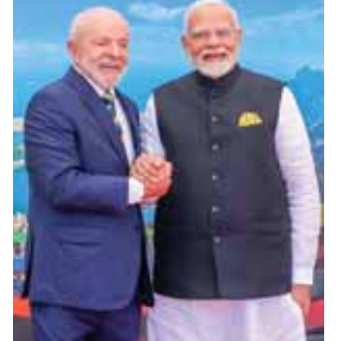
ब्राजील के रियो डी जेनेरियो में जी-20 शिखर सम्मेलन में भाग लेने के लिए प्रधानमंत्री नरेंद्र मोदी के पहुंचने पर ब्राजील के राष्ट्रपति लुइस इनासियो लूला दा सिल्वेरा द्वारा स्वागत किया गया।

प्रधानमंत्री नरेंद्र मोदी ने सोमवार को कहा कि वैश्विक संघर्षों के कारण खाद्य, ईंधन और उर्वरक संकट से ग्लोबल साउथ के देश सबसे अधिक प्रभावित हैं और जी-20 को इसे दूर करने पर ध्यान केंद्रित करना चाहिए। जी-20 शिखर सम्मेलन के एक सत्र को संबोधित करते हुए मोदी ने कहा कि भारत में पिछले साल आयोजित जी-20 का विषय एक पृथ्वी, एक परिवार, एक भविष्य इस शिखर सम्मेलन में भी उतना ही प्रासंगिक है जितना कि पिछले वर्ष था। उन्होंने कहा, मैं यह कहना चाहूंगा कि वैश्विक संघर्षों के कारण खाद्य, ईंधन और उर्वरक संकट से ग्लोबल साउथ के देश सबसे अधिक प्रभावित हैं। उन्होंने कहा, यह बहुत संतोष की बात है कि हमने एसडीजी (सतत विकास लक्ष्य) को प्राथमिकता दी। हमने समावेशी विकास, महिलाओं के नेतृत्व वाले विकास और युवा (शेष पृष्ठ 9)