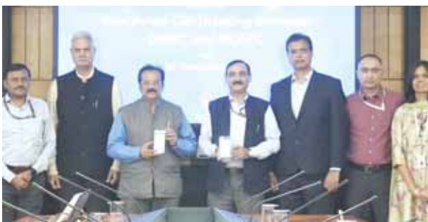
एनसीआरटीसी-डीएमआरसी के बीच समझौता ज्ञापन पर हस्ताक्षर के साथ अधिकारी।

यात्री अब नमो भारत और मेट्रो के लिए एक साथ टिकट बुक कर सकेंगे। एनसीआरटीसी और डीएमआरसी का एकीकृत क्यूआर-टिकटिंग सिस्टम लॉन्च हुआ है। राष्ट्रीय राजधानी क्षेत्र परिवहन निगम और दिल्ली की मेट्रो रेल कॉर्पोरेशन ने सोमवार को एकीकृत क्यूआर-टिकटिंग सिस्टम को आधिकारिक तौर पर जारी किया है। यह पहल पीएम राष्ट्रीय गति शक्ति मास्टर प्लान के अनुरूप भी है, जिसका उद्देश्य परिवहन साधनों के बीच बुनियादी ढांचे का एकीकरण और निर्बाध कनेक्टिविटी को बढ़ावा देना है। केंद्र सरकार की वन इंडिया-वन टिकट पहल के अनुरूप यह योजना है