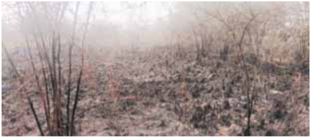
आग से जले हुए पेड़

संडीला (हरदोई)। वन विभाग द्वारा भगवान भरोसे छोड़े गए वन्य क्षेत्र में आग लगने से बड़ी संख्या में जहां पेड़ जल गए वहीं कई जीव जंतु भी इस आग से जलकर मर गए। प्रास जानकारी के अनुसार ग्राम सेमराखेड़ा मजरे ककराली स्थित वन विभाग के वन क्षेत्र में शाम के समय आग लग गयी। लोगों का कहना है कि यह आग रातभर जलती रही। कई लोगों ने इसकी जानकारी वन विभाग के जिम्मेदारों को फ़ोन पर दी लेकिन उनके कानों पर जूँ नहीं रेंगी। दूसरी ओर इस आग के कारण बड़ी संख्या में पेड़े जल गए जिनको विभाग द्वारा 4.5 साल पूर्व लगवाया गया था।