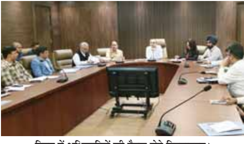
निगम में अधिकारियों की बैठक लेते निगमायुक्त।