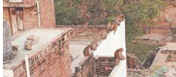
घरों पर बैठे हुए बंदर