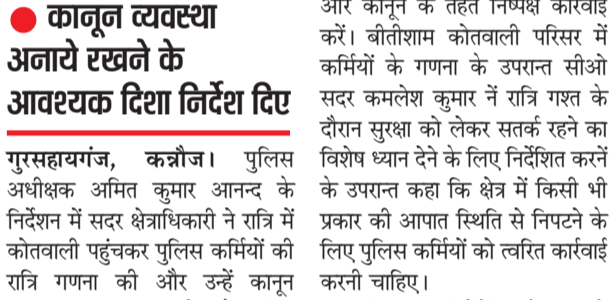
कोतवाली में पुलिस कर्मियों की रात्रि गणना करते सीओ।

सीओ ने कोतवाली के पुलिस कर्मियों की रात्रि गणना की