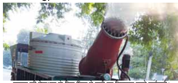
प्रदूषण को रोकथाम के लिए टैंकर से पानी का छिड़काव करते कर्मचारी।