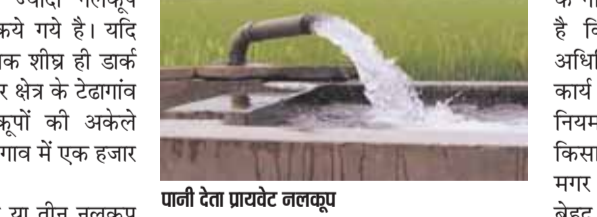
पानी देता प्रायवेट नलकूप