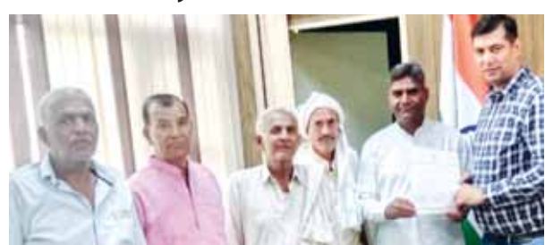
एसडीएम को खाद की कमी व कालाबाजारी के संबंध में ज्ञापन सौंपते किसान।