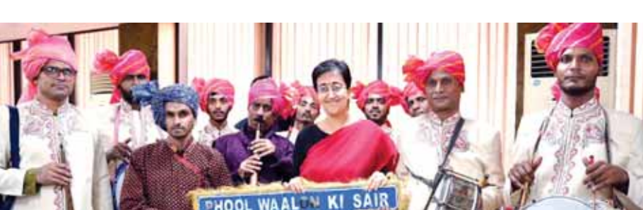
मुख्यमंत्री आतिशी को फूलों वाली सैर का पारंपरिक प्रतीक चिह्न सौंपते शहनाईवादक।

संस्कृति और एकता के परिचायक फूल वालों की सैर उत्सव का शुरु हो गया है। आयोजकों के सीएम आतिशी को उत्सव का प्रतीक पारंपरिक पंखा भेंट कर सात दिवसीय फूल वालों की सैर 2024 उत्सव की शुरुआत की। इस मौके पर आयोजक शहनाईवादकों के साथ सचिवालय