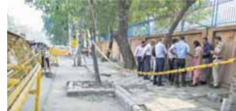
नई दिल्ली के रोहिणी इलाके में सीआरपीएफ स्कूल के पास रविवार को हुए हम धमाके बाद घटनास्थल की जांच करती एनआईए और दिल्ली पुलिस के अधिकारी।

अपने क्षेत्रों में सैनिकों और हथियारों को इकट्ठा किया। वास्तव में, भारत कोई भी जोरिखम नहीं उठाना चाहता था, इसलिए उसने एलएसी पर सर्दियों के महीनों में भी अपने सैनिकों को तैनात किया। पहले, सैनिक सर्दियों के दौरान अपने ठिकानों पर वापस चले जाते थे। एक समय ऐसा था जब दोनों पक्षों के 50,000 से अधिक सैनिक एलएसी पर टकराव वाले बिंदुओं पर आगने-सामने थे। स्थिति को देखते हुए, गतिरोध से पहले मौजूद गश्त के अधिकारों को बहाली की सुविधा प्रदान करता है या नहीं। मई 2020 में पूर्वी लद्दाख में एलएसी पर तनाव बढ़ गया था जब चीन ने सीमा पर यथस्थिति को बदलने की एकरतफा कोशिश की थी। इसके कारण उस साल 15 जून को गलवान में दोनों सेनाओं के सैनिकों के बीच बड़ी झड़प हुई थी। इस झड़प में कर्मांडिंग ऑफिसर सहित 20 भारतीय सैन्यकर्मियों मारे गए थे, जबकि 40 से अधिक चीनी सैनिक भी मारे गए थे। इसके बाद दोनों पक्षों ने एलएसी के अपने-