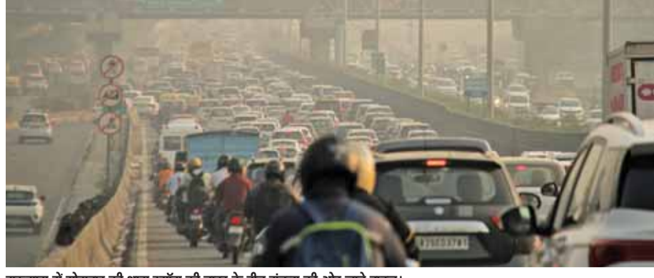
गुरुग्राम में सोमवार की शाम एग्युटि दिवस के बीच गंतव्य की ओर जाते वाहन।

मेट्रो, दिल्ली जल बोर्ड और भारतीय राष्ट्रीय राजमार्ग प्राधिकरण (एनएचएआई) जैसी एजेंसियों द्वारा चल रहे निर्माण कार्यों ने भीड़भाड़ की समस्या को और बढ़ा दिया, जिससे सुबह के समय रोजाना ऑफिस जाने वालों को असुविधा हुई और वायु प्रदूषण बिगड़ गया। महरीली-बदरपुर रोड, महरीली-गुरुग्राम रोड, नेताजी सुभाष मार्ग, वजौराबाद रोड, राजा गार्डन रोड, कस्मीरी गेट आईएसबीटी, सदर बाजार, चिराग दिल्ली, सरोजिनी नगर, चांदनी चौक, लाजपत नगर, कमला नगर सहित प्रमुख बाजारों के