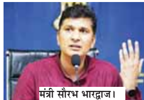
मंत्री सौरभ भारद्वाज।

आप नेता सौरभ भारद्वाज ने कहा कि केंद्र सरकार दिल्ली में कानून-व्यवस्था को संभालने में असमर्थ रही है। उन्होंने दावा किया कि शहर में कई गिरोह सक्रिय हैं, जो शहर के लोगों को निशाना बना रहे हैं। भारद्वाज ने पिछले 10 वर्षों में दिल्ली में कानून-व्यवस्था को बेहतर बनाने के लिए केंद्र सरकार द्वारा उठाए गए कदमों का निरर्थकता पर प्रश्न करने की भाजपा से मांग की। उन्होंने सवाल किया,