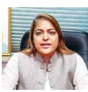
महापौर शैली ओबराय

खत्म करना है और उसके बाद मच्छर जनित सभी तरह की बीमारियों की रोकथाम की जायेगी। पिछले 2-3 महीनों में मच्छरजनित बीमारियों की रोकथाम के लिए कई स्तरों पर जागरूकता कार्यक्रम चलाए जा रहे हैं जैसे स्कूलों में बच्चों को जागरूक किया जा रहा है और आरडब्ल्यू के साथ बैठकें भी की जा रही हैं। मेयर ने कहा कि इसी कड़ी में दिल्ली में पहली बार ड्रोन के माध्यम से मच्छररोधी दवा का छिड़काव किया जा रहा है।