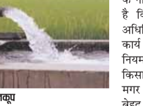
पानी देता प्रायवेट नलकूप