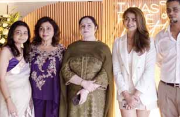
डीएलएफ फेज-1 में बॉडीक्राफ्ट क्लिनिक एंड सैलून को लांचिंग पर मौजूद अतिथि।