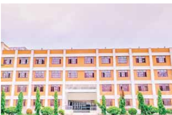
सीमापुरी में विश्वामित्र संवोदय कन्या विद्यालय के दो अकादमिक ब्लॉक के उद्घाटन के अवसर पर शिक्षा मंत्री आतिशी एवं विधानसभा अध्यक्ष रामनिवास गोयल।

● सीमापुर में छह प्रयोगशाला और दो पुस्तकालय और लिफ्ट लैस है शिक्षा का मंदिर