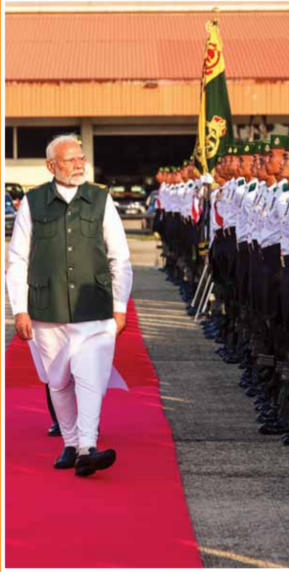
ब्लूनेई में प्रधानमंत्री नरेंद्र मोदी का समारोहपूर्ण स्वागत किया गया।