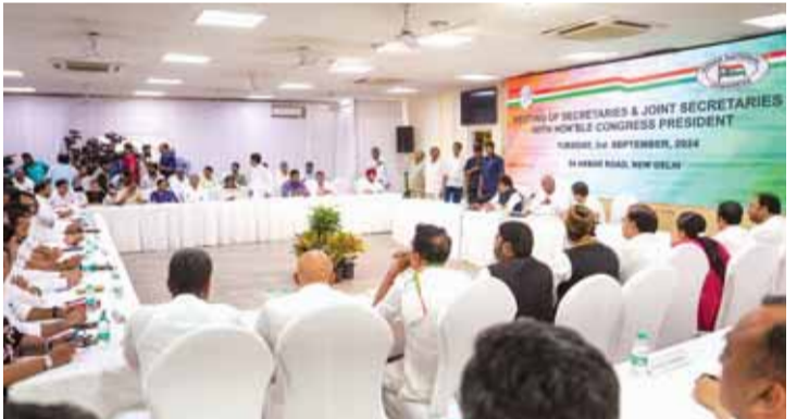
नई दिल्ली में मंगलवार को पार्टी सदस्यों और संयुक्त सदस्यों की बैठक में लोकसभा में नेता प्रतिपक्ष और कांग्रेस सांसद राहुल गांधी के अध्यक्ष कलिकर्णुन खड्गे तथा पार्टी सांसद केसी वेणुगोपाल के साथ।