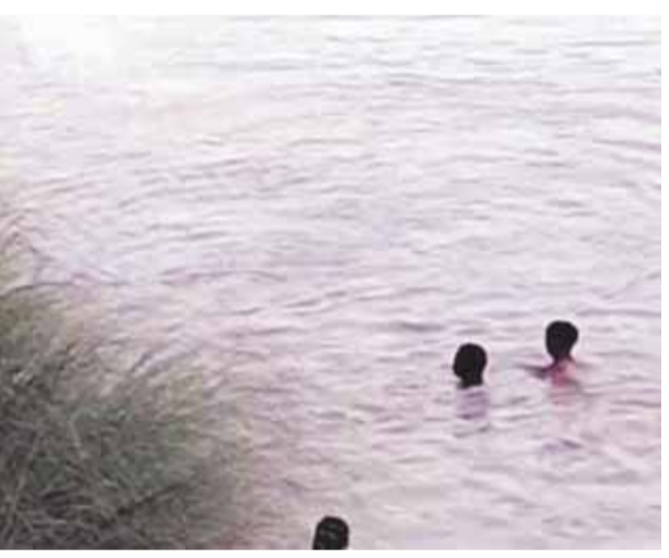
काली नदी में बालकी खोजबीन करते गोताखोर।