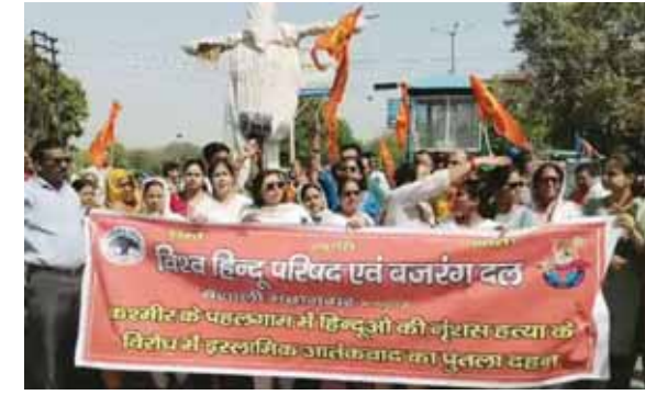
आक्रोश देखने को मिला। इस दौरान सड़क पर जाम जैसी स्थिति बन गई। लोग इस आतंकी हमले से भावुक हैं, शहीद हुए उन लोगों को भी श्रद्धांजलि अर्पित की। कहा कि

दूसरे दिन भी गाजियाबाद में आतंकवाद का पुतला जलाया गया विश्व हिंदू परिषद बजरंग दल ने इंदिरापुरम क्षेत्र के बुद्ध चौक पर खड़े होकर आतंकवाद के पुतले में पहले लात बरसाई। फिर पुतला फूँका और पाकिस्तान मुद्राबंद के नारे लगाए। विहिप का कहना है कि भारत सरकार को इन आतंकी हमलों का जवाब देना होगा। जिसको लेकर लोगों में काफी