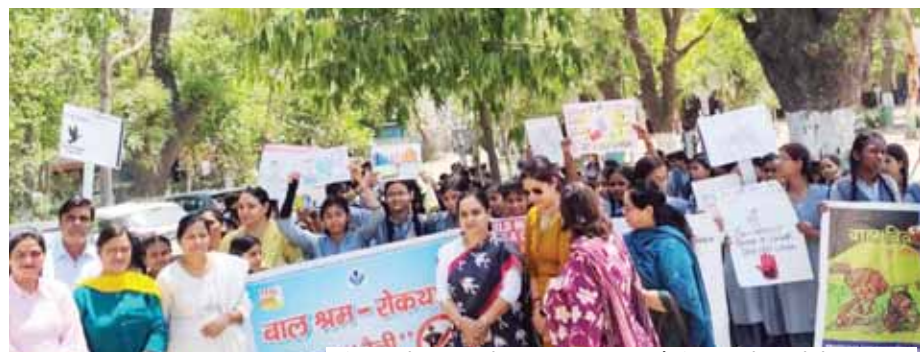
फरीदाबाद में बालश्रम के खिलाफ जागरूकता रैली निकालते स्कूलों के छात्र।

1, मेट्रो मो? से निकाली गयी। इस रैली में लगभग 300 स्कूली छात्राओं ने हाथों में तखती व बैनर लेकर नारे लगाते हुए बाल संरक्षण इकाई कार्यालय तक रैली निकली। छात्राओं ने बाल श्रम के खिलाफ नारे लगाए कि बाल श्रम बंद करो शिक्षा का अधिकार दो, हाथों में औजार नहीं