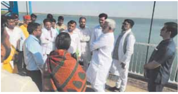
वर्षा करते जल शक्ति मंत्री

राठ (हमीरपुर)। मंगलवार को क्षेत्र के मौदहा बांध में जल शक्ति विभाग के मंत्री स्वतंत्र देव से मौदहा बांध परियोजना का निरीक्षण किया। निरीक्षण के दौरान खामियां मिलने पर जल मंत्री ने नाराजगी जताई। जल्द ही खामियों को दूर करने के लिए निर्देशित किया। जल मंत्री ने बताया कि मौदहा डैम हमारे लिए महत्वपूर्ण है। आस पास के क्षेत्रों में सिंचाई के लिए पीने के लिए पानी मिले। डैम की क्षमता भी ठीक है। इससे किसानों को सिंचाई का साधन मिल रहा है। हमीरपुर विधानसभा को यहाँ से अधिक पानी मिलता है। राठ की समस्या है। समस्या को लेकर विधायक मनोभा अनुरागी ने लिफ्ट केनाल की बात की है। जिससे 15.16 गांवों के किसानों को पानी मिल सके। कहा कि परियोजना बन रही है। भविष्य में किसानों को पंशानी नहीं होगी। नामाभि गंगे परियोजना पर कहा कि कार्य आगे बढ़ा दिया गया है। हमीरपुर महोबा में 95 फीसदी कार्य पूरा हो चुका है। कहा कि कहीं पाइप लीकेज सड़कों का हो सकता है। जो जल्द पूरा कराएंगे।