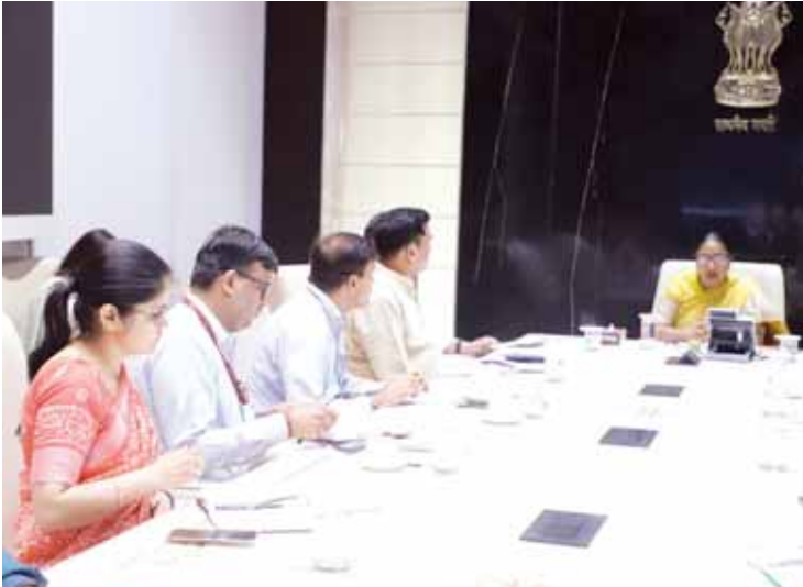
आरोग्य मंदिर निर्माण और वय वंदना योजना को लेकर उच्चस्तरीय बैठक करती सीएम रेखा गुप्ता।

रेखा ने मंगलवार को सचिवालय ने आयुष्मान आरोग्य मंदिर के निर्माण और वय वंदना योजना के प्रभावशाली और समग्र मठ को लेकर स्वास्थ्य विभाग के वरिष्ठ