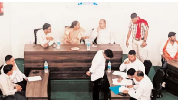
पायनियर संवाददाता < कुम्हारी www.dailypioneer.com

नयी सरकार भाजपा ने नगर में हुए निकाय चुनाव में अध्यक्ष पद पर जीत प्राप्त कर भाजपा का विजय ध्वज लहराया। निकाय चुनाव के पश्चात् सर्वप्रथम नगरपालिका के कोष को सक्षम बनाने की दिशा में अपने कदम बढ़ाते हुए दैनिक सब्जी मंडी स्थित वाहन एवं मोटर साइकिल स्टैंड की नीलामी आयोजित की गई। उक्त नीलामी में