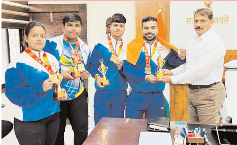
पायनियर संवाददाता < कवर्था www.dailypioneer.com

छत्तीसगढ़ के लालों ने नेपाल में रचा इतिहास, कलेक्टर वर्मा ने किया सम्मान, खिलाड़ियों के जज्बे को सराहा