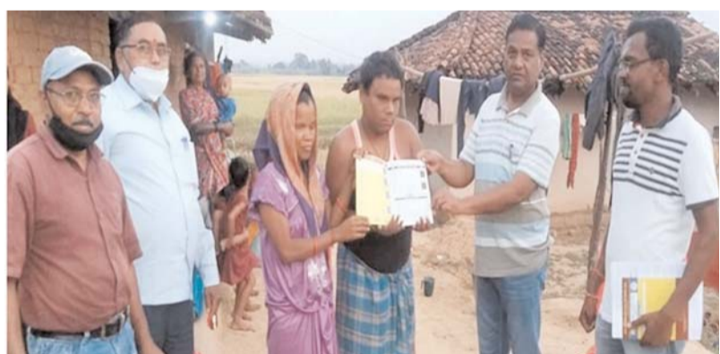
पायनियर संवाददाता < सूरजपुर www.dailypioneer.com

महात्मा गांधी राष्ट्रीय ग्रामीण रोजगार गारंटी योजना बनी दिव्यांग दंपति का सहारा। यह कहानी ग्राम पंचायत खजुरी जनपद पंचायत प्रतापपुर जिला सूरजपुर के दिव्यांग पति व पत्नी की है। जो जन्म से ही आंखों की रोशनी खो चुके हैं विवाह के बाद जीवन यापन में आई आर्थिक तंगी मे मनरेगा योजना सहारा बना है। जन्म से ही इस दिव्यांगता के अधिशाप को ढोकर चल रहे दंपति के सामने