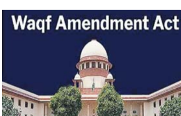
Waqf Amendment Act

उच्चतम न्यायालय ने वक्फ संशोधन अधिनियम 2025 को चुनौती देने वाली याचिकाओं पर सुनवाई करते हुए कहा कि मौजूदा वक्फ में अगली सुनवाई तक कोई बदलाव नहीं होने चाहिए। न्यायालय मामले की अगली सुनवाई पांच मई को करेगा। मुख्य न्यायाधीश संजीव खन्ना और न्यायमूर्ति संजय कुमार तथा न्यायमूर्ति के.वी. विश्वनाथन की पीठ ने केंद्र सरकार की ओर से पेश सॉलिसिटर जनरल तुषार मेहता की दलीलें सुनने के बाद कहा, हम नहीं चाहते कि स्थिति बदले। पांच साल (इस्लाम का अभ्यास) जैसे प्रावधान हैं, जिन पर हम रोक नहीं लगा रहे हैं। पीठ के समक्ष मेहता ने निवेदन करते हुए कहा कि केंद्र सरकार सात दिन के भीतर जवाब दाखिल करेगी और अगली तारीख तक परिषद या बोर्ड में कोई निरुक्ति नहीं होगी। उन्होंने यह भी कहा कि अगली तारीख तक