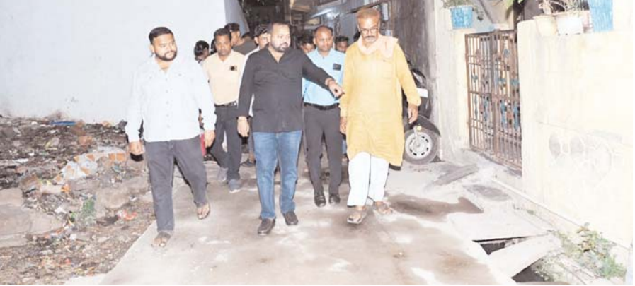
पायनियर संवाददाता < बेमेतरा www.dailypioneer.com

जल संकट और सफाई व्यवस्था पर नगर पालिका अधिकारियों को दिए त्वरित निर्देश