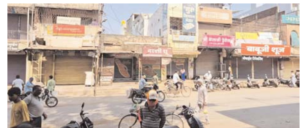
पायनियर संवाददाता < दल्लौराजहरा www.dailypioneer.com

जम्मू-कश्मीर के पहलगाम में हुए आतंकी हमले के विरोध में 25 अप्रैल को दल्लौराजहरा शहर पूरी तरह बंद रहा। सुबह से ही बाजारों के शटर गिरे रहे तथा सड़कों पर सनाटा पसर रहा। होटल, सब्जी मंडी, पेट्रोल पंप, चाय दुकानें सब कुछ बंद रही। राजहरा व्यापारी संघ व अनाज किराना व्यापारी संघ ने इस बंद का आह्वान किया था। इस दिन शाम 7 बजे अटल योग सदन से मौन जुलूस निकाला गया। यह जुलूस नगर के जैन भवन चौक, श्रमवीर चौक, फव्वारा चौक से मुख्य मार्गों से होते हुए वापस गुसा चौक पहुंचा। वहां पाकिस्तान और