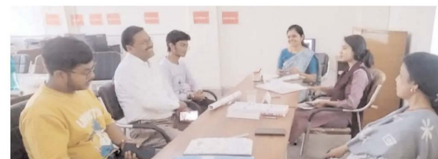
पायनियर संवाददाता < उरई www.dailypioneer.com

शैलदेवी महाविद्यालय अंडा दुर्ग में पैरेंट्स-टीचर मीटिंग का आयोजन किया गया। पैरेंट्स-टीचर मीटिंग के आयोजन हेतु अभिभावकों को महाविद्यालय में आमंत्रित कर विद्यार्थियों के संबंध में चर्चा की गई। वर्तमान परिदृश्य में विद्यार्थियों के सर्वांगीण विकास हेतु टीचर एवं अभिभावकों के मध्य सहयोग एवं सामंजस्य स्थापित करना अत्यंत आवश्यक होता जा रहा है, जिससे न केवल विद्यार्थियों की प्रगति का आंकलन हो सके अपितु विद्यार्थियों के दृष्टिकोण एवं उनकी क्षमता को समझा जा सके। इस बैठक में अभिभावकों को छात्रों की शिक्षा तथा उनकी शैक्षणिक विकास से अवगत कराया गया। अभिभावकों के साथ छात्रों के व्यवहार एवं उनके क्रियाकलापों पर चर्चा की गई तथा उनकी क्षमता तथा