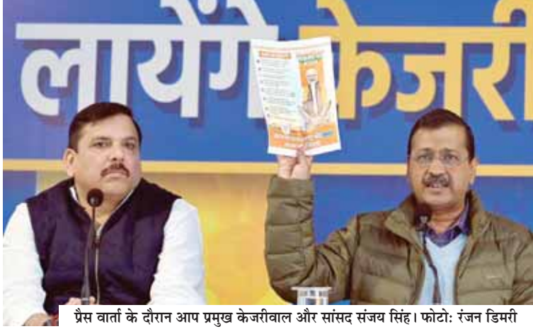
प्रेस वार्ता के दौरान आप प्रमुख केजरीवाल और सांसद संजय सिंह।

भाजपा चुनाव के बाद गरीबों, मजदूरों और झुग्गीवासियों के लिए रावण से भी बड़ा खतरा साबित होगी : आप प्रमुख