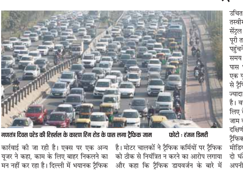
गणतंत्र दिवस परेड की रिहर्सल के कारण रिंग रोड के पास लाग ट्रैफिक जाम

उचित जानकारी नहीं थी। ऑनलाइन मैप की तस्वीर शेयर करने वाले एक यूजर ने कहा, सेंट्रल दिल्ली की ओर जाने वाली सभी सड़कें पूरी तरह से जाम हैं। लोगों को अपने गंतव्य तक पहुंचने के लिए सड़क पर एक घंटे से अधिक समय तक इंतजार करना पड़ा। कर्तव्य पथ के पास भारी ट्रैफिक की तस्वीर पोस्ट करते हुए एक यूजर ने लिखा, क्या दिल्ली ट्रैफिक पुलिस से ट्रैफिक को मैनेज करने के लिए कहना बहुत ज्यादा है। पूरी सेंट्रल दिल्ली जाम में फंसी हुई है। वहीं कुछ यूजर्स ने बताया कि वे काम के लिए देर से जा रहे थे या दिल्ली की सड़कों पर जाम की वजह से काम पर नहीं जाना चाहते थे। दक्षिणी दिल्ली के कई इलाकों में भी भारी ट्रैफिक जाम की खबर है। एक यात्री ने सोशल मीडिया पर पोस्ट किया कि वे एमवी रोड पर दो घंटे तक ट्रैफिक जाम में फंसे रहे। रोजाना अपनी कार से ऑफिस जाने (शेष पृष्ठ 9)