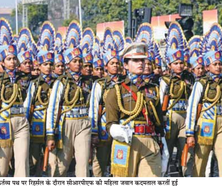
कर्तव्य पथ पर विहसल के दौरान सीआरपीएफ की महिला जवान कदमताल करती हुईं

पीठ ने कहा कि कानूनी प्रावधान आयोग को इलेक्ट्रॉनिक मशीनों का इस्तेमाल वोट दर्ज करने की अनुमति देने के लिए करते हैं और जिन निर्वाचन क्षेत्रों में इस तरह की ईवीएम को अपनाया जरूरी है, उसे भी आयोग द्वारा निर्दिष्ट किया जाता है।