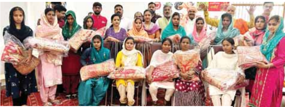
सामूहिक विवाह के लिए पंजीकृत बेटियों को शादी के जोड़े भेंट करते स्वास्तिक फाउंडेशन के सदस्य।

16 जोड़ों का पंजीकरण किया गया है। सरकार की ओर से बेटियों की निर्धारित उम्र 18 वर्ष लड़कों की 21 वर्ष होने के दस्तावेजों को पंजीकरण के लिए जमा कराया गया है। एक फरवरी 2004 से पहले के जन्में