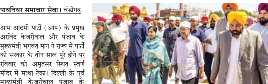
अमृतसर स्थित स्वर्ण मंदिर में पत्नी के साथ मत्था टेकने पहुंचे अरविंद केजरीवाल।