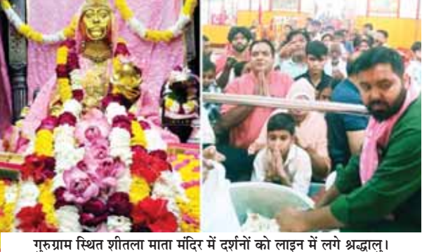
गुरुग्राम स्थित शीतला माता मंदिर में दर्शनों को लाइन में लगे श्रद्धालु।

मंदिर का निर्माण चल रहा है। जिसके कारण श्रद्धालुओं को कोई परेशानी न हो, इसकी भी पूरी व्यवस्था की गई है। श्रद्धालुओं के दर्शन के लिए भी पूरी व्यवस्था कर दी गई है। मंदिर