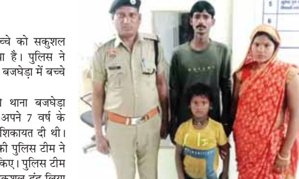
गुम हुए बच्चे को तलाशकर परिजनों को सौंपते पुलिसकर्मी।

का ध्यान रखने के संबंध में हिदायत दी गई। बच्चे के माता-पिता ने अपने बच्चे को सकुशल पाकर गुरुग्राम पुलिस का धन्यवाद किया।