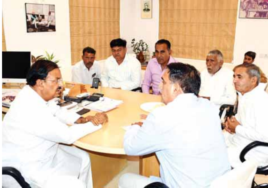
नोएडा डेवपॉर्पल पर क्षेत्र के लोगों की समस्याओं को निवारण करते सांसद महेश शर्मा।