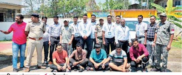
पायनियर संवाददाता < कोंडागांव www.dailypioneer.com

कोंडागांव पुलिस ने एक प्रेस विज्ञापि जारी कर बताया कि, उन्होंने इनकम टैक्स ऑफिसर बनकर लूट की घटना को अंजाम देने वाले 5 आरोपियों को गिरफ्तार कर लिया है। पुलिस ने बताया कि, गिरफ्तार किए गए आरोपियों में से एक गांव का ही रहने वाला है और वह इस घटना का मास्टरमाइंड है। पुलिस ने यह भी बताया मुख्य आरोपी पहले भी कई लोगों को नौकरी लगाने के नाम पर धोखाधड़ी कर चुका है। पुलिस ने आरोपियों के पास से लूट की रकम और घटना में प्रयुक्त वाहन को भी