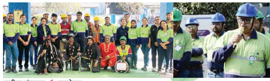
पायनियर संवाददाता < बालकोनगर www.dailypioneer.com

वेदांता समूह की कंपनी भारत एल्यूमिनियम कंपनी लिमिटेड (बालको) ने कर्मचारियों, व्यावसायिक साझेदार और समुदाय के साथ 54वां राष्ट्रीय सुरक्षा सप्ताह मनाया। सुरक्षा संस्कृति को बढ़ावा देने के उद्देश्य से विभिन्न जागरूकता कार्यक्रम आयोजित किये गए। इस वर्ष की थीम 'विकसित भारत के लिए सुरक्षा और कल्याण महत्वपूर्ण' के तहत बालको ने सभी स्तरों पर सुरक्षा व्यवहार को सुदृढ़ करने के लिए सुरक्षा रैली, सुरक्षा सत्र, सेफ्टी मैराथन और नुकड़ नाटक सहित