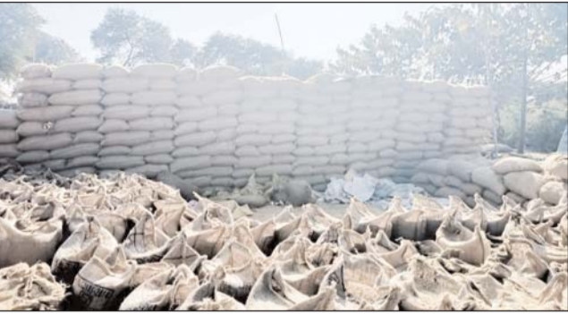
पायनियर संवाददाता < कवर्धा www.dailypioneer.com

सरकार के द्वारा किसानों के धान को समर्थन मूल्य पर खरीदी किया जाता है जिसके लिए कबीरधाम जिले में सी से अधिक उपार्जन केंद्र बनाए गए हैं। धान की खरीदी का समय पूर्ण होने के पश्चात् अधिकारियों ने उपार्जन केंद्रों में खरीदे गए धान का टीम बनाकर भौतिक सत्यापन किया गया तो पंडरिया विकासखंड के और सराईसेत में लाखों की धान गायब मिला। उसके भरपाई के लिए प्रबंधक को नोटिस जारी किया गया है लेकिन उसका जवाब देना भी उचित नहीं समझ रहे हैं।