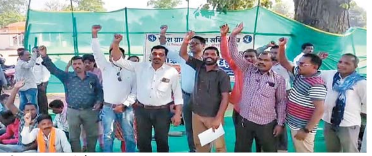
पायनियर संवाददाता < कोंडागांव www.dailypioneer.com

प्रदेश पंचायत सचिव संघ के आह्वान पर कोण्डागांव जिला के समस्त ग्राम पंचायत सचिव अपनी मांगों को लेकर अनिश्चितकालीन हड़ताल पर बैठे हैं जिसका 9वां दिन है। आपको बता दें कि, ग्राम पंचायत सचिव संघ के द्वारा कोंडागांव जिले के पांचों ब्लॉक के ग्राम पंचायत सचिव सहित पदाधिकारियों ने निर्घण लिया गया कि, 17 मार्च से अपने अपने ब्लॉक मुख्यालय में