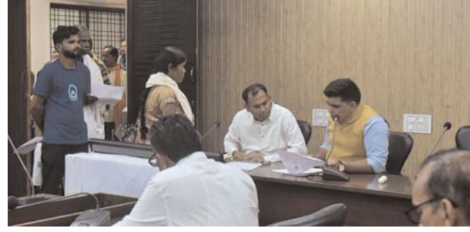
पायनियर संवाददाता < कोंडागांव www.dailypioneer.com

कलेक्टर कुणाल दुदावत ने जिला कार्यालय के सभाकक्ष में आयोजित आज साप्ताहिक जनदर्शन में जिले के नागरिकों की समस्याएं सुनीं और संबंधित विभाग के अधिकारियों को त्वरित निराकरण के निर्देश दिए। कलेक्टर के सभ्य मूलनार गांव के ग्रामीणों ने दूरसंचार सुविधा नहीं होने से ग्रामवासियों को हो रही परेशानियों से अवगत कराते हुए मोबाइल टावर लगाने की मांग की। साथ ही उन्होंने गांव में निर्माणाधीन उप स्वास्थ्य केन्द्र को जल्द पूर्ण कराने की भी मांग की। ग्राम मोहनबेड़ा के ग्रामीणों ने वन भूमि में अतिक्रमण को