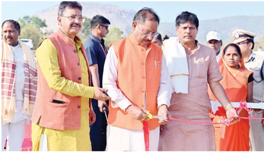
पायनियर संवाददाता < जशपुरनगर www.dailypioneer.com

आध्यात्मिक एवं सांस्कृतिक, प्राकृतिक एवं वन्य जीव, साहसिक पर्यटन सर्किट से जिले के पर्यटन को मिलेगा प्रोत्साहन