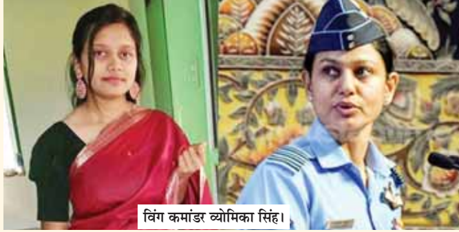
विंग कमांडर व्योमिका सिंह।

वर्ष 2017 में प्रमोशन मिलने के बाद व्योमिका सिंह को विंग कमांडर का पद मिला। इसके दो साल बाद वर्ष 2019 में उन्हें फ्लाईंग ब्रांच में स्थायी कमीशन दिया