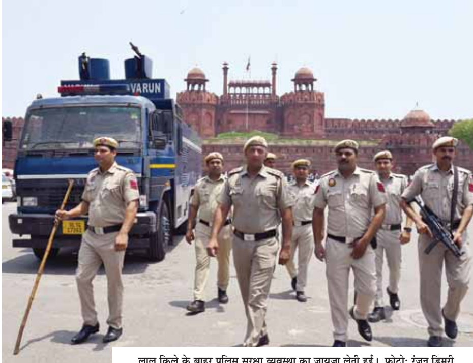
लाल किले के बाहर पुलिस सुरक्षा व्यवस्था का जायजा लेती हुई।

बढ़ते तनाव के बीच बृहस्पतिवार रात दिल्ली पुलिस के सभी कर्मियों की छुट्टियां रद्द कर दी गईं। एक अधिकारी ने बताया, रात्रिकालीन चौकसी बढ़ा दी गई है। हम हर संवेदनशील क्षेत्र में अतिरिक्त सुरक्षा बढ़ाते रह रहे हैं। पुलिस सूत्र ने कहा, सभी पुलिस उपायुक्त अपने-अपने क्षेत्रों में कानून-व्यवस्था की सक्रियता से निगरानी कर रहे हैं। दिल्ली पुलिस किसी भी तरह की स्थिति से निपटने के लिए तैयार है। पुलिस ने बताया कि दिल्ली में आने वाले हर वाहन की जांच की जा रही है। कई जगह बम निरोधक दस्तों ने तलाशी अभियान भी शुरू किया है।