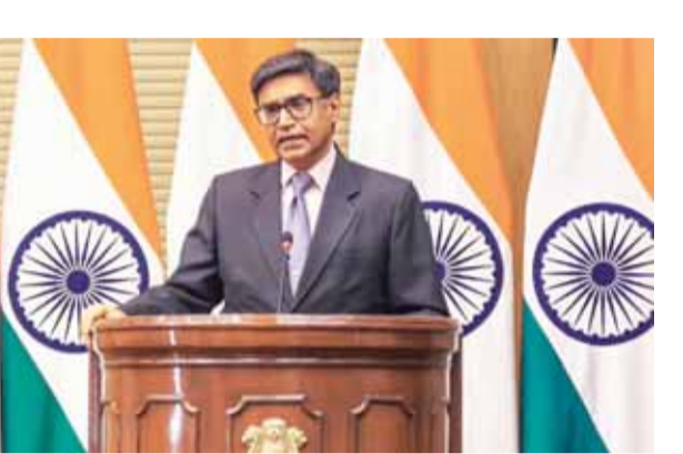
प्रेस वार्ता को संबोधित करते विदेश सचिव विवेक मिश्री।