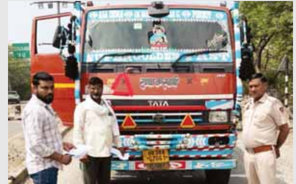
डंपर की चैकिंग के दौरान खनन विभाग की टीम।

अवैध खनन पर शिकंजा, चेकिंग के दौरान 2 ट्रक जब्त फरीदाबाद। हरियाणा सरकार अवैध खनन के खिलाफ कड़े कदम उठा रही है और खनन विभाग लगातार इस पर नजर बनाए हुए है। विभाग के महानिदेशक के.एम. पांडुरंग खुद खनन विभाग की गतिविधियों पर मॉनिटरिंग कर रहे हैं और जरूरी दिशा-निर्देश जारी कर रहे हैं। सरकार का मुख्य लक्ष्य खनन प्रक्रिया को पूरी तरह पारदर्शी बनाना और अवैध खनन को जड़ से खत्म करना है। जिला खनिज अधिकारी कमलेश बिधलान ने बताया कि विभागीय चेकिंग के तहत गत दिवस टीम ने 2 ट्रक खनिज वाहन को बिना ई-रवाना बिल के को रोकते हुए कागजों की जांच की जिसमें उनके पास कोई बिल नहीं मिले। कमलेश बिधलान ने बताया कि दोनों खनिज वाहनों को सम्बंधित पुलिस स्टेशन में निर्धारित नियमों के तहत जब्त कर लिया गया है। उन्होंने बताया कि हरियाणा सरकार अवैध खनन पर रोक लगाने के लिए पूरी तरह से प्रतिबद्ध है और विभागीय स्तर पर निरंतर निगरानी रख रहे हैं। उन्होंने कहा कि महानिदेशक पांडुरंग व डीसी विक्रम सिंह के दिशा निर्देशों अनुरूप जिला प्रशासन ने स्पष्ट किया है कि अवैध खनन को रोकने के लिए निरन्तर सख्त अभियान जारी रहेगा। इसके तहत जिले के विभिन्न क्षेत्रों में औचक निरीक्षण किए जा रहे हैं और दोषियों पर कठोर कार्रवाई की जा रही है। इस अभियान का मुख्य उद्देश्य खनन गतिविधियों को पारदर्शी बनाना और प्राकृतिक संसाधनों के अनियमित दोहन को रोकना है। हरियाणा सरकार का संकल्प है कि राज्य में अवैध खनन किसी भी स्थिति में बर्दाश्त नहीं किया जाएगा और इसके लिए जिम्मेदार लोगों पर कड़ी कानूनी कार्रवाई होगी।