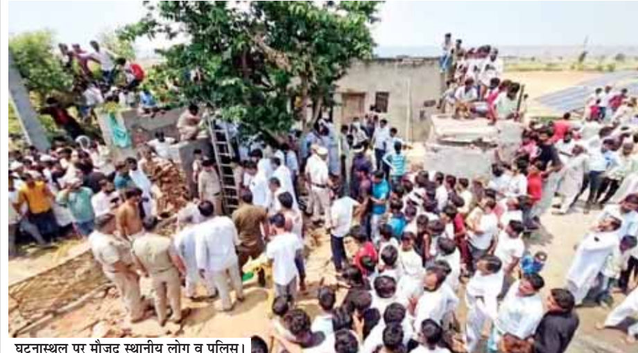
घटनास्थल पर मौजूद स्थानीय लोग व पुलिस।

टॉयलेट्स निर्माण की जांच करने के लिए निर्देश: पर्यावरण मंत्री ने बैठक में कहा कि नगर निगम गुरुग्राम तथा मानेसर में जो पब्लिक टॉयलेट्स बनाए गए हैं। वे इस्तेमाल में ना होने व सफाई व्यवस्था ठीक ना होने के चलते काफी खराब स्थिति में हैं। राव ने कहा कि जलदा के टेक्स के पैसे की इस तरह बर्बादी किसी भी रूप में स्वीकार्य नहीं है। उन्होंने इस पूरे कार्य की जांच के निर्देश देते हुए कहा कि निगम अधिकारी जगह चिन्हित कर इसके रखरखाव के लिए प्राइवेट फर्म को आमंत्रित करें ताकि आमजन को इस सुविधा का लाभ मिल सके।