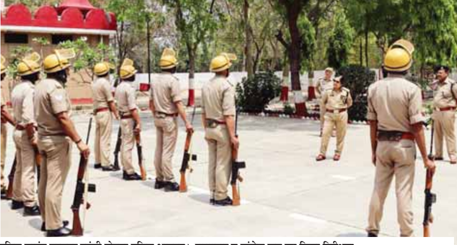
पुलिस लाइंस सूरजपुर पहुंची नोएडा पुलिस आयुक्त। शस्त्रागार व कंट्रोल रूम का किया निरीक्षण