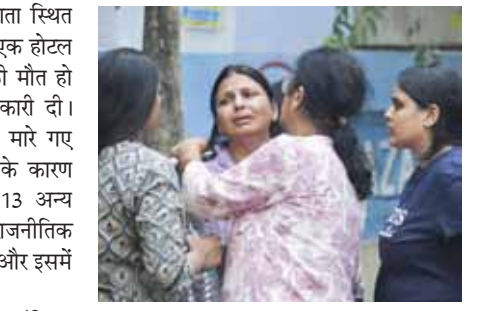
कोलकाता में ऋतुगुज होटल अग्निकांड में मारे गए आगने रिश्तेदार के शव की पहचान करने के बाद एक महिला को सात्वना देते देते।

अधिकारियों ने कहा कि छह मंजिला ऋतुगुज होटल में आग मंगलवार शाम करीब 7:30 बजे लगी और देखते ही देखते पूरी इमारत इसकी चपेट में आ गई। आग लगने की घटना के समय होटल में 42 कमरों में 88 मेहमान ठहरे हुए थे। अग्निशमन एवं आपात सेवा विभाग के एक वरिष्ठ अधिकारी ने कहा, जान गंवाने वाले अधिकतर लोग अंदर फंस गए थे और घने धुएं के कारण बाहर नहीं निकल सके। ज्यादातर मामलों में मौत का कारण दम घुटना है, जबकि