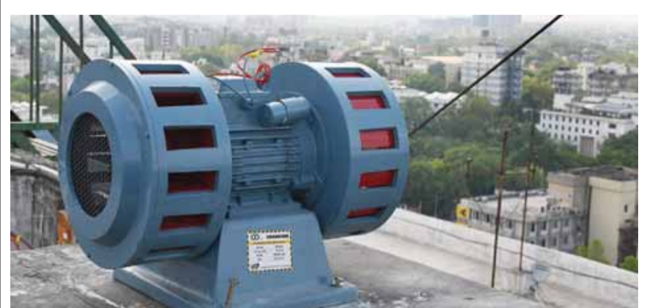
आईटीओ स्थित पीडब्ल्यूडी मुख्यालय पर लगा एयर रेड सायरन

ने बताया कि शहर की प्रमुख बहुमंजिला इमारतों पर 40 से 50 एयर रेड अलर्ट सायरन लगाए जाएंगे। आपात स्थिति में यह सायरन चेतावनी देने का काम करेंगे। सभी सायरनों को एक केंद्रीय कमांड सेंटर से नियंत्रित किया जाएगा और इनका संचालन राष्ट्रीय आपदा प्रबंधन प्राधिकरण के अधीन होगा। मंत्री ने बताया कि सायरन करीब 8 किलोमीटर की दूरी तक सुना जा सकता है। किसी भी आपात स्थिति में ये (शेष पृष्ठ 9)