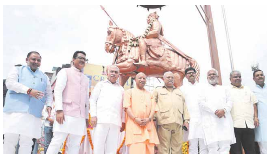
पायनियर समाचार सेवा। लखनऊ

मुख्यमंत्री योगी आदित्यनाथ ने शुक्रवार को महाराणा प्रताप जयंती के अवसर पर आयोजित एक कार्यक्रम में हिस्सा लिया। इस दौरान उन्होंने अपने संबोधन में महाराणा प्रताप, छत्रपति शिवाजी और गुरु गोविंद सिंह जैसे वीर योद्धाओं को नमन करते हुए पाकिस्तान को आतंकवाद पर घेरते हुए कहा कि उसने इतनी बड़ी हिमाकत कर दी है कि अब वह अपने वजूद के लिए संघर्ष करता दिखाई देगा। मुख्यमंत्री ने कहा कि पाकिस्तान का आतंकवादी चेहरा अब दुनिया के सामने बेनकाब हो चुका है।