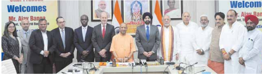
पायनियर समाचार सेवा। लखनऊ

सीएम योगी से विश्व बैंक के अध्यक्ष अजय बंगा और उनकी टीम ने की मुलाकात