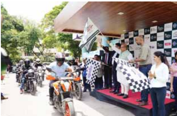
साथ पर्यावरण के प्रति लोगों को जागरूक करेंगे।

नई दिल्ली से लैंस डाउन, उत्तराखंड तक की एडवेंचर राइड 2.0 बाइक का जुनून, देवभूमि का सुकून शुरू हुई। रैली को पर्यावरण संरक्षण और सड़क सुरक्षा के प्रति जागरूकता बढ़ाने के उद्देश्य से आयोजित किया गया। सबसे खास बात इस यात्रा के दौरान राइडर्स कई जगह पौधारोपण करने के