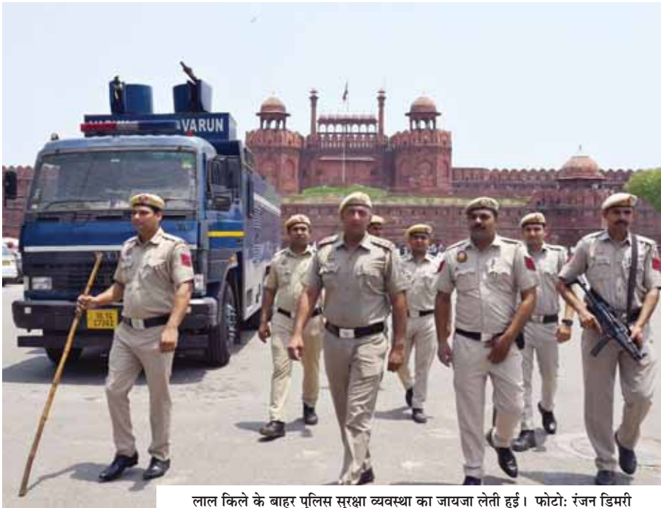
लाल किले के बाहर पुलिस सुरक्षा व्यवस्था का जायजा लेती हुई।

बढ़ते तनाव के बीच बृहस्पतिवार रात दिल्ली पुलिस के सभी कर्मियों की छुट्टियां रद्द कर दी गईं। एक अधिकारी ने बताया, रात्रिकालीन चौकसी बढ़ा दी गई है। हम हर संवेदनशील क्षेत्र में अतिरिक्त सुरक्षा बल तैयार कर रहे हैं। पुलिस सूत्रों के अनुसार, सभी क्षेत्र के विशेष आयुक्त सुरक्षा व्यवस्था का जायजा लेने के लिए अपने पुलिस उपायुक्तों के साथ बैठक कर रहे हैं। एक पुलिस सूत्र ने कहा, सभी पुलिस उपायुक्त अपने-अपने क्षेत्रों में कानून-व्यवस्था की सक्रियता से निगरानी कर रहे हैं। दिल्ली पुलिस किसी भी तरह की स्थिति से निपटने के लिए तैयार है। पुलिस ने बताया कि दिल्ली में आने वाले हर वाहन की जांच की जा रही है। कई जगह बम निरोधक दस्तों ने तलाशी अभियान भी शुरू किया है।