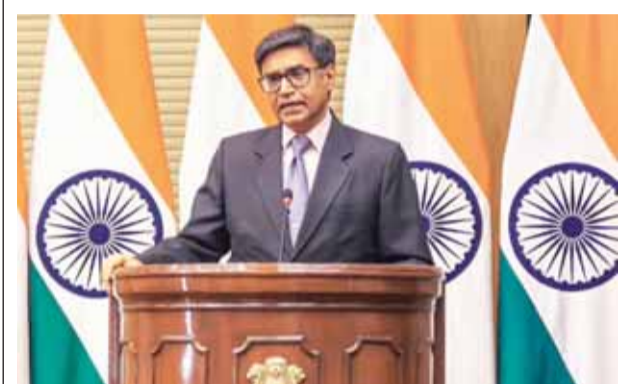
प्रेस वार्ता को संबोधित करते विदेश सचिव विवेक मिश्री।