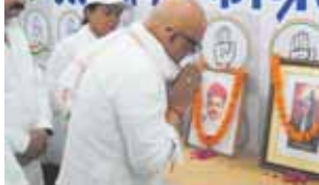
पायनियर समाचार सेवा। लखनऊ

कांग्रेस मुख्यालय में मनाई गई महाराणा प्रताप व गोखले की जयंती