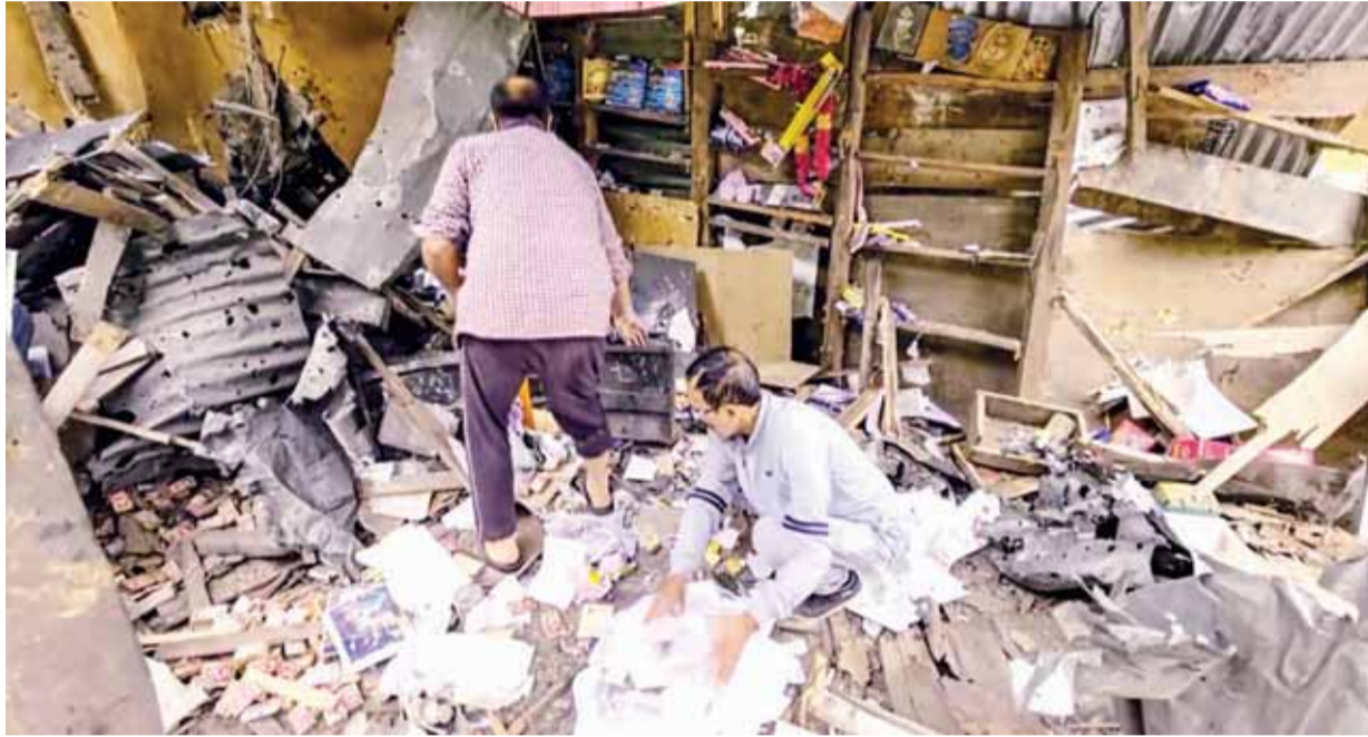
जम्मू-कश्मीर के बारामुला में सीमा पार से पाकिस्तानी सेना की फायरिंग से मलबे में तब्दील हुए अपने घर से जरूरत की सामान खोजते स्थानीय लोग।

रक्षा सूत्रों ने बताया कि इन स्थानों में बारामुला, श्रीनगर, अवंतीपोरा, नगरोटा, जम्मू, फिरोजपुर, पठानकोट, फाजिल्का, लालागढ़ जट्टा, जैसलमेर, बाड़मेर, भुज, कुआरबेट और लाखी नाला शामिल हैं। उनके अनुसार, एक सशस्त्र ड्रोन ने फिरोजपुर में एक नागरिक क्षेत्र को निशाना बनाया, जिसके परिणामस्वरूप एक स्थानीय परिवार का सदस्य गंभीर रूप से घायल हो गया। घायलों को चिकित्सा सहायता प्रदान की गई है, और सुरक्षा