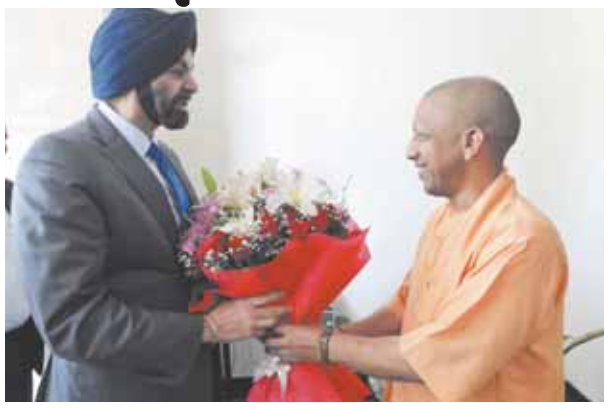
पायनियर समाचार सेवा। लखनऊ

लखनऊ में मिले गर्मजोशी भरी स्वागत से अभिभूत बंगा ने कहा कि ऐसा लाना रहा है। यूपी में मेरा वपस आ गया हूँ। यूपी में मेरा ससुराल है और 12 साल बाद यहाँ आकर मैं हर क्षेत्र में बदलाव देख रहा हूँ। उन्होंने कहा कि योगी आदित्यनाथ में विजय, दृढ़ता और ऊर्जा है। अजय बंगा ने जोर देकर कहा कि उत्तर प्रदेश